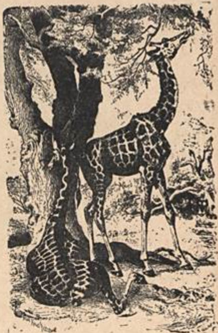
A Girafa, outra vítima dos caçadores na África.

Não se pode dizer se com o tempo os "safari" destruirão completamente os leões, os crocodilos, os elefantes, etc., do Continente Negro. Mas, considerando-se as rijas leis que