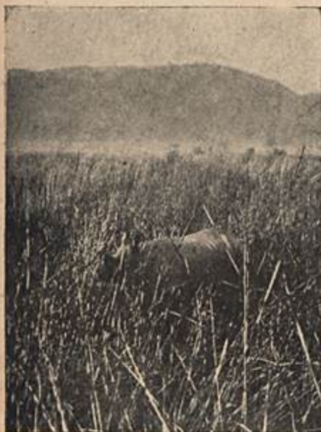
RINOCERONTE — a vítima dos caçadores na África e taxado Cr$ 5.000,00 por cabeça.

NAIROBI, (ANSA) — Bryan Dempster, famoso caçador de crocodilos, matou 400 crocodilos numa temporada só, mas ninguém sabia em que parte do Continente Negro ele realizou o morticínio daqueles monstruosos répteis, aos quais parece ter dedicado a sua existência.