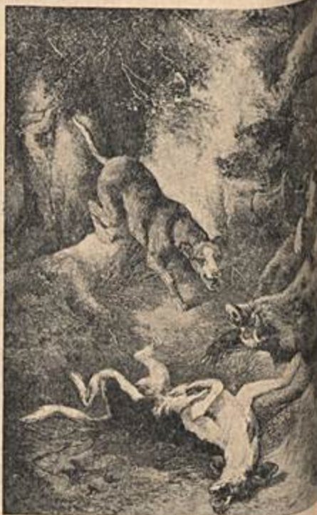
A furiosa luta em plena selva africana.

Os únicos caçadores "puros" que sobram na África são os indígenas que matam para defender-se ou alimentar-se. Eles combatem segundo a praxe das próprias feras. O leão, o leopardo, a onça não atacam o homem nem os outros animais selvagens, a não ser para defender-se ou comer. Nunea por crueldade. A caça como esporte, isto é, sem