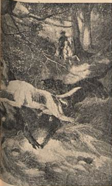
do da revista portuguesa "A CAÇA".

Hemingway ambientou alguns contos entre o Kilimandjaro e o monte Quênia, e o cinema confiou ao prestígio de Ava Gardner, Clark Gable e Gregory Peck o papel daqueles personagens envolvidos em dramáticas aventuras de caça na mata virgem africana. Nos últimos anos, os caçadores brancos multiplicaram-se e em certas épocas, no Quênia, se realizaram até 40 safaris contemporaneamente. Os resultados são evidentes: as poucas feras que sobreviveram à chacina estão quase todas guardadas nos parques nacionais. Hoje a superorganização garante qualquer assistência e conforto ao turista: feras e até mesmo a arma infalível, a espingarda do "White hunter", do organizador, que intervém quando o cliente não alcança o alvo. O cliente, portan-