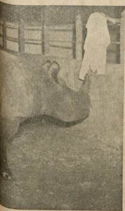
Esta Vista está extrahendo a sua nova e breve olhar os visitantes com mais

Para o naturalista, o traço mais importante que separa os rinocerontes africanos dos asiáticos consiste na dentadura, pois estes têm incisivos e caninos e aqueles não. Todavia, o rinoceronte de Sumatra, que parece intermediário entre as espécies unicórnias e as da