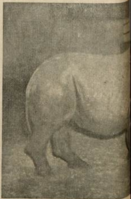
Este hospede do jardim zoológico da Quinta da Boa Vista, não tem a cor que lhe dá o nome, mas temos certeza que o Rinoceronte

Não se trata de variedade, raça ou espécie. A diferença de chifres dos rinocerontes