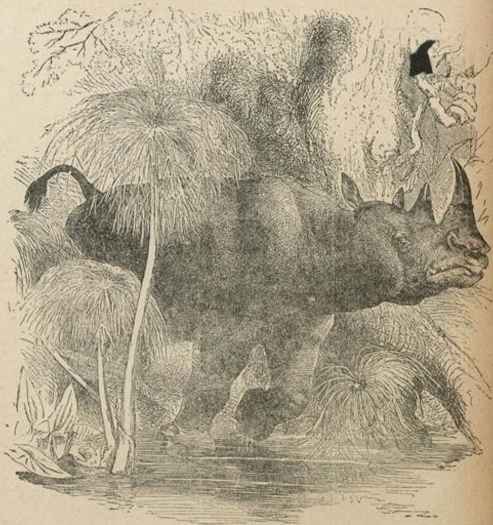
Rhinoceros bicornis, que vive desde Acafraria até Abissínia.