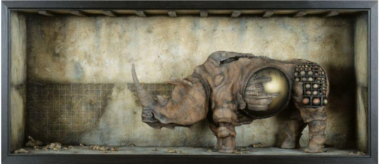
"Diorama 7" 105 x 48 x 24 cm., 2000

Oscar Sanmartín es un artista español cuya obra me encanta, y del cual publiqué unas cuantas cosas. También en su momento me reservé la parte de su trabajo dedicada a los rinocerontes, que en este caso se concreta en dos dioramas , uno de ellos con uno como único protagonista, y otro con el de Durero como fondo de uno de los singulares personajes del artista. Ambos realmente preciosos.