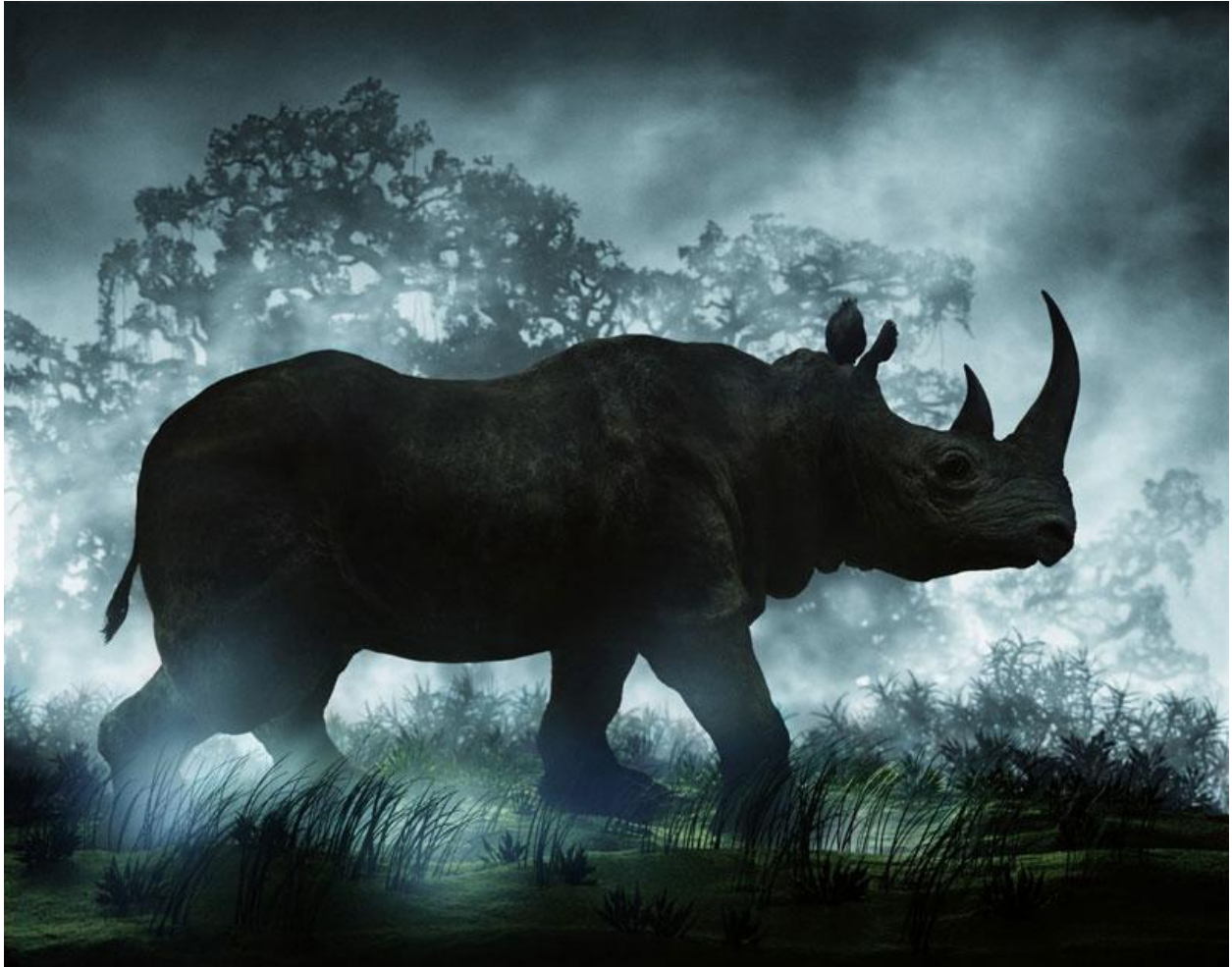
"Le Rhinocéros (El Rinoceronte), 96 x 120 cm., 2004 © Didier Massard. Baudoin Lebon, París.

Didier Massard es un fotógrafo francés del que publiqué recientemente un post con algunos de sus trabajos. Encontré este rinoceronte, pero tiene además toda una serie de paisajes y otros animales con unas atmósferas muy sugestivas.