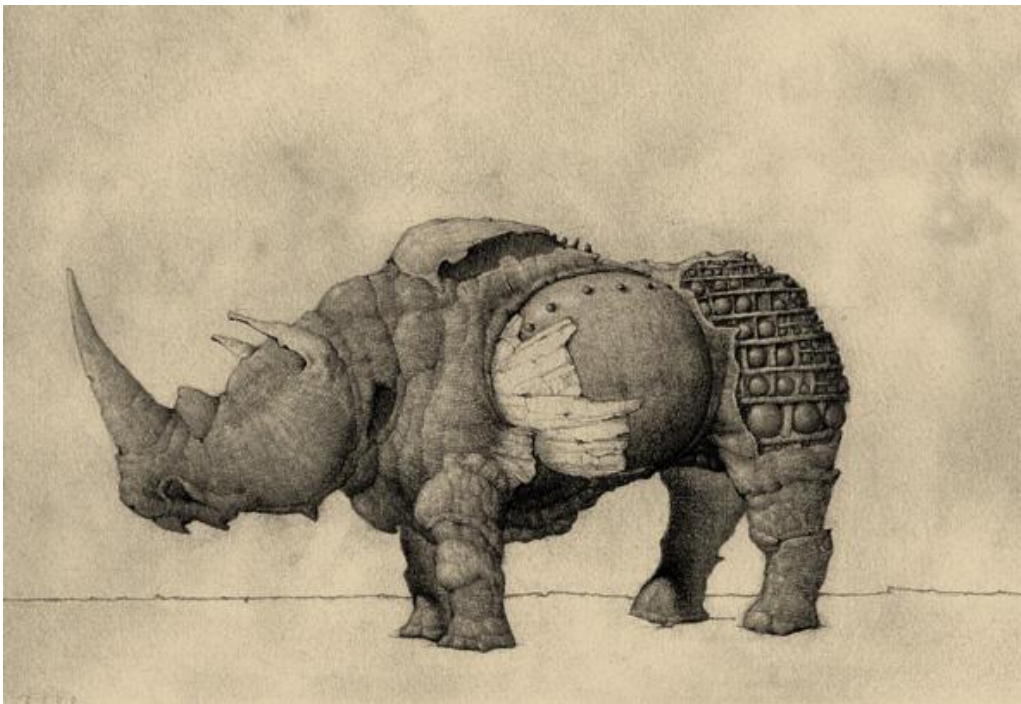
Dibujo que sirvió de base para el / drawing for "Diorama 7", 2000

Oscar Sanmartín es un artista español cuya obra me encanta, y del cual publiqué unas cuantas cosas. También en su momento me reservé la parte de su trabajo dedicada a los rinocerontes, que en este caso se concreta en dos dioramas , uno de ellos con uno como único protagonista, y otro con el de Durero como fondo de uno de los singulares personajes del artista. Ambos realmente preciosos.