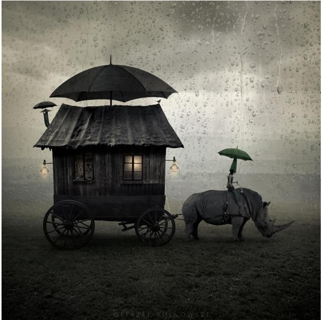
"Viaje / Journey", 2012

Leszek Bujnowski es un excelente fotógrafo que realiza unos trabajos preciosos en fotomanipulación, y de quién publiqué recientemente este post con una selección de algunos que me han gustado especialmente. Me reservé estas tres imágenes llenas de su tradicional melancolía (de niebla, lluvias y desiertos) con rinocerontes como coprotagonistas.