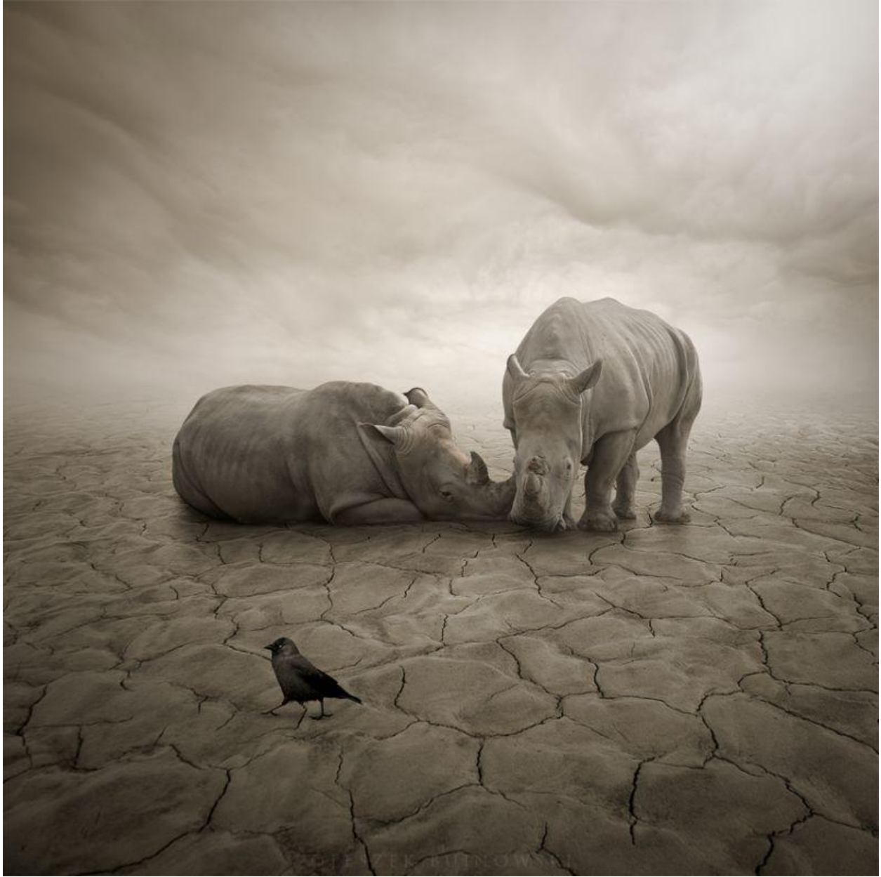
"Perdido en el desierto / Lost in the Desert "

Leszek Bujnowski en "El Hurgador" / in this blog :