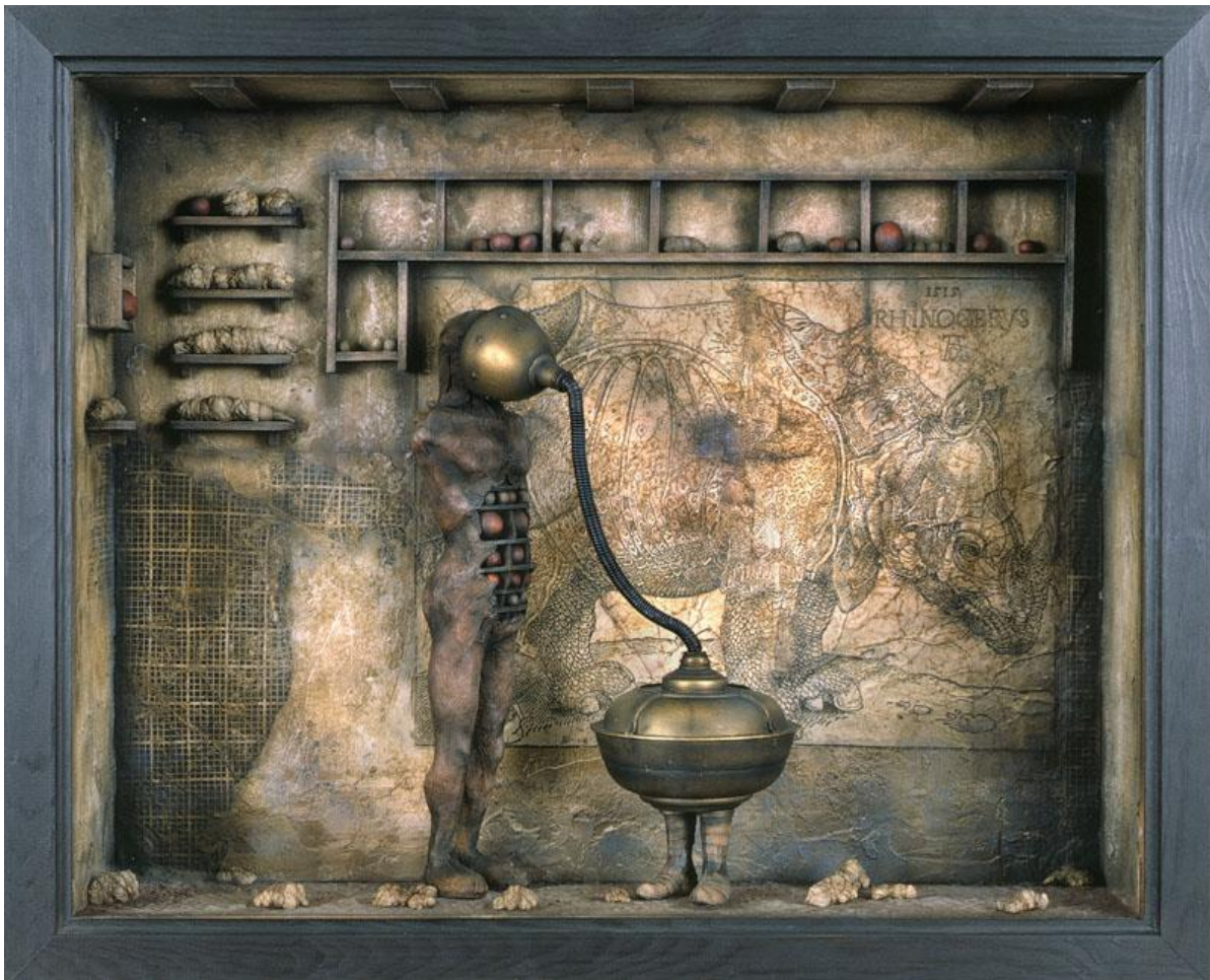
"Diorama 3", 45 x 54 x 14 cm., 2000

The documentary (in spanish) is a very interesting one about dioramas creation and Oscar's work, shooted during 3 years since 1999.