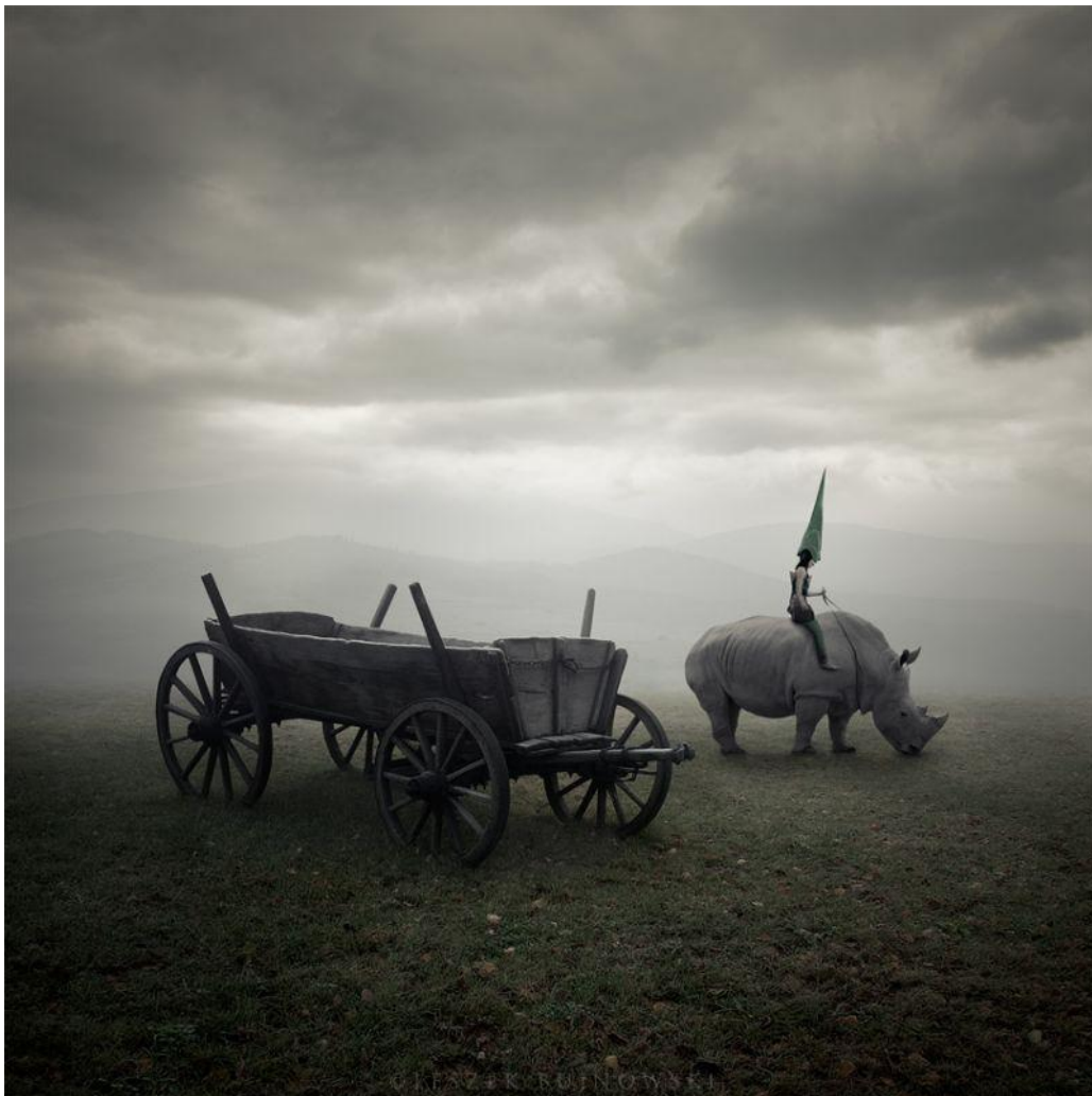
"Jinete de Rinoceronte / Rhino Rider ", 2011