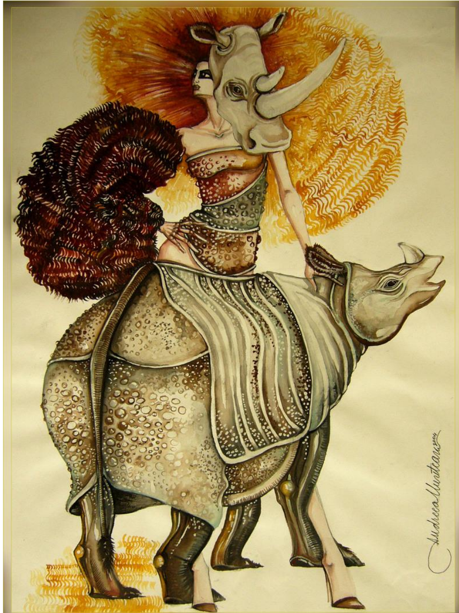
"Rinocerontes / Rhinos", acuarela sobre papel / watercolor on paper , 2004 Composición de moda inspirada en "El Rinoceronte", obra literaria del rumano E. Ionesco. Realizado para una muestra en honor de éste escritor / Fashion composition inspired by "The Rhinoceros" by E. Ionesco. Made for an exhibition in honor of this writer.

Andreea Muntean, que se identifica en deviantart como " dushky ", es una creadora rumana de diseños de moda de la que casualmente descubrí este trabajo inspirado en rinocerontes, cuya composición me pareció muy curiosa. Se puede recorrer su trabajo tanto en deviantart como en su blog .