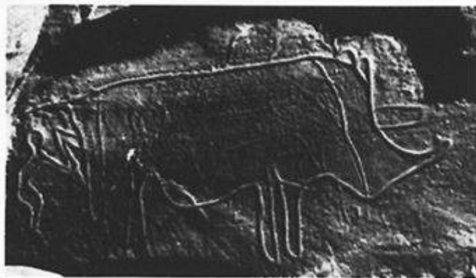
Homme tenant une hache, approchant d'un rhinocéros par l'arrière. Station de Tazarine nord-ouest, Maroc.