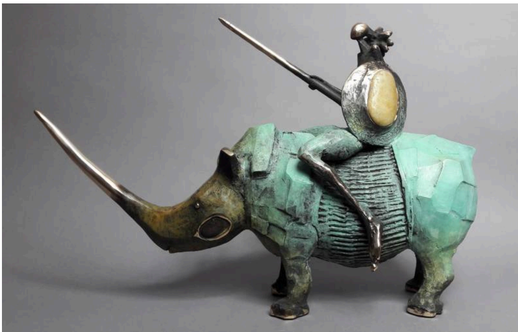
Bronce / bronze