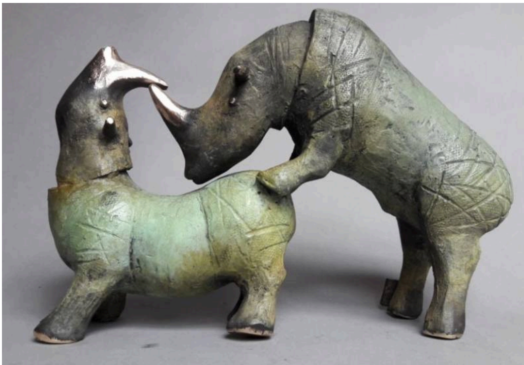
"Rinocerontes enamorados / Rhinos in Love ", bronce / bronze, 16 x 24 cm.

Dariusz Zieliński en "El Hurgador" / in this blog : [Todos los enlaces / All Links]