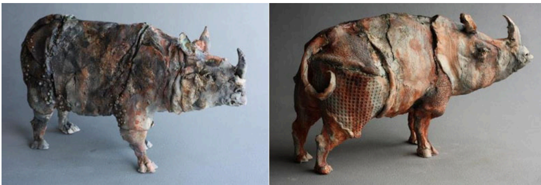
Izq./ Left: "Rocco", cerámica / ceramic Der./ Right: "Ronnie", cerámica / ceramic, 33 x 55 x 25 cm.