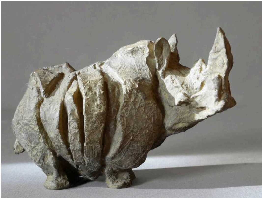
"Neushoorn / Rinoceronte / Rhino", bronce / bronze, altura / height: 11 cm., 2013

(Ámsterdam, Holanda / Netherlands , 1954-)