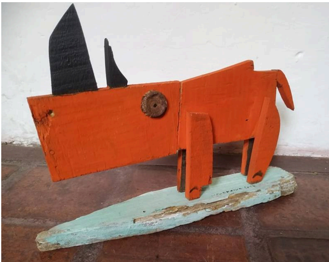
"Rinoceronte rojo / Red Rhino"

William Moreira Cruz is a Uruguayan sculptor and painter who creates ingenious sculptures from discarded materials, wood scraps, old tools and all kinds of recycled objects. Grouped under the generic title of "Crazy Bugs", his production includes these beautiful rhinoceroses. More images and information in the previous posts about the artist.