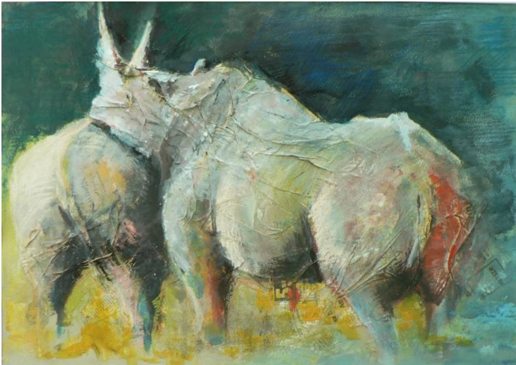
"Neushoorn / Rinoceronte / Rhino ", técnica mixta / mixed media, 68 x 47 cm., 1992

Más sobre / More about Antoinette Briët: Website , Wikipedia (Holandés / Dutch)