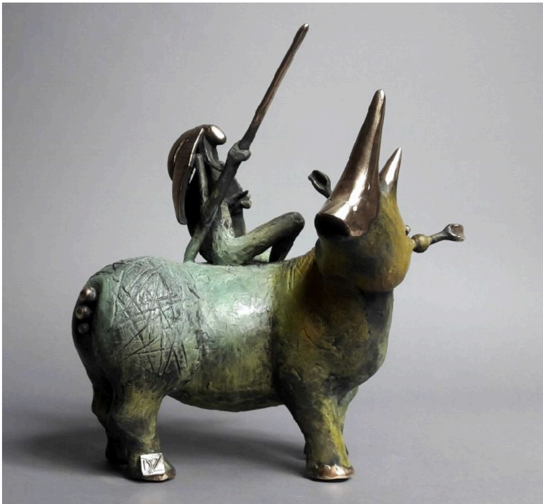
"Jinete de rinocerontes / Rhino Rider", bronze / bronze, 30 x 29 cm.

Política, Militares / Politics, Royalty, Nobility, Aristocracy