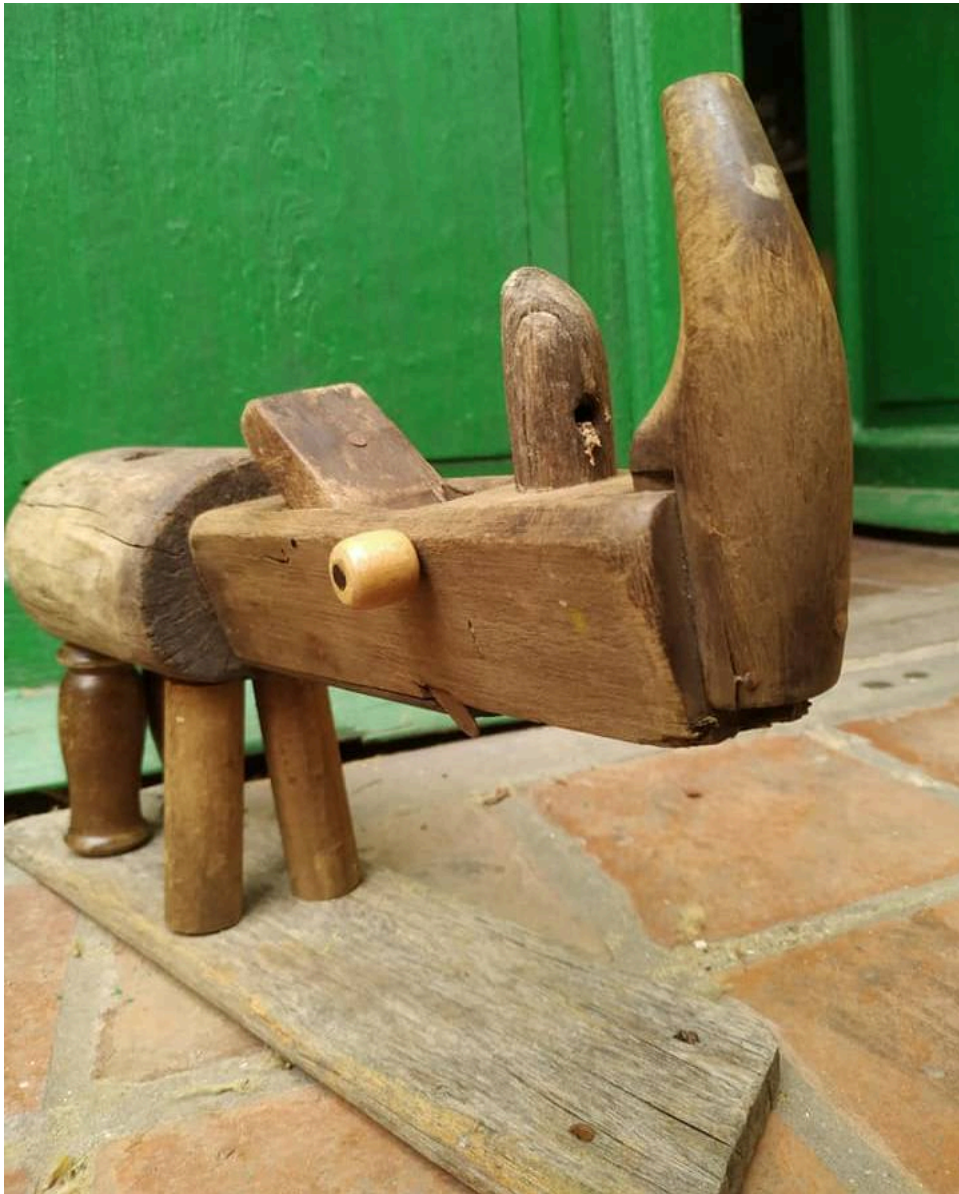
"Rinoceronte / Rhino"