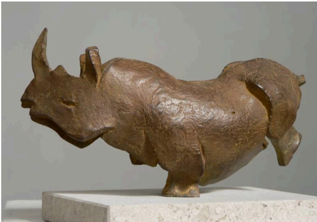
"Neushoorn / Rinoceronte / Rhino", bronze / bronce, altura / height: 8 cm., 2007

Antoinette Briët is a Dutch sculptor born in 1954. In her website we can read: