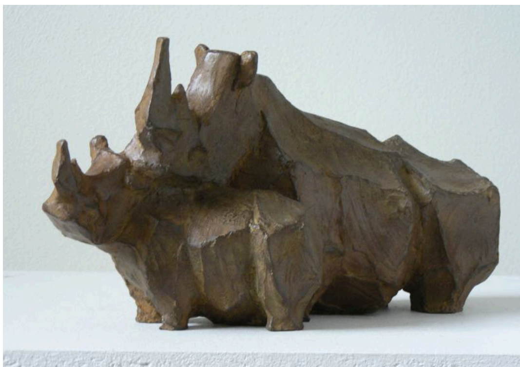
"Jong en oud / Joven y viejo / Young And Old", bronce / bronze, altura / height: 20 cm., 1997

Estudié en la Rijksacademie van Beeldende Kunsten (1971-1976) en Amsterdam. Recibí lecciones de Paul Grégoire, Piet Esser y Thérésia van de Pant. En 1985 hice la formación pedagógica de arte y desde 1976 trabajo en Eindhoven.»