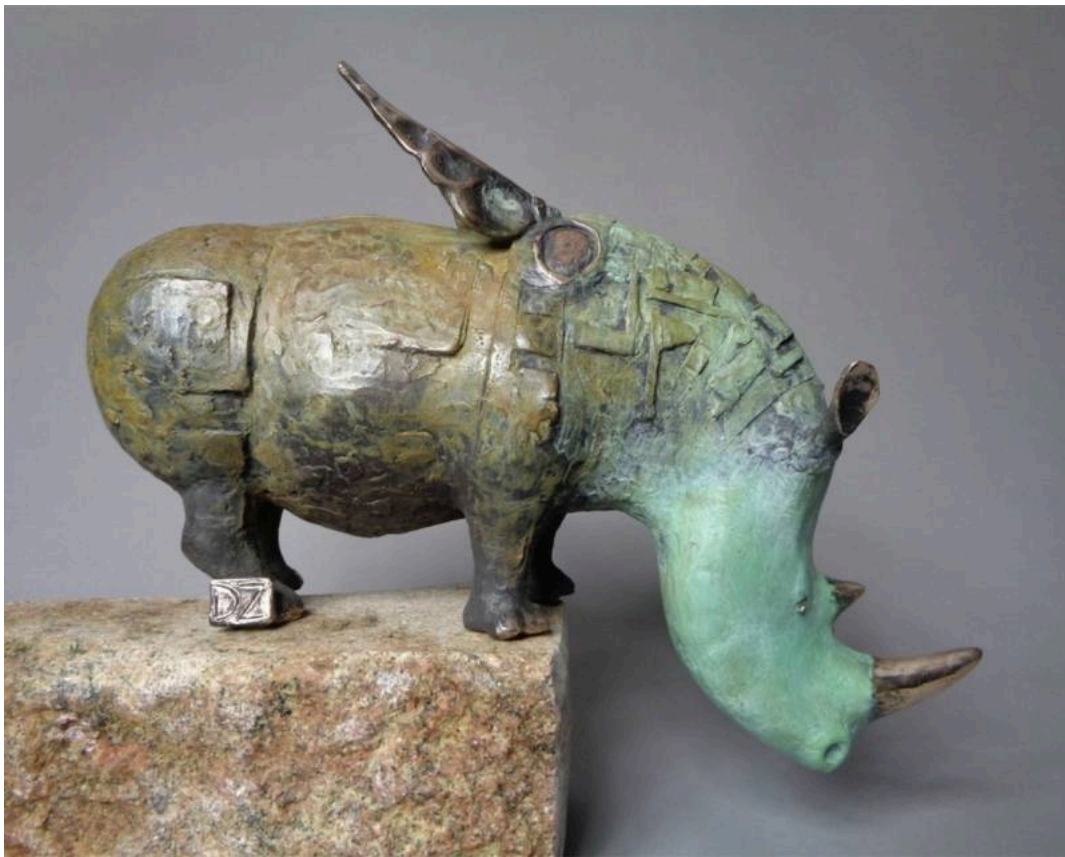
"Pomimo wszystko spróbuję / Lo intentaré, después de todo / I Will Try After All" Bronze, piedra / bronze, stone, altura / height: 30 cm.