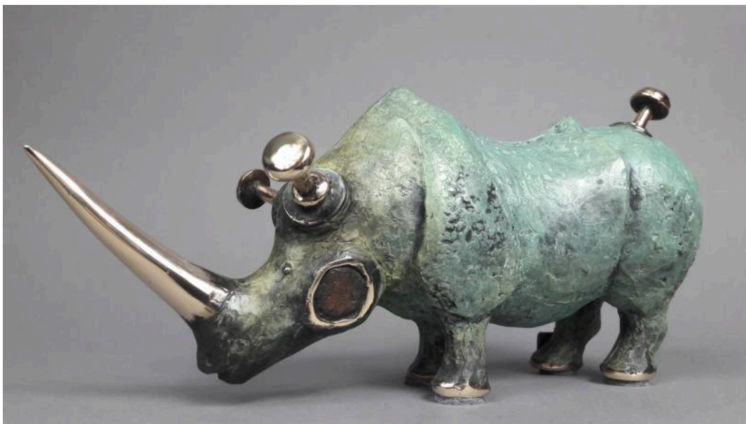
Bronze / bronze

More images and information about Dariusz in the various published posts (links below).