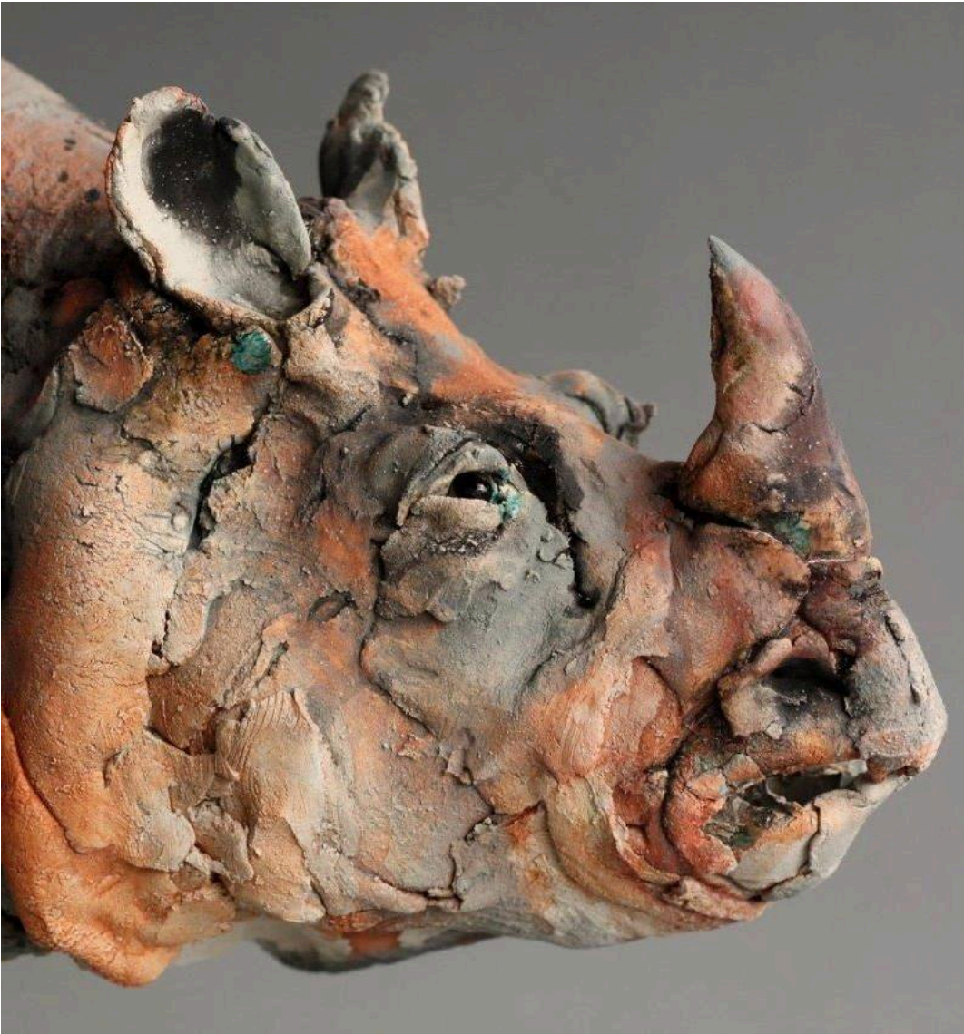
"Rinoceronte asiático / Asian Rhino, Juliet" (detalle / detail)