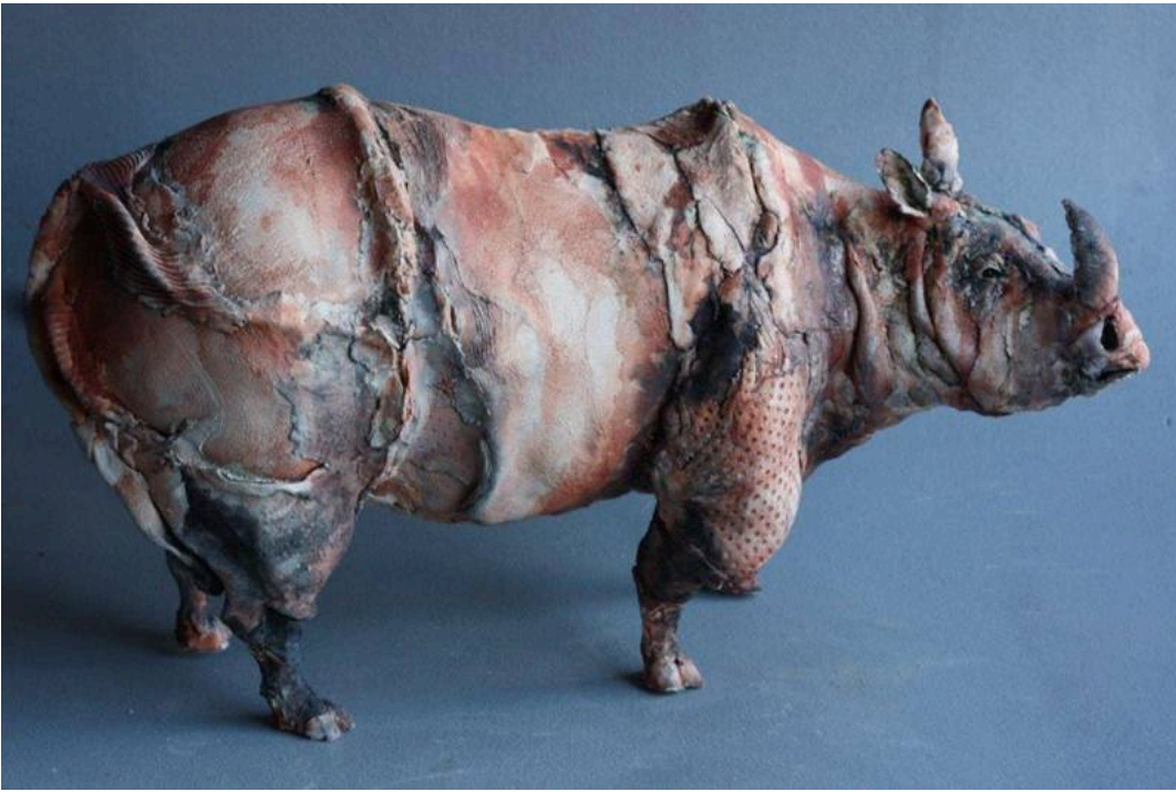
"Mikumi", cerámica / ceramic, 41 x 67 x 25 cm.