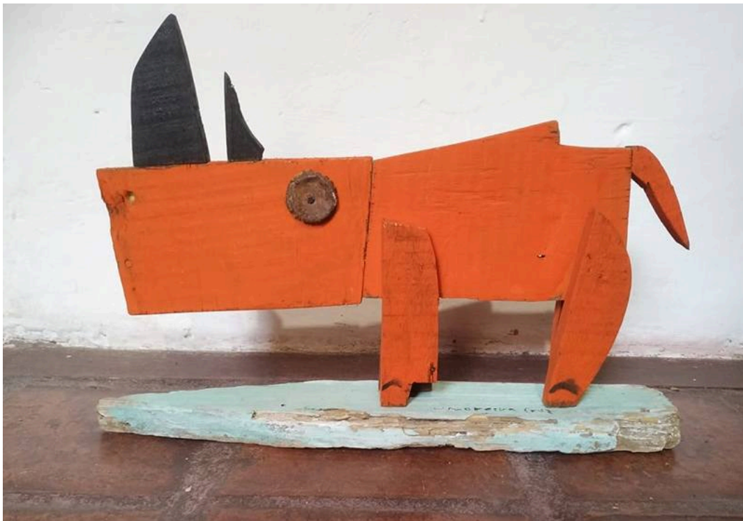
"Rinoceronte rojo / Red Rhino", madera / wood

William Moreira Cruz is a Uruguayan sculptor and painter who creates ingenious sculptures from discarded materials, wood scraps, old tools and all kinds of recycled objects. Grouped under the generic title of "Crazy Bugs", his production includes these beautiful rhinoceroses. More images and information in the previous posts about the artist.