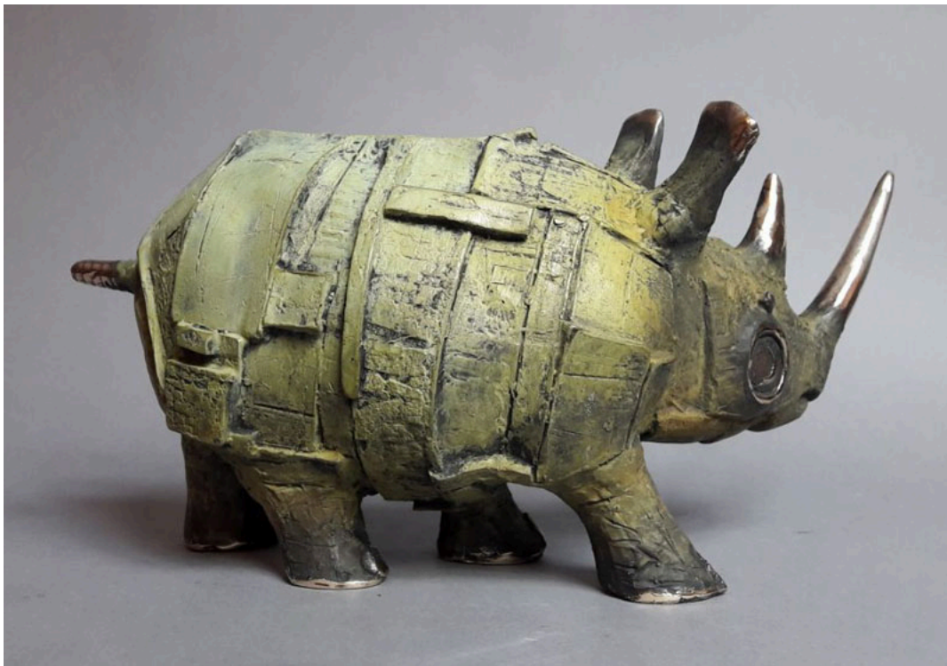
"Nosorożec z pasków / Rinoceronte Rayado / Striped Rhino", bronze / bronze, 32 x 16 cm., 2018