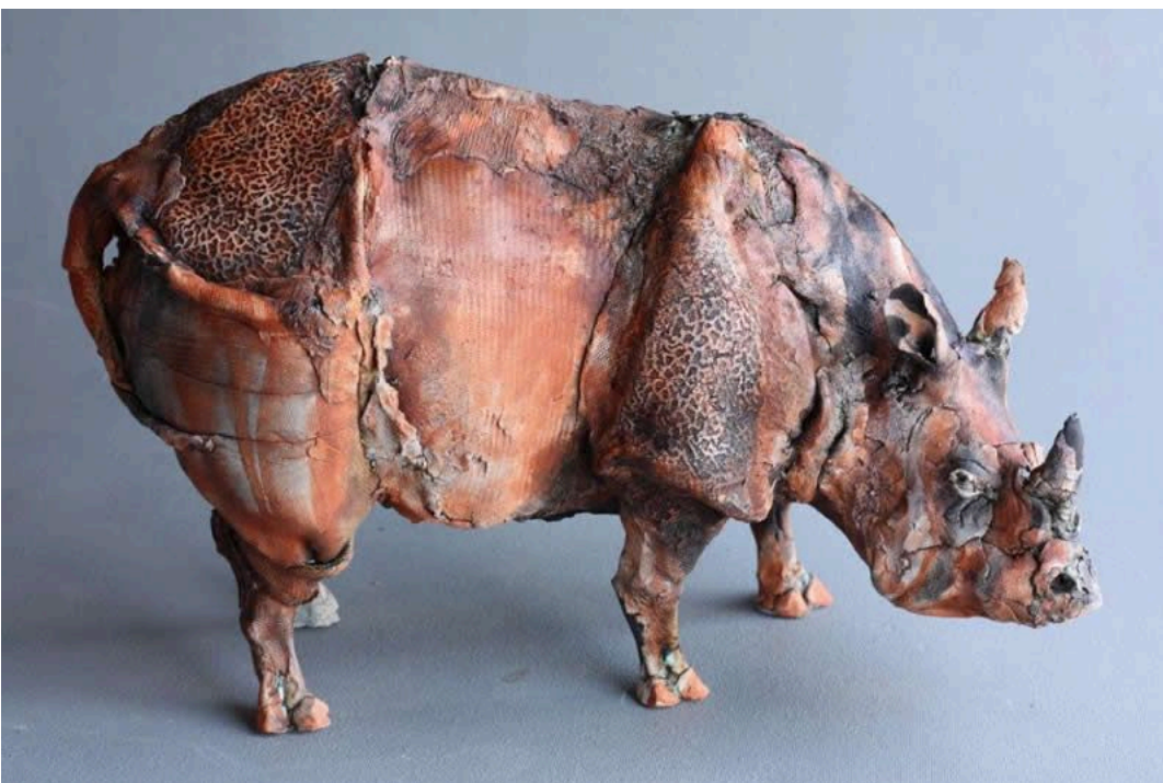
"Herbert", cerámica / ceramic, 36 x 56 x 30 cm.