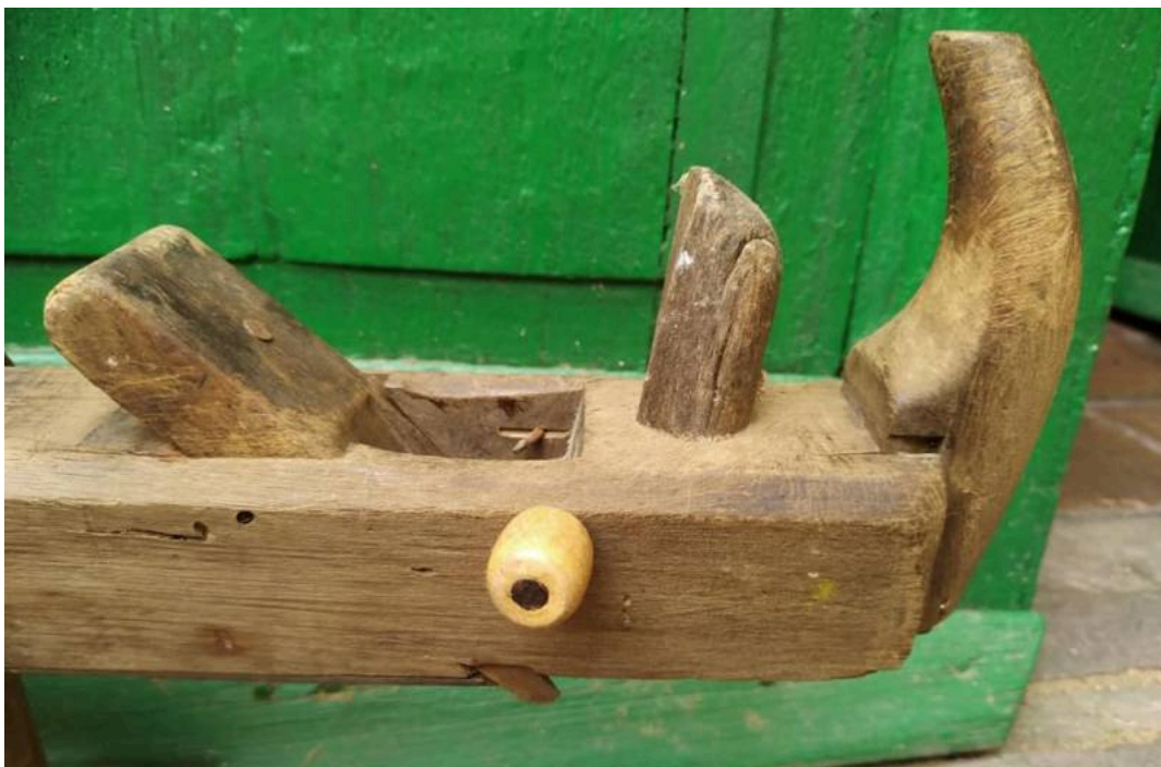
"Rinoceronte / Rhino"

photogravure (5) photojournalism (3) photomanipulation (103) pintura (1439) pintura en resina (1) pintura gongbi (1) pintura sobre madera (1) pintura sobre plumas (1) pinturas rupestres (1) pirograbados (2) planos (2) poesía (1) poetry (1) porcelain (8) porcelana (8) portrait (216) posters (15) pottery (1) premios Dardos (1) proyecto 365 (4) publicidad (14) pyrography (2) quilling (1) ready-made (1) recomendaciones (5) recommendations (4) red ochre (1) relicarios (1) reliquaries (1) relojes (1) repostería (2) resin painting (1) retrato (216) revistas (2) rock art (1) rugs (1) sand art (3) scientific illustration (9) scratchboard (2) screenprint (2) sculpture (582) serigrafía (27) serigraphy (25) shoes (7) silbo gomero (1) silkscreen (7) sound sculpture (1) spiders (2) sports (6) stamps (4) statistics (1) steampunk (4) stereograph (2) stoneware (1) street art (2) subastas (1) superhéroes (1) superheros (1) tallas (2) tapestry (9) tapices (9)