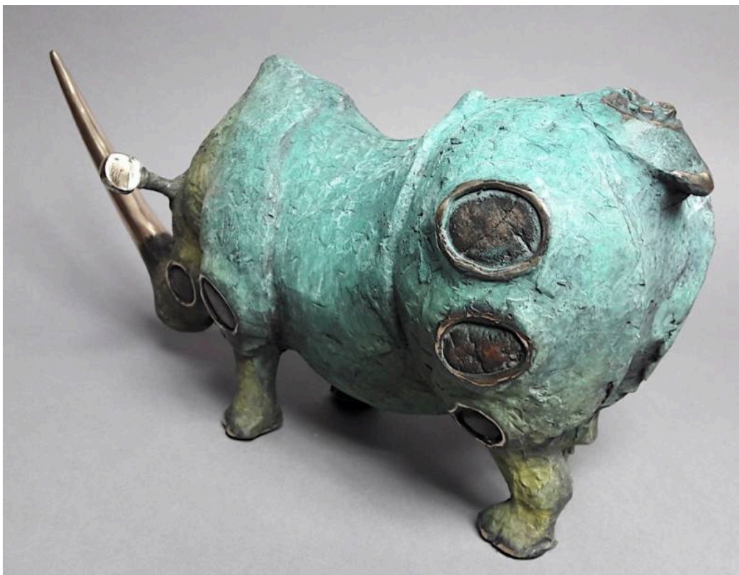
"Rinoceronte triste / Blue Rhino ", bronce / bronze

diseño conceptual (2) diseño gráfico (4) dogs (94) dolls (2) drawing (390) ecología (1) ecology (1) EEI (1) egg tempera (5) electron microscope (1) embroidery (6) engraving (170) ensamblajes (1) enthomology (5) entomología (6) entrevistas (73) escultura (582) escultura cinética (2) escultura en papel (2) escultura sonora (1) esgrafiado (1) estadísticas (1) estereografía (2) etching (3) etchings (51) ex libris (11) exhibitions (11) exposiciones (11) face art (1) fallecimientos (26) fashion (12) feng shui (1) filatelia (7) fileteado (1) filigrana de papel (1) fishing (1) flags (1) flores (3) flowers (3) fotograbado (2) fotograbados (3) fotografía (834) fotografía con rayos X (3) fotografía submarina (7) fotomanipulación (106) fotoperiodismo (3) frescos (11) Fundación Gala-Salvador I fungi (1) furniture (7) gabinetes (1) gatos (16) gesso (1) gifs animados (4) Gomera whistle (1) gongbi (1) grabado (27) grabados (149) graffiti (13) graphic arts (6) graphic design (4)