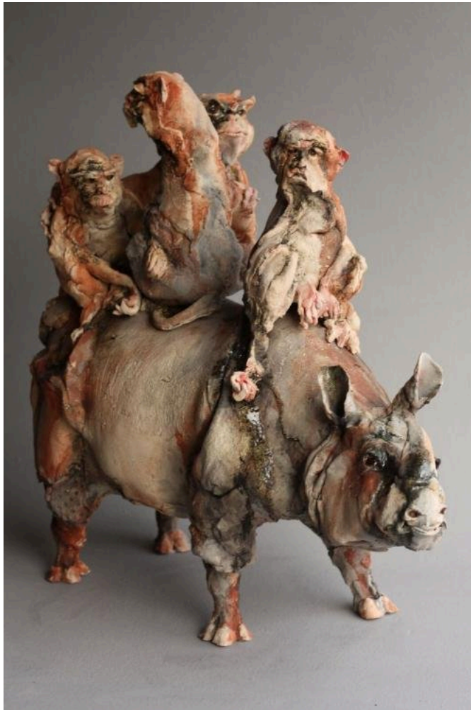
"Monkey Business", cerámica / ceramic