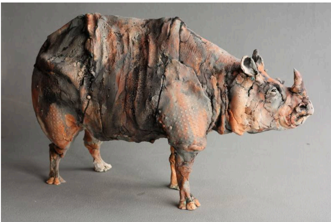
"Rinoceronte asiático / Asian Rhino, Julliet", cerámica / ceramic