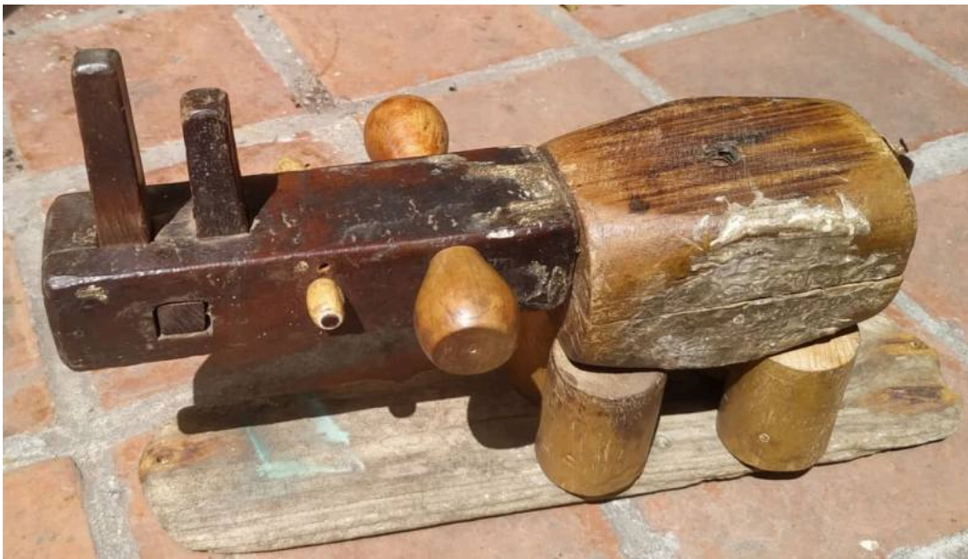
"Rinoceronte / Rhino"

Gramil de carpintero, maceta de madera, mangos de cepillo de peluquero, palo redondo, etc./ carpenter's marking gauge, wooden mallet, hairdresser's brush handles, round stick, etc.