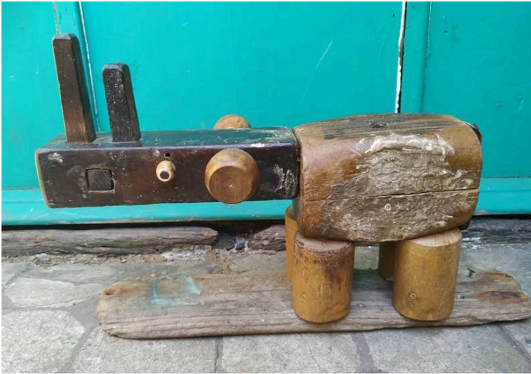
"Rinoceronte / Rhino", 33 x 20 x 12 cm. aprox.

Gramil de carpintero, maceta de madera, mangos de cepillo de peluquero, palo redondo, etc./ carpenter's marking gauge, wooden mallet, hairdresser's brush handles, round stick, etc.