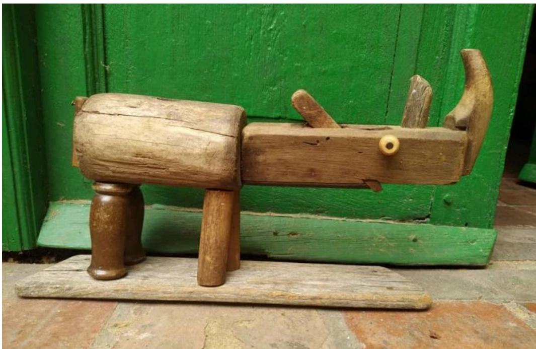
"Rinoceronte / Rhino"

Cepillo de carpintero, maceta y maderas varias / carpenter's plane, mallet and various woods