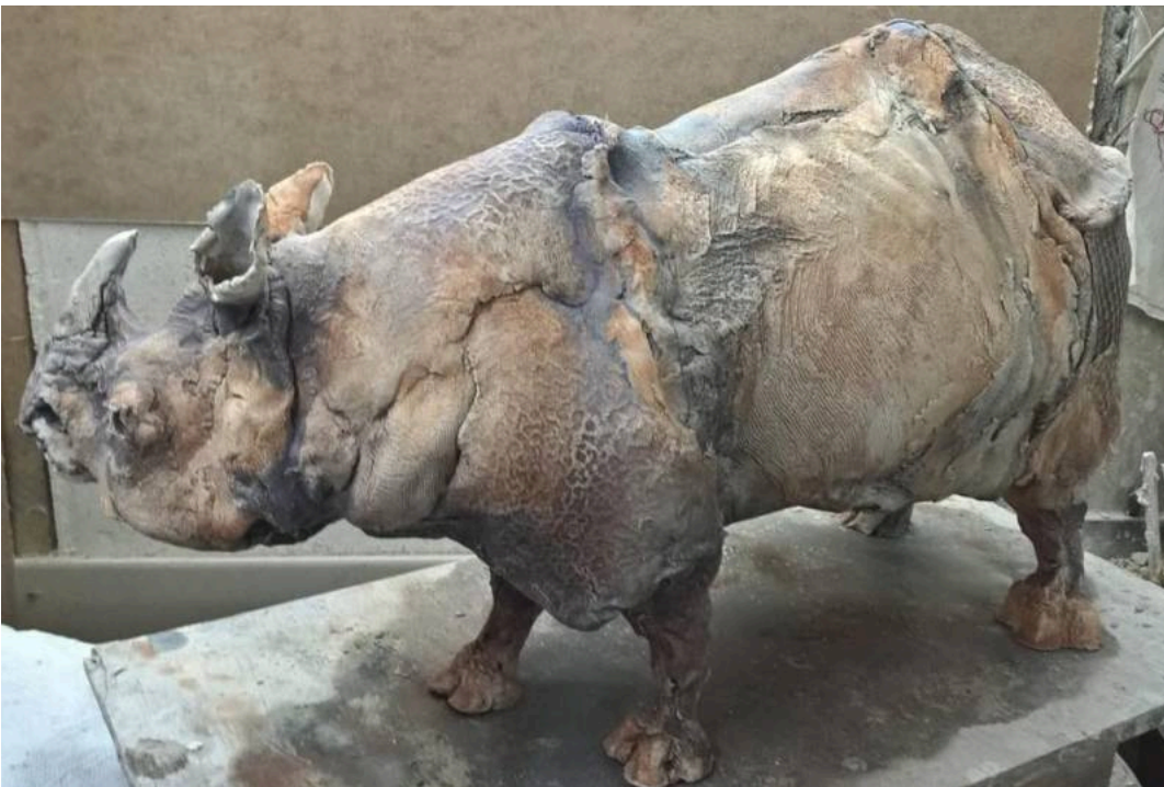
Rinoceronte, obra en proceso / Rhino work in progress