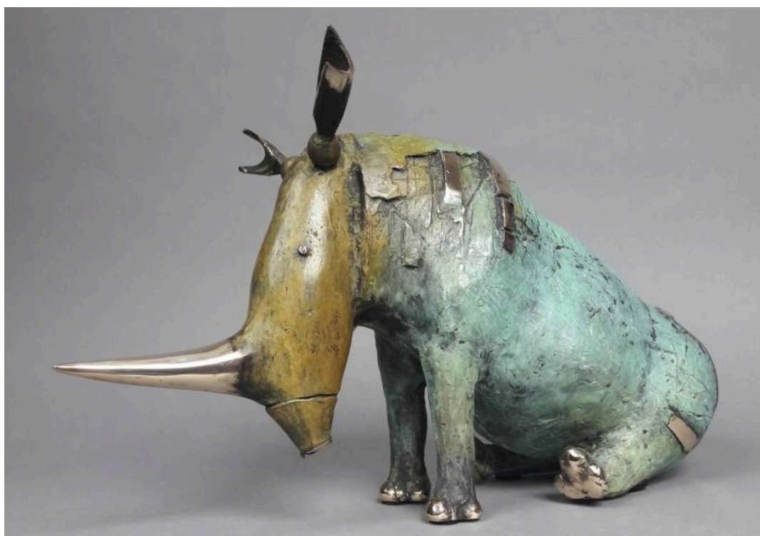
"Siedzący nosorożec / Rinoceronte sentado / Sitting Rhino ", bronce / bronze, 23 x 43 x 13 cm., 2018

Dariusz Zieliński es un estupendo escultor polaco, amigo del blog, que recientemente me ha remitido imágenes de sus últimas creaciones. Su predilección por los rinocerontes se sigue reflejando en estas nuevas obras, así que les dejo una sabrosa selección de bronce con nuestros unicornios gordos como protagonistas.