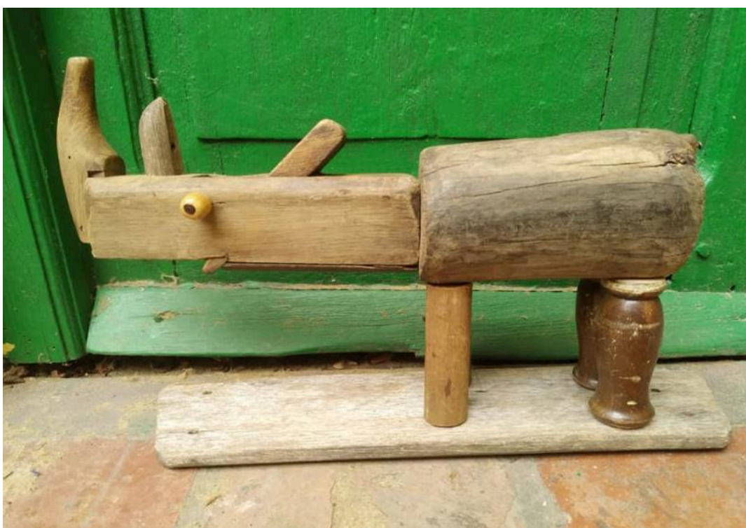
"Rinoceronte / Rhino"

William Moreira Cruz es un escultor y pintor uruguayo que crea ingeniosas esculturas con materiales de descarte, restos de madera, antiguas herramientas y todo tipo de objetos reciclados. Agrupados dentro del título genérico de "Bichos locos", entre su producción se cuentan estos bellos rinocerontes. Más imágenes e información en los post previos sobre el artista.