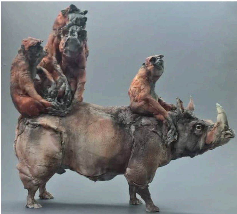
"Monkey Business", cerámica / ceramic