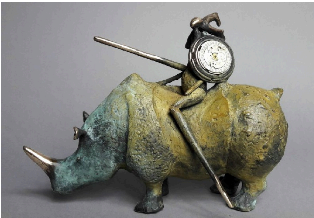
"Jinete de rinocerontes con reloj / Rhino Rider With Clock ", bronce / bronze, 17 x 21 cm.