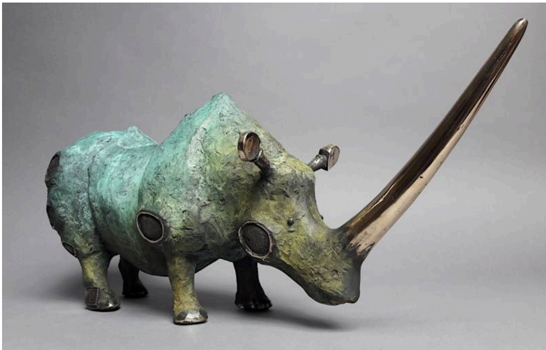
"Rinoceronte triste / Blue Rhino ", bronce / bronze, 43 x 20 cm.