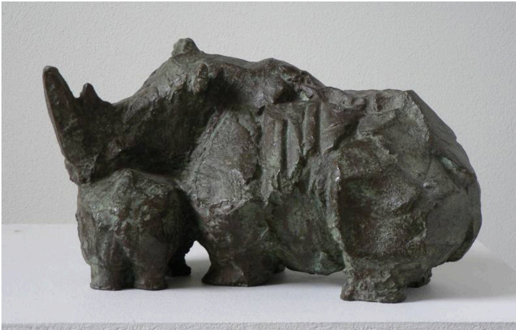
"Moeder en jong / Madre y joven / Mother and Young ", bronce / bronze, altura / height: 30 cm., 1992