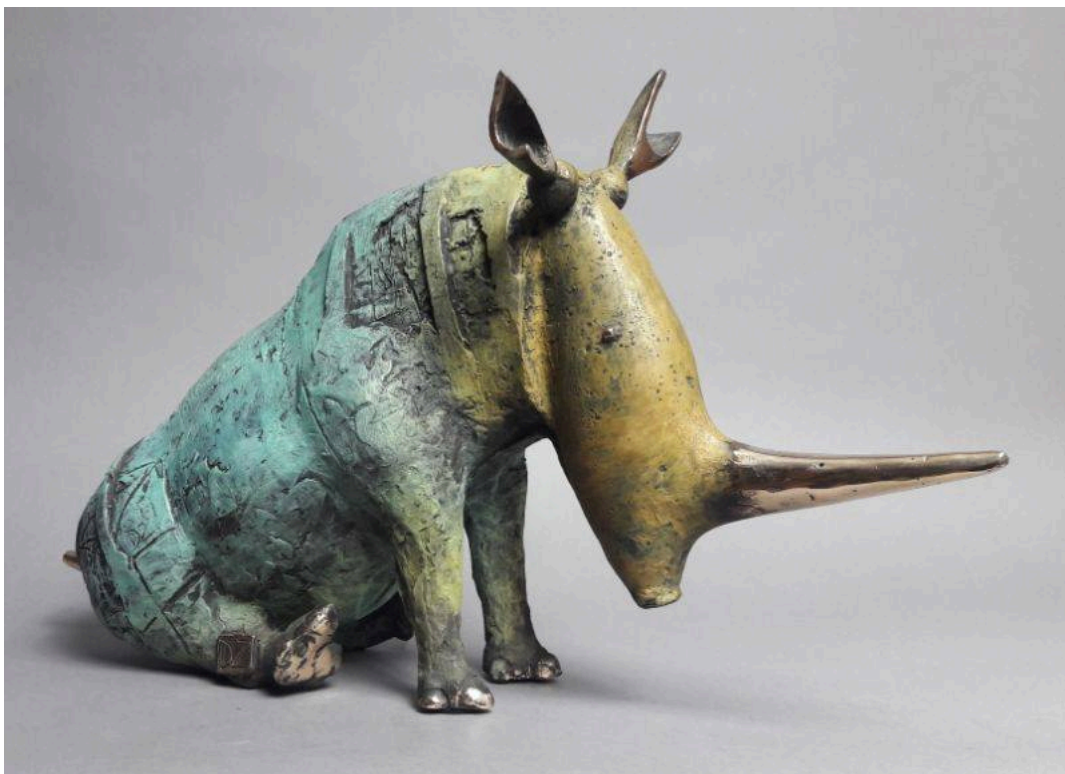
"Siedzący nosorożec / Rinoceronte sentado / Sitting Rhino"