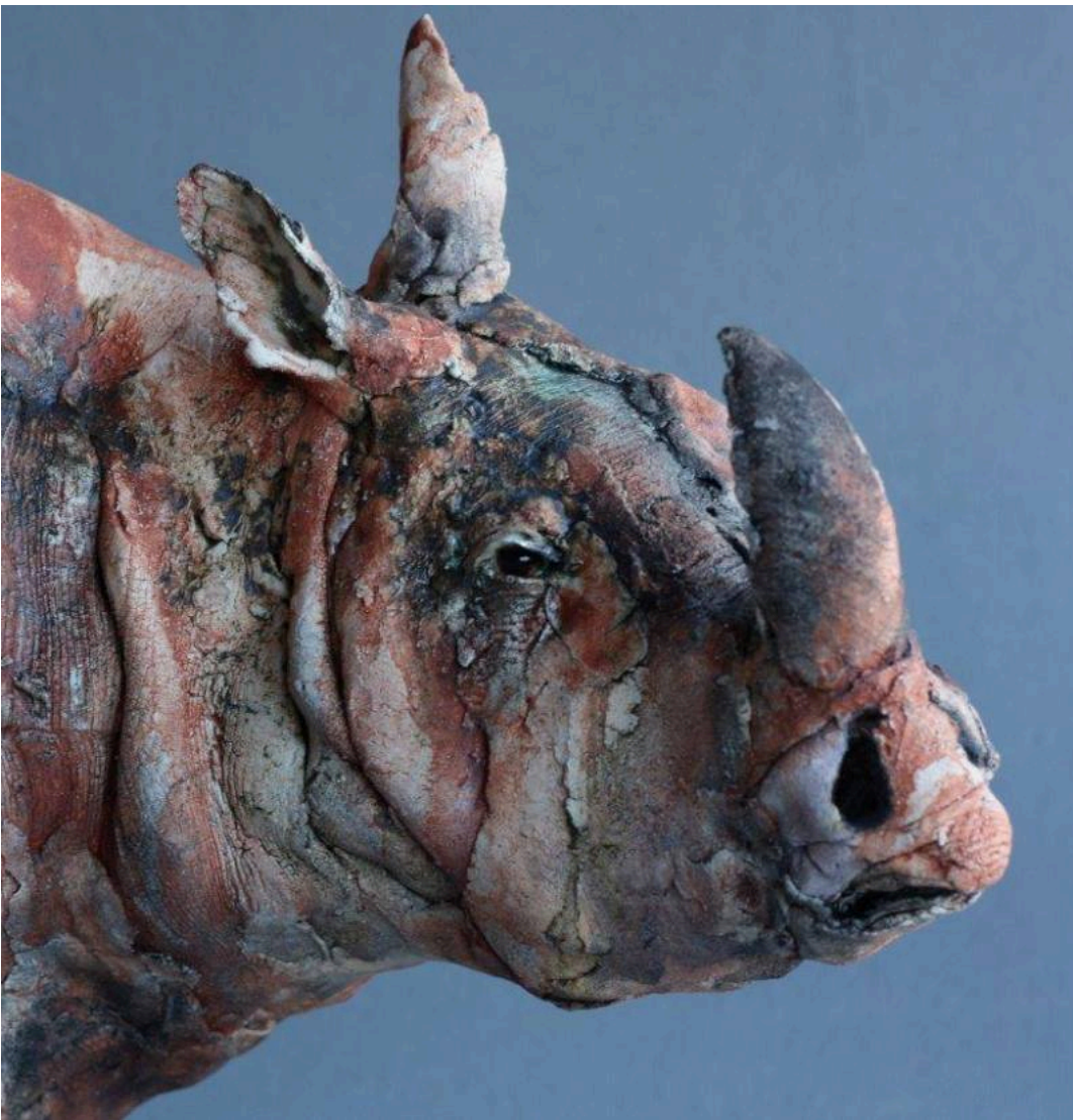
"Mikumi" (detalle / detail)

Ostinelli & Priest en "El Hurgador" / in this blog: [Ostinelli & Priest (Cerámica)]