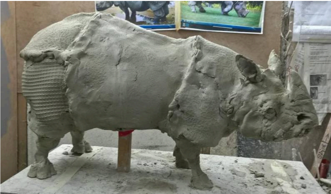
Rinoceronte, obra en proceso / Rhino work in progress