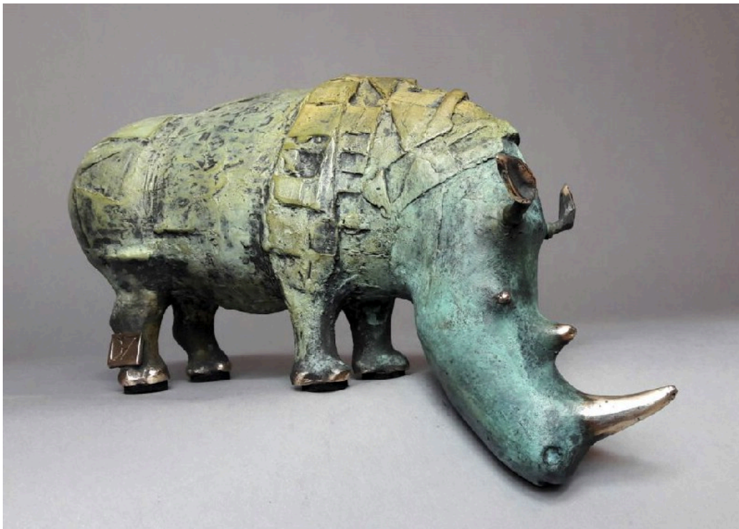
"Rinoceronte bebiendo / Drinking Rhino ", bronce / bronze, 13 x 23 cm.