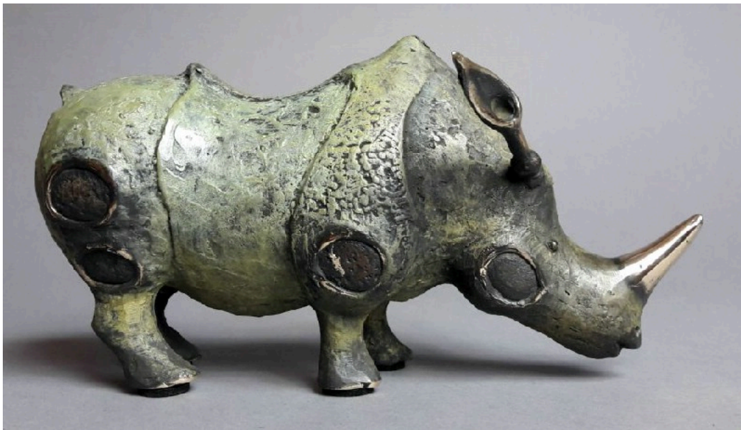
"Rinoceronte con grandes orejas / Rhino With Big Ears ", bronce / bronze, 12 x 21 cm.