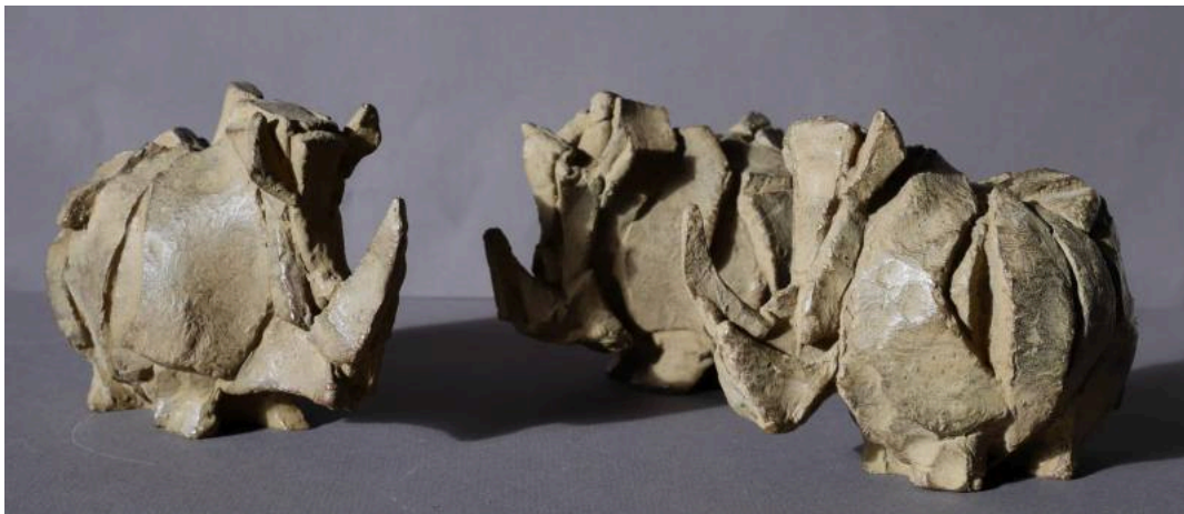
"Conclaaf / Cónclave", bronze / bronce, altura / height: 10 cm., 2013