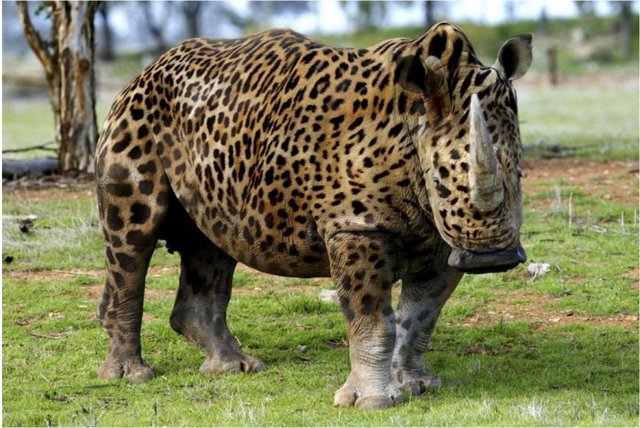
"Rinopardo / Rhinopard"

A funny photomanipulation. Here you can see how to create this hybrid. There are a few similar. It seems like crossbreed rhinos with zebras is a kind of practice with many followers.