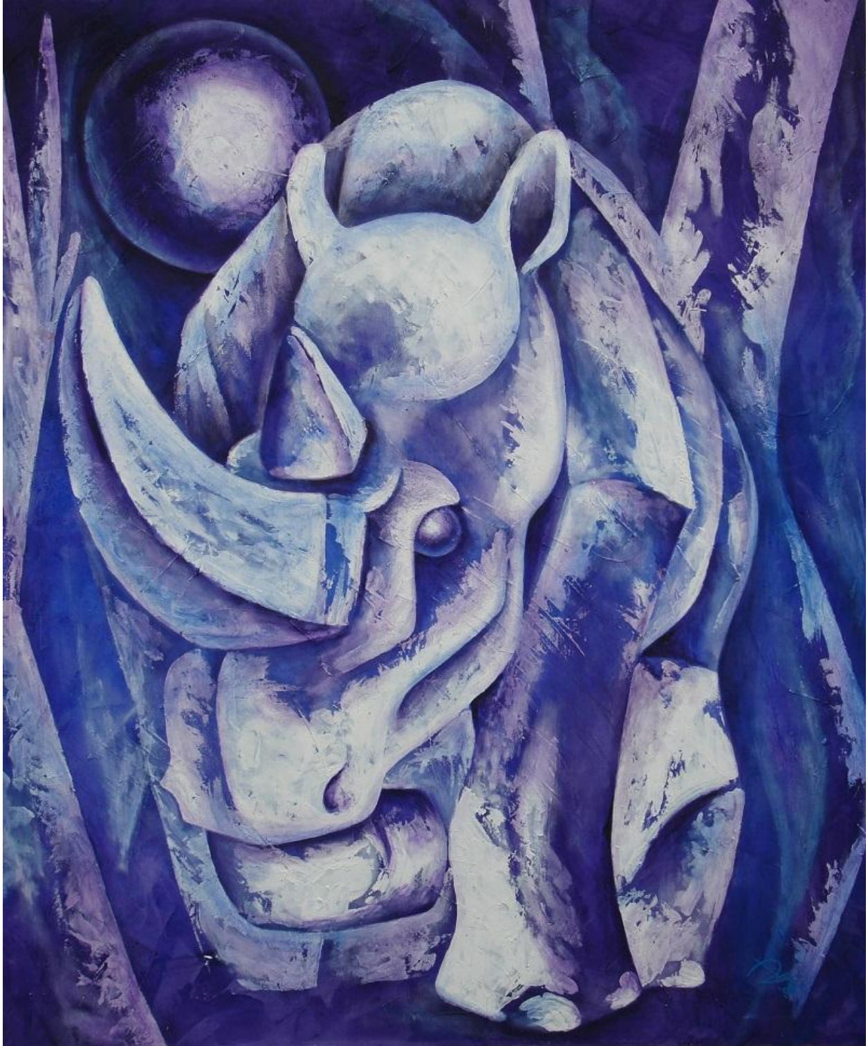
"Rinoceronte / Rhino ", acrílico sobre lienzo / acrylic on canvas , 2008