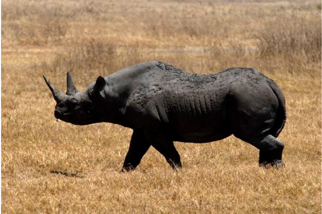
Rinoceronte negro occidental / Western Black Rhinoceros (Diceros bicornis longipes)

A fines del año pasado (hace apenas 4 meses) se declaró oficialmente la extinción del Rinoceronte negro occidental por parte de la Asociación Internacional para la Conservación de la Naturaleza. Se trata de una variedad del rinoceronte negro que habitaba áreas de Camerún donde fue depredado hasta su desaparición principalmente por cazadores furtivos, para arrancarle el cuerno. Otra magnífica muestra de estupidez humana que, como la corrupción de los políticos y la avaricia de los banqueros, carece de límites.