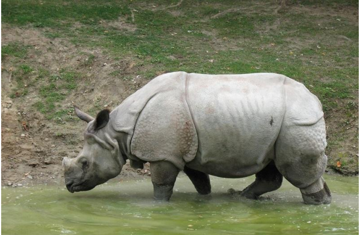
Rinoceronte de Java ( Rhinoceros sondaicus sondaicus )

Según la organización ecologista WWF , las muestras genéticas recogidas en el Parque Nacional de Cat Tien, en Vietnam, confirman que el rinoceronte de Java fallecido en 2010 era el último ejemplar de esta especie en el país asiático. El animal murió a manos de cazadores furtivos que arrancaron su cuerno para traficar en el mercado negro, ya que se trata de uno de los productos más usados en la medicina tradicional china.