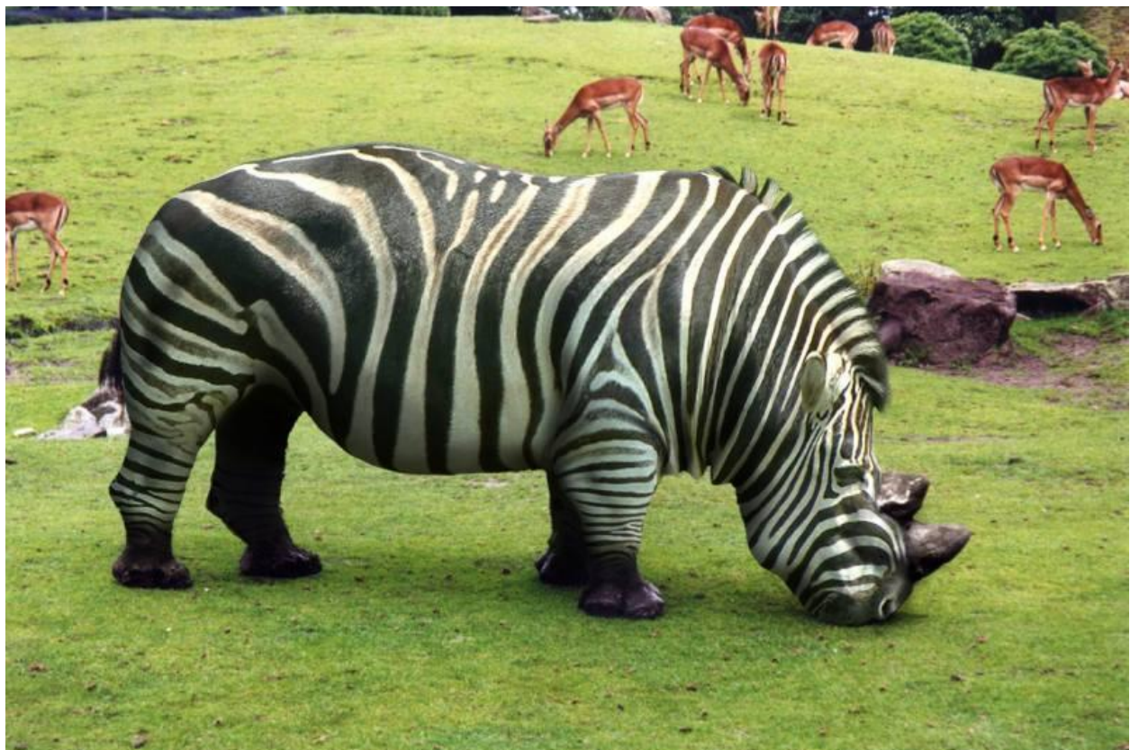
"Cebraceronte" (¿o tal vez "Rinocebronte"?) / Zebraceros (or maybe Rhinozebra?)

Una simpática fotomanipulación. Aquí se puede ver cómo crear este híbrido. Hay unos cuantos por el estilo; parece que cruzar rhinos con cebras es una práctica con muchos adeptos.