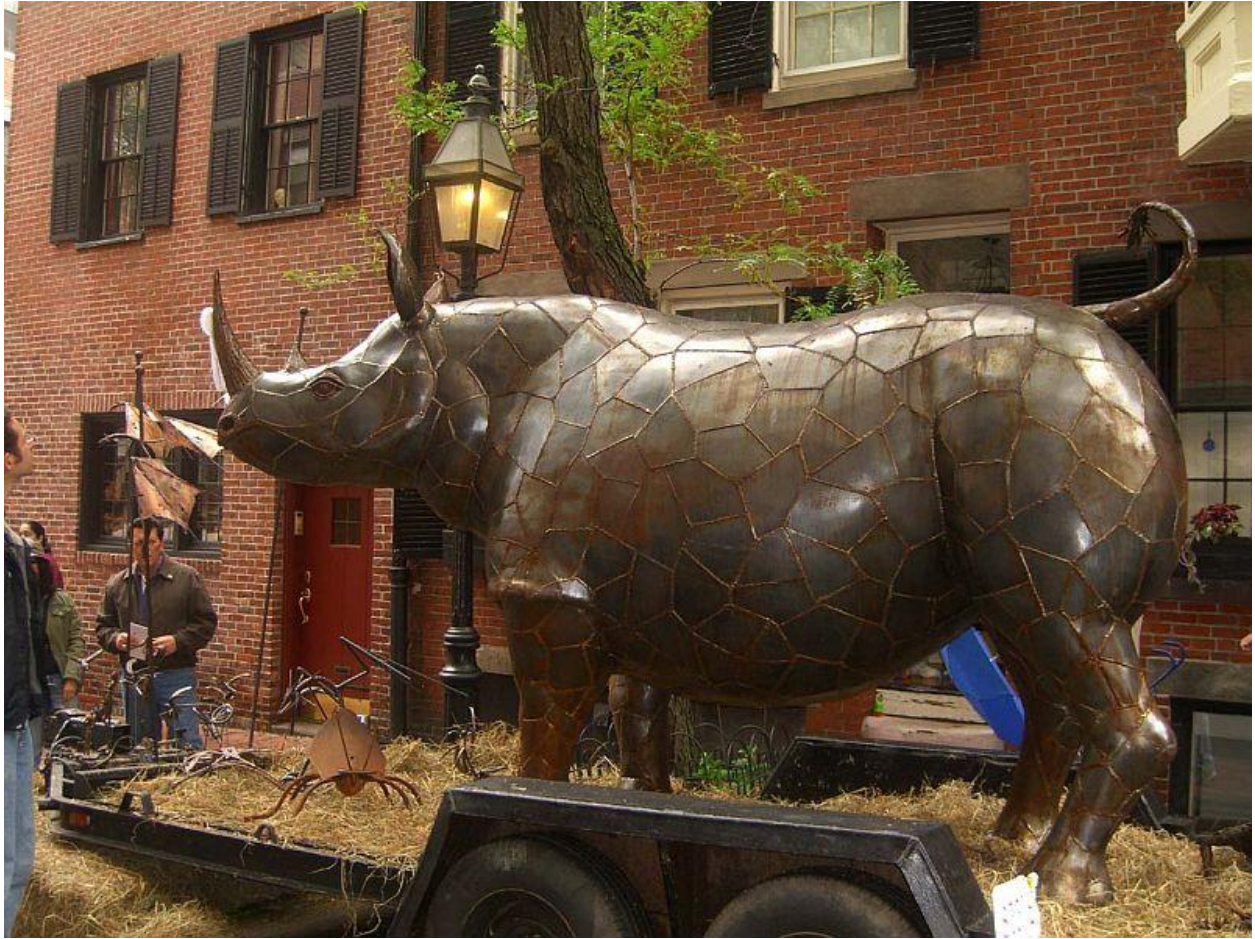
"Rinoceronte / Rhinoceros ", 2011