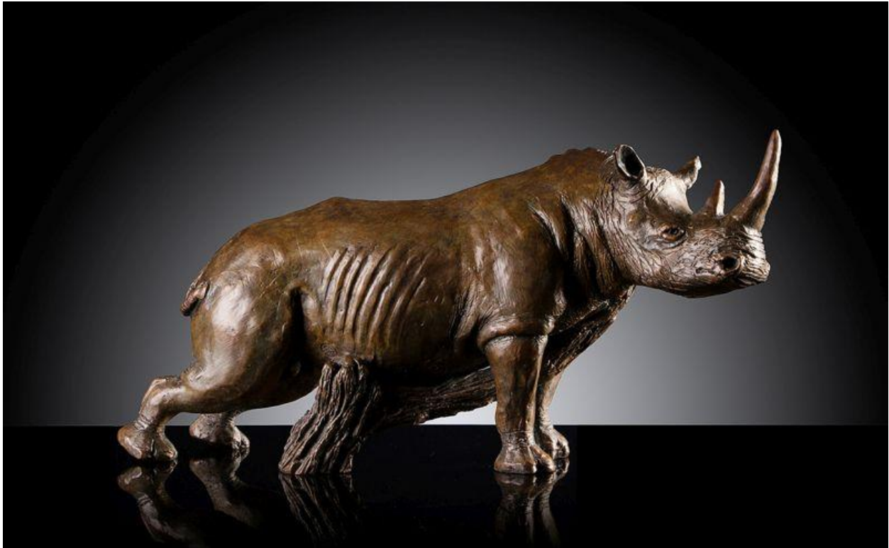
"Rinoceronte rascándose contra un tronco / Rhino Rubbing Post", bronce / bronze, 32 x 11 x 16 cm.

It is not strange that many of the sculptors who have some rhinoceros to his credit are South Africans, as Donald Greig . Anyone who has seen some of his bronzes, knows that Donald is passionate about animals he sculpts. In fact, he spends countless hours in the forest studying, photographing and filming, to really understand the movements, habits ... their true nature. "Because the sculpture is three-dimensional," he says "you must know the structure of the animal body, their bones and how their muscles are formed, and how it looks from different angles." Besides the lifesize white rhino, here you have also a couple more, medium and large size.