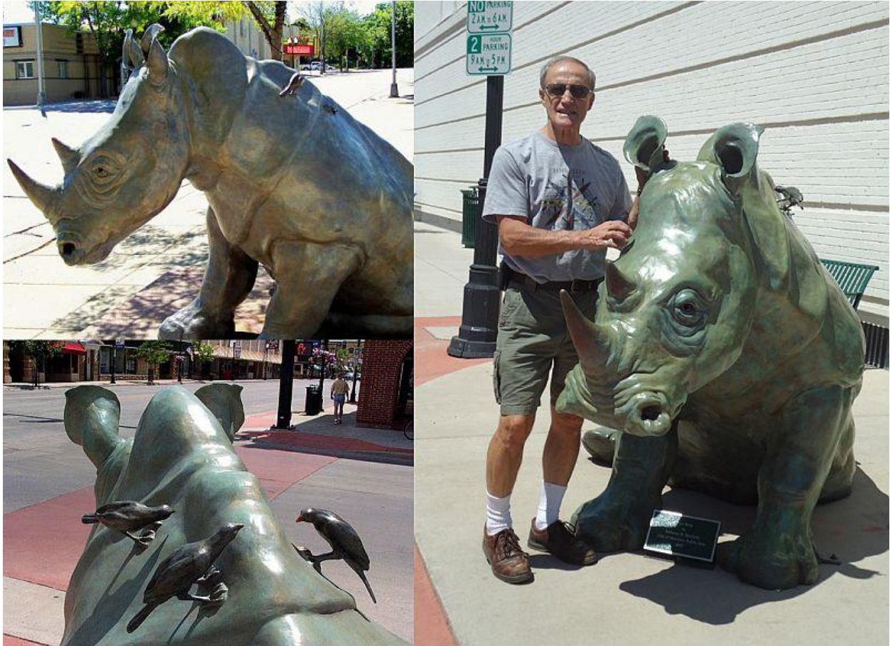
"El jefe / The Boss ", borncce / bronze, 2007

Dolores Bryson Shelledy es una escultora estadounidense que realiza animales a tamaño natural. Fue docente en el Hogle Zoo de Salt Lake City, donde aprendió de los animales que luego, cuando se dedicó a la escultura, serían su motivo de trabajo. Éste es un rinoceronte blanco. Desconozco quién es el veterano, pero sirve para darse una idea del tamaño. Interesante también el detalle de los bufagos, los pájaros que se alimentan de los parásitos de la piel de éstos grandes hervíboros.