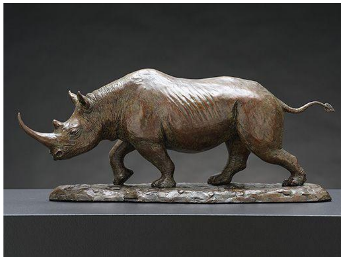
"Rinoceronte negro / Black Rhino ", bronce / bronze