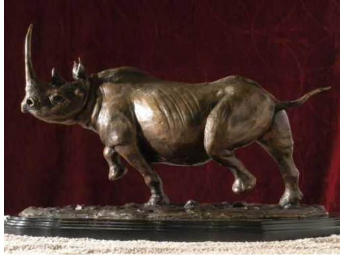
"Carga de un rinoceronte negro / Black Rhino Charge ", bronce / bronze, 28 x 47 x 19 cm.