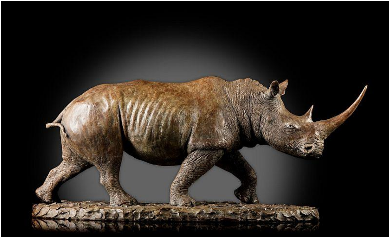
"Rinoceronte negro / Black Rhino ", bronce / bronze , 45 x 16 x 20 cm.

Además del rinoceronte blanco a tamaño natural, dejó también otros de tamaño medio de un rinoceronte negro.