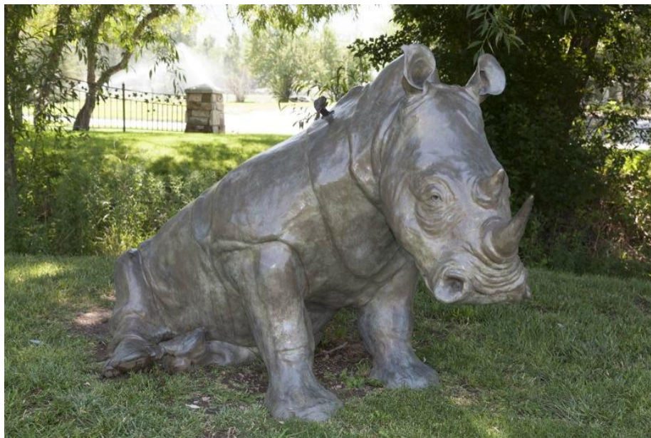
"El jefe / The Boss", borncce / bronze, 2007

Dolores Shelledy Bryson is an American sculptor who makes life-size animals. He taught at the Hogle Zoo in Salt Lake City, where he learned of the animals. Then when she dedicated to sculpture they become the main theme. This is a white rhino. I do not know who is the guy, but it serves to get an idea of the size. Interesting also the detail of the buphagus, birds that eat the skin parasites of these large herbivores.