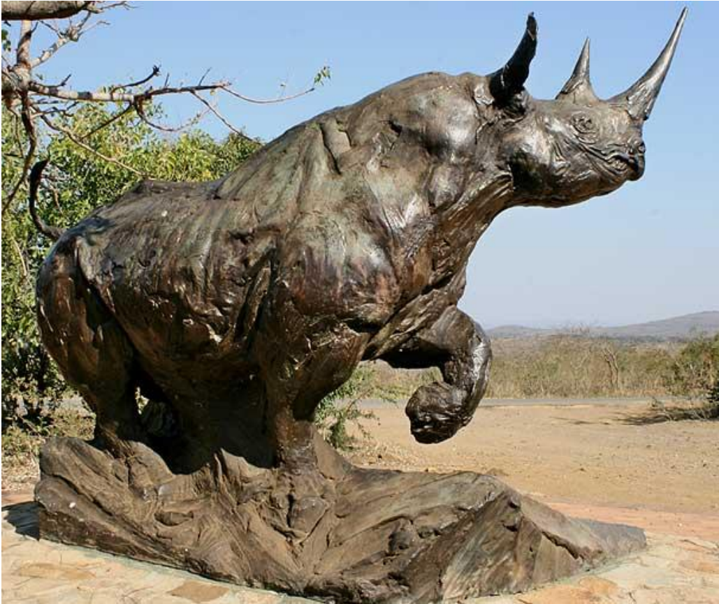
"Rinoceronte del centenario / Centenary Rhino ", bronce, tamaño natural / bronze, lifesize

Al escultor sudafricano Dylan Lewis le encomendaron la creación de ésta escultura de bronce de un rinoceronte negro ( Diceros bicornis ), para colocar a la entrada del Centenary Game Capture Centre, Hluhluwe-Imfolozi Game Reserve, en la provincia de KwaZulu-Natal. El encargo se hizo a mediados de los '90 para conmemorar los 100 años de conservación en la provincia. Hluhluwe-Imfolozi es reconocido por su "Operación Rhino" que ayudó a salvar el rinoceronte blanco de la extinción en el s. XX, cuando quedaban menos de 50 ejemplares. Desde el inicio de la operación, en los '60, más de 10.000 rinocerontes blancos han sido recolocados alrededor del mundo. En 2007 una versión idéntica de ésta escultura fue subastada en Londres por Christie's, y un comprador anónimo pagó 356.000 dólares.