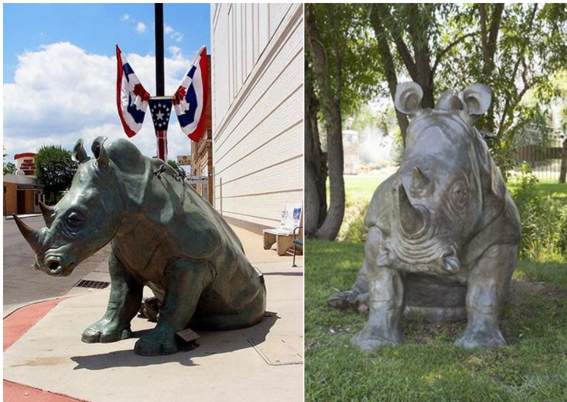
"El jefe / The Boss", borncce / bronze, 2007

Dolores Shelledy Bryson is an American sculptor who makes life-size animals. He taught at the Hogle Zoo in Salt Lake City, where he learned of the animals. Then when she dedicated to sculpture they become the main theme. This is a white rhino. I do not know who is the guy, but it serves to get an idea of the size. Interesting also the detail of the buphagus, birds that eat the skin parasites of these large herbivores.