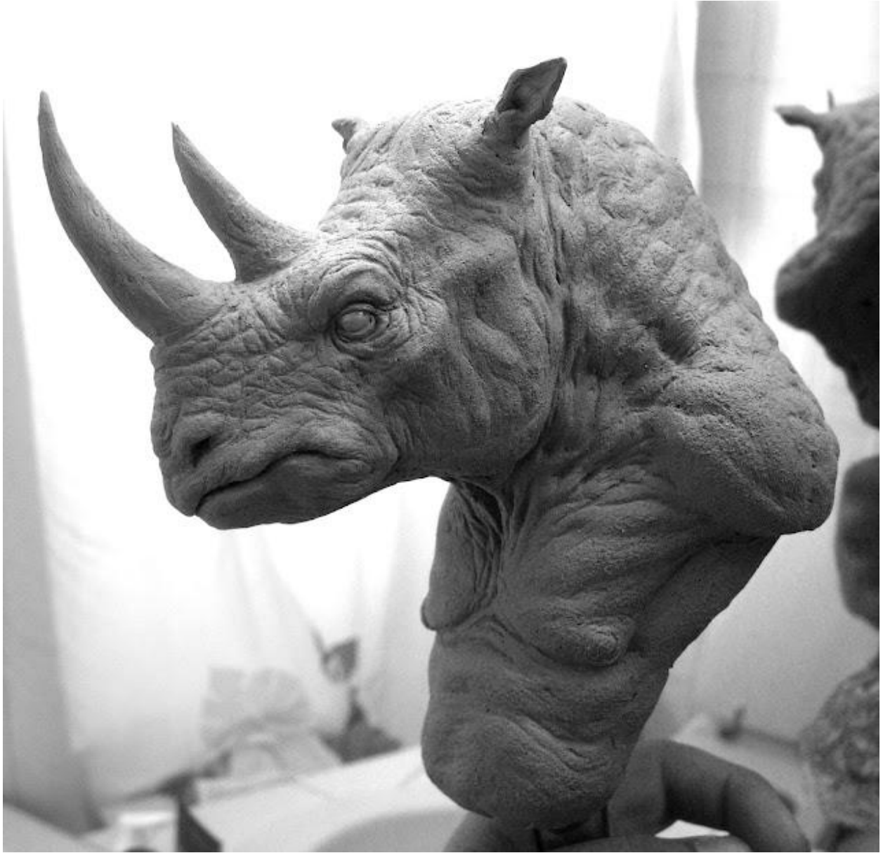
"Hombre rinoceronte / Rhino man "