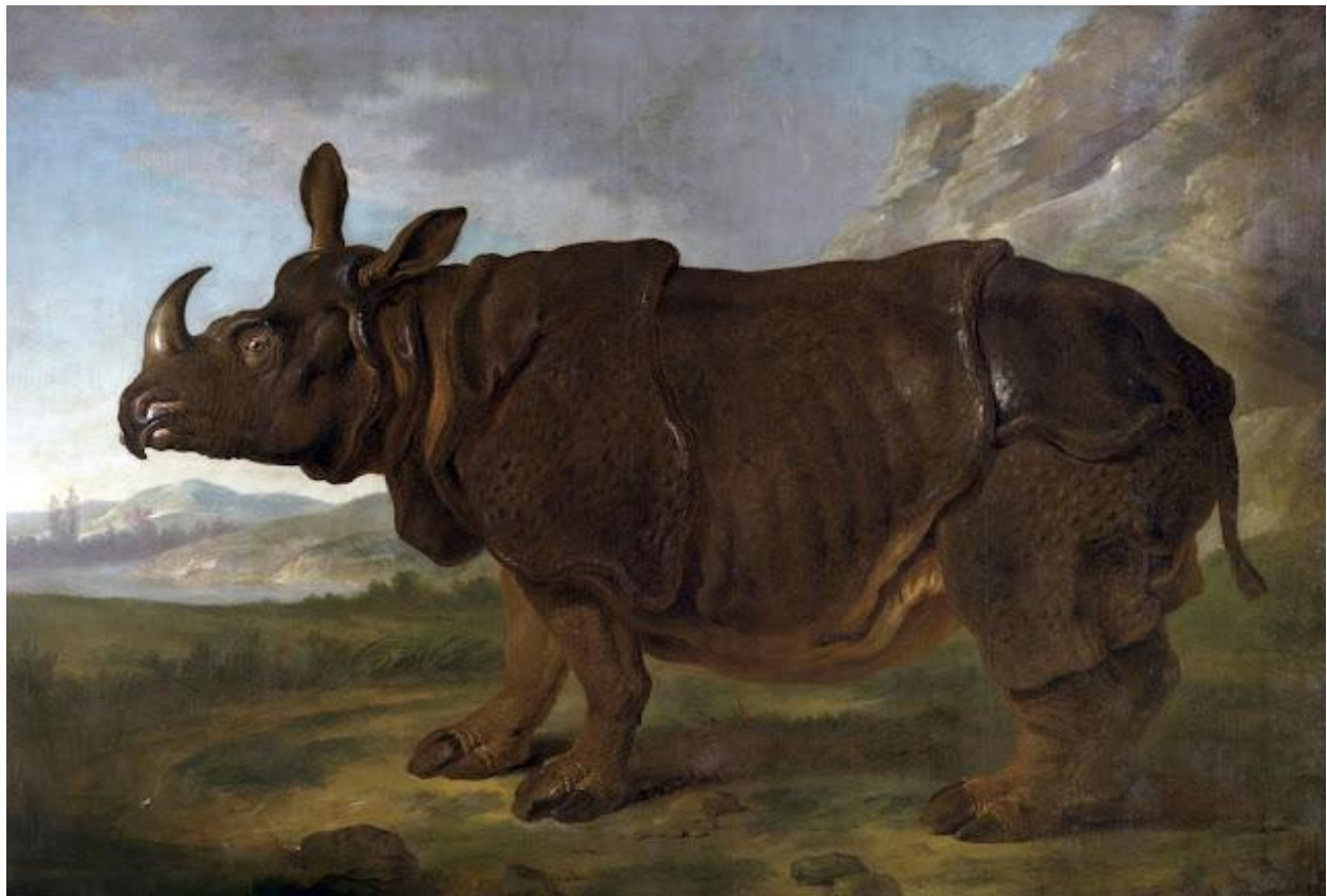
"El Rinoceronte Clara en París / Clara, the Rhino in Paris " en 1749

El rinoceronte Clara (1738-14 de abril de 1758) fue un rinoceronte indio hembra de mediados del siglo XVIII. Llegó a Europa por Róterdam en 1741, pasando a ser el quinto rinoceronte vivo visto en Europa desde la llegada del Rinoceronte de Durero en 1515. Tras exhibiciones en pueblos de los Países Bajos, Alemania, Suiza, Polonia, Francia, Italia, Bohemia y Dinamarca, murió finalmente en Londres. Hay toda una serie de pinturas, dibujos y grabados de la época, como éste que comparto aquí.