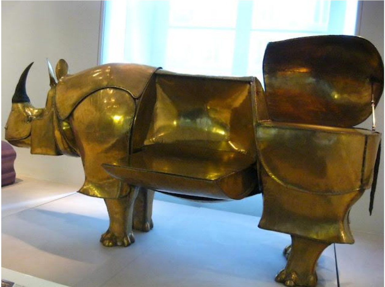
"Escritorio rinoceronte / Rhino desk"

Y... de todo para el hogar: éste "Rhino desk", curioso rinoceronte escritorio diseñado por François-Xavier y Claude Lalanne (Les Lalanne) . Expuesto en el Museo de Artes Decorativas de París. Parece ser que Yves Saint Laurent era uno de los compradores más fieles del trabajo de ésta pareja de escultores. Aquí hay un artículo muy interesante y una serie de fotografías del archivo de la revista LIFE en el que se los ve en acción juntos en su estudio en 1967, así como unos cuantos de sus trabajos surrealistas inspirados en animales.