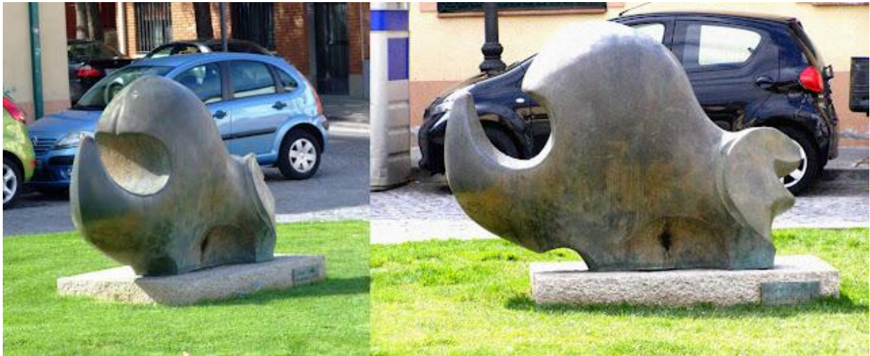
"Rinoceronte", Plaza el Humilladero, Villaviciosa de Odon (Madrid, España / Spain)

Francisco Otero Besteiro , escultor y pintor, nace el 3 de marzo de 1933 en la localidad de Corgo, en la provincia de Lugo (España) y fallece el 24 de mayo de 1994. Personaje peculiar apasionado de la filosofía y gran admirador de las personas dedicadas a la investigación científica y en especial a la medicina. Hombre de gran sensibilidad artística, buscando siempre nuevas formas de expresion, consiguió reunir una obra personal, diversa y sorprendente e incluso realizando inventos para soluciones cotidianas. Una curiosidad; en una encuesta a los vecinos para escoger la más bonita estatua de Villaviciosa, en la opción que da para votar por ésta de Besteiro dice: "Rinoceronte/ardilla/lo que sea" :)