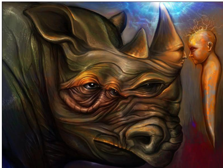
"Conversación con el rinoceronte" / Conversation with Rhino

Obra de un artista digital australiano identificado en deviantArt como "inventivdreams", que tiene unas cuantas cosas interesantes. Según dice "creado con photoshop, es un concepto de