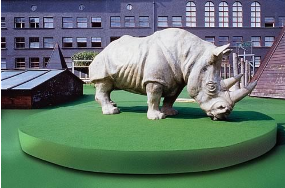
Rinoceronte en el Centro de Arte Contemporáneo / Rhino in the Contemporary Art Center , (Linz, Austria).