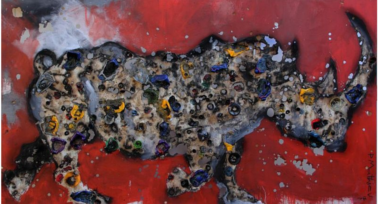
"Quemado para estar vivo / Burnt to be Alive ", 163 x 283 cm., 2012