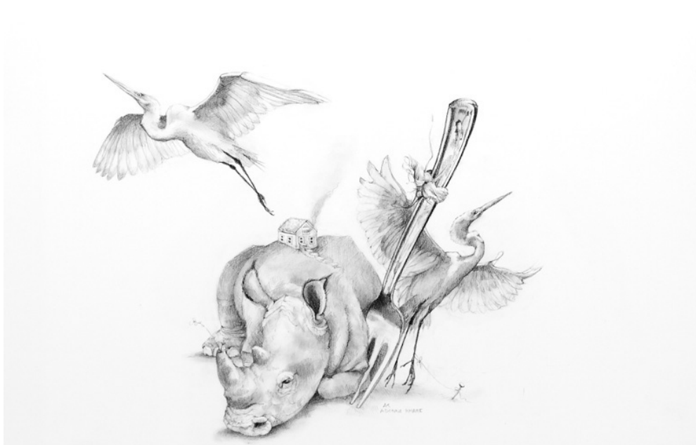
"Rinoceronte con tenedor / Rhino with Fork "

Lápiz de carboncillo sobre papel / carbon pencil on paper , 11" x 14", 2013 © Adonna Khare