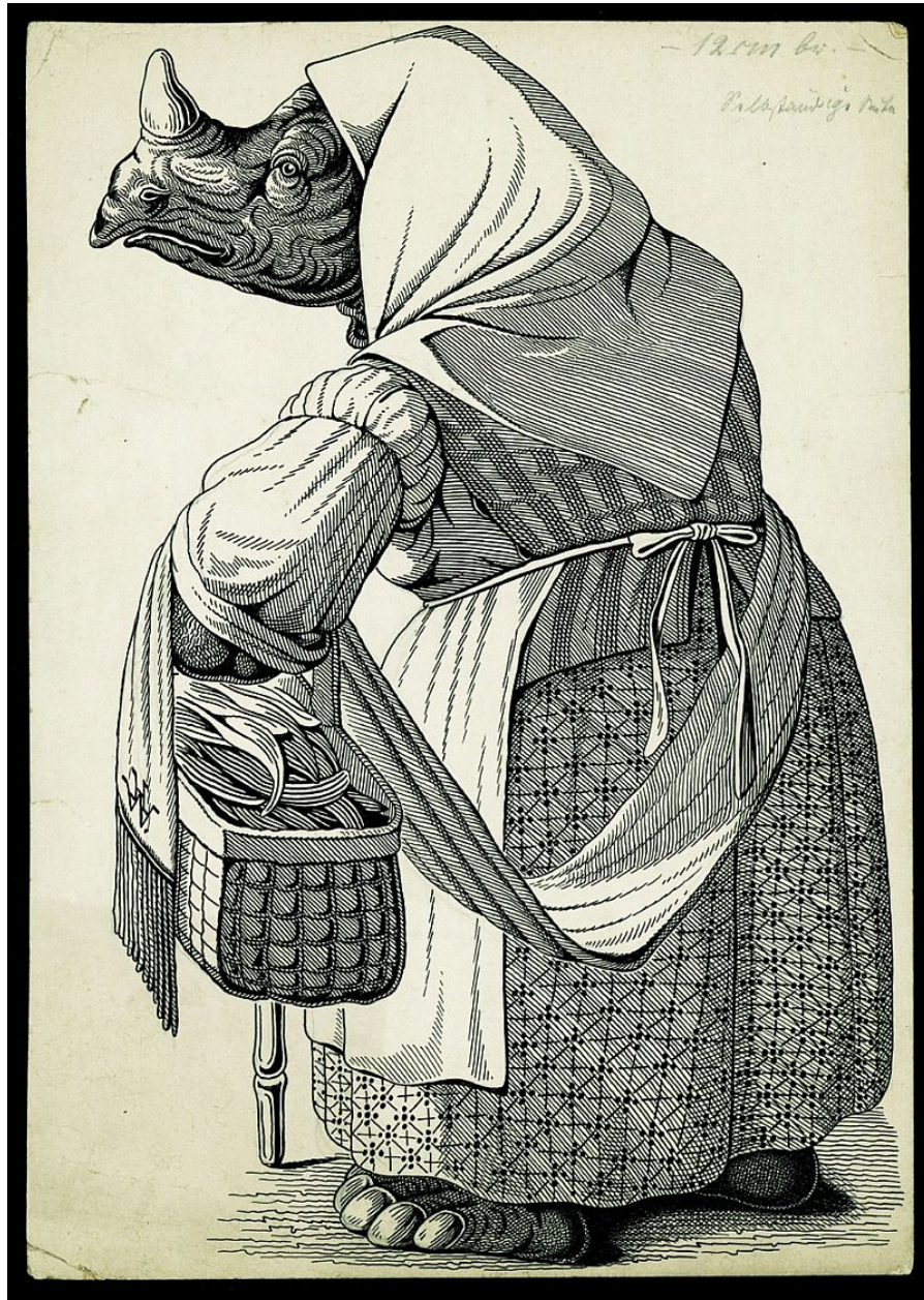
"Dama rinoceronte / Rhino Lady "

No hay prácticamente ninguna información sobre Eduard Wolf-Harnier, uno de los muchos destacados ilustradores alemanes activos alrededor de 1900. Como muchos de ellos, ha sido completamente olvidado. Vivió en Berlín y se desempeñó como profesor y artista amateur autodidacta. Ilustró algunos libros infantiles, pero esta "Dama Rinoceronte" parece no haber sido publicado. Fue realizado sobre 1905-1915. Información tomada de aquí .