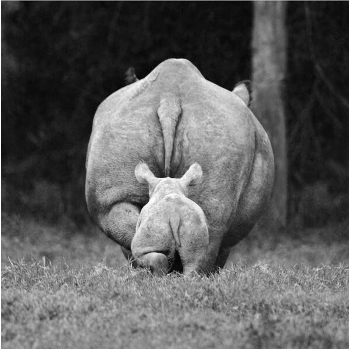
Solio Game Ranch, Mweiga, Kenya, 2008