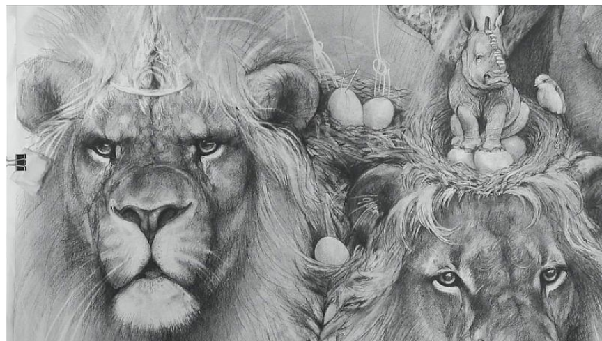
Obra en proceso / Work in progress