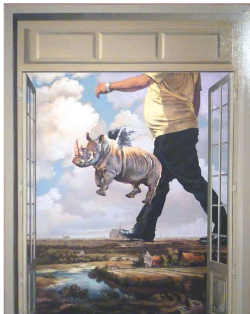
"Gulliver en la tierra de los rinovoladores / Gulliver in the Land of Rhinoflyers" Acrílico sobre lienzo / acrylic on canvas, 120 x 95 cm., 2012. Colección privada / Private Collection, Montevideo, Uruguay.

Pending a third post reviewing the work of Pedro Peralta, here you have a couple of rhinos of his show at the MNAV, Montevideo. I recommend a visit to the previous posts for more pictures and information.