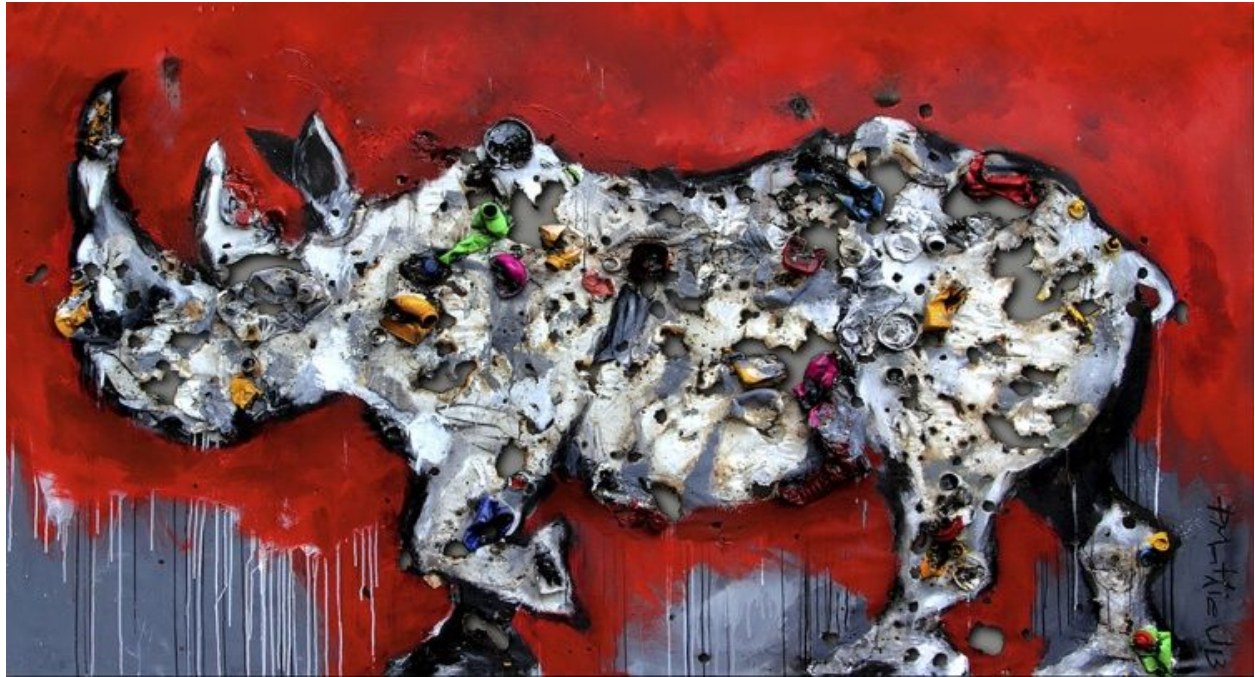
"Peligro / Danger", Acrílico y plásticos derretidos sobre lienzo quemado / acrylic and melted plastics on burnt canvas, 142 x 264 cm., 2013

His original references are to be found in the after war currents of the Experimental Painting that drove the work of the "COBRA" movement at the end of the 40s in northern Europe, and more particularly the work of Asger Jorn. Later on, artists such as Rauschenberg, De Kooning, Cy Twombly, Baselitz, Basquiat and comic books artist Enki Bilal also were definite influences to his more recent work.