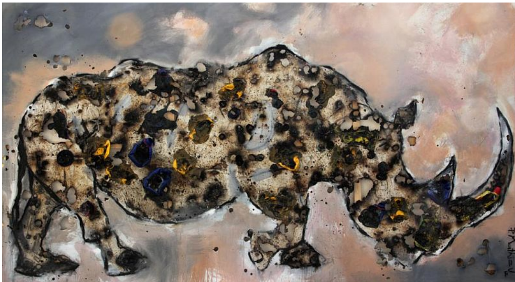
"Estado de la Nación / State of the nation" Técnica mixta sobre lienzo / mixed media on canvas, 62 x 113 inches, 2012