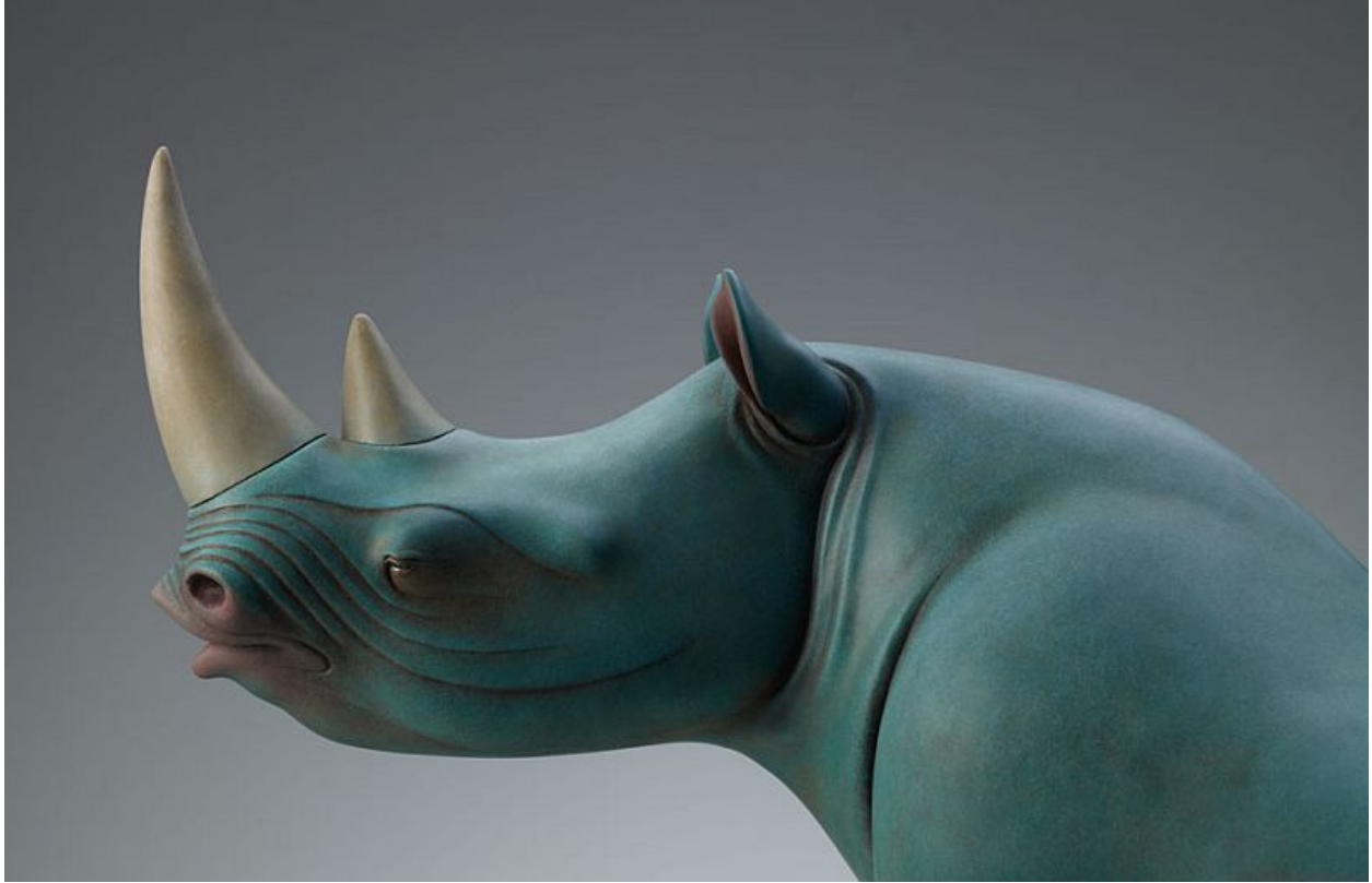
"逐梦记-犀 / Sueños - Rinoceronte / Dreams - Rhino " (detalle / detail)