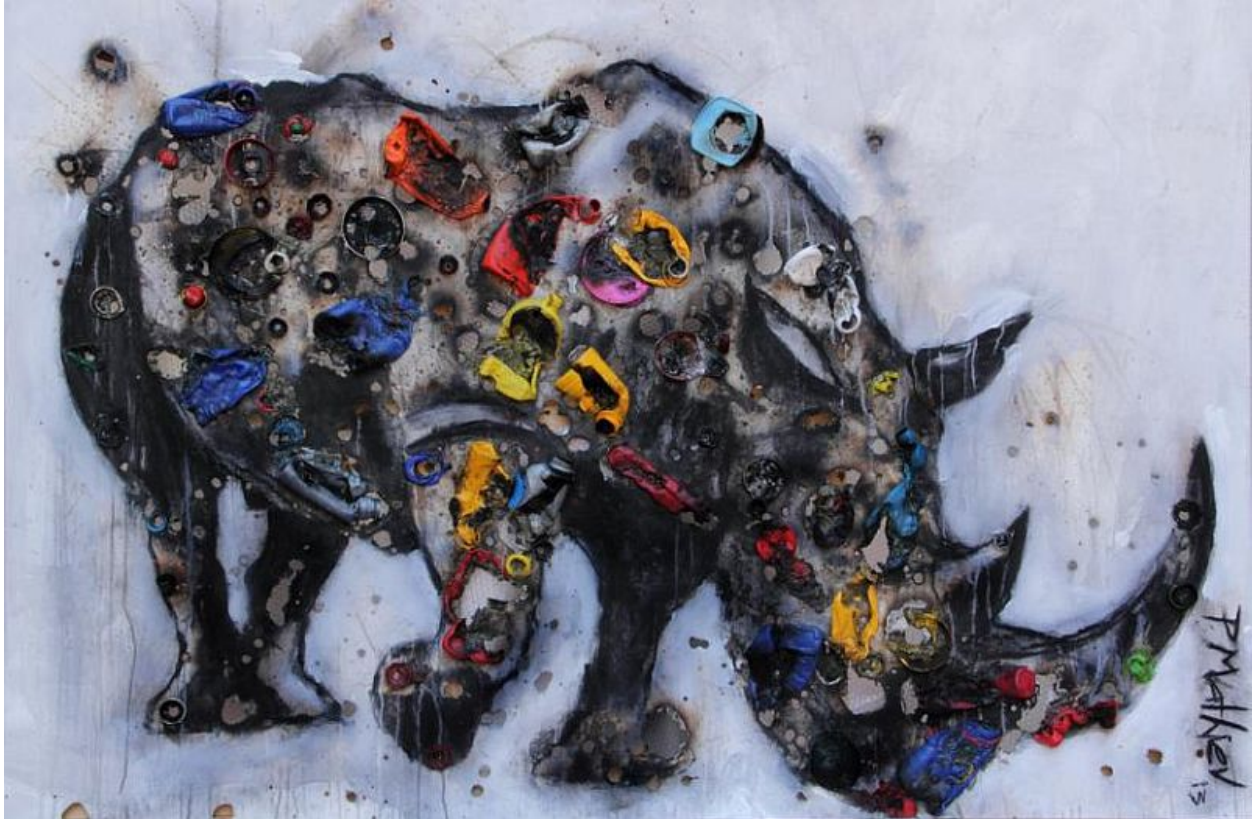
"Luchador / Fighter"

Acrílico y plásticos derretidos sobre lienzo quemado / acrylic and melted plastics on burnt canvas