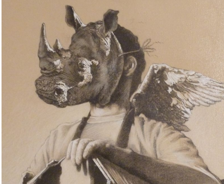
"Te conozco mascarita / I know you" (detalle / detail)

Pending a third post reviewing the work of Pedro Peralta, here you have a couple of rhinos of his show at the MNAV, Montevideo. I recommend a visit to the previous posts for more pictures and information.