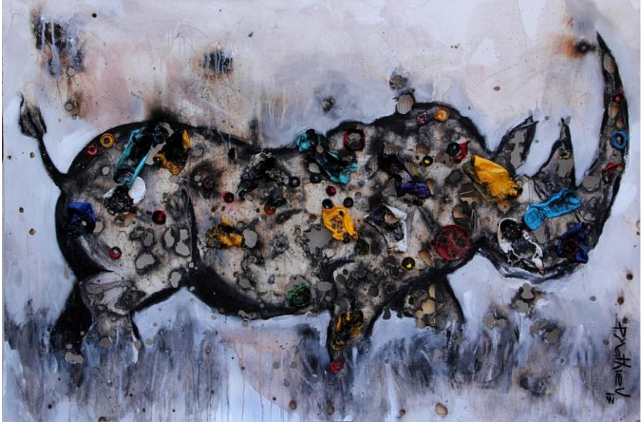
"Rinoceronte caminando / Walking Rhino "

Acrílico y plásticos derretidos sobre lienzo quemado / acrylic and melted plastics on burnt canvas