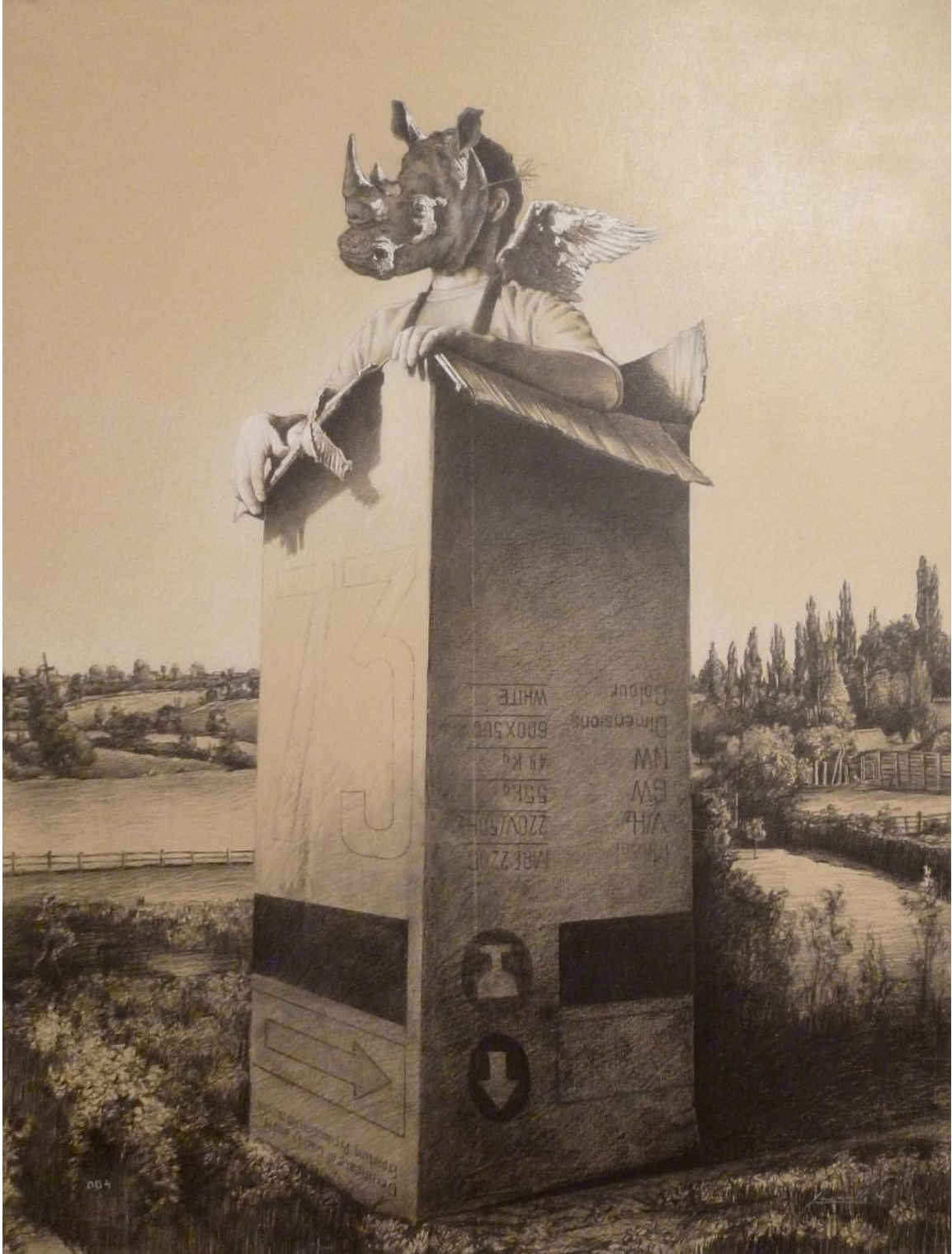
"Te conozco mascarita / I know you "

Dibujo sobre lienzo / drawing on canvas , 115 x 89 cm., 2014.