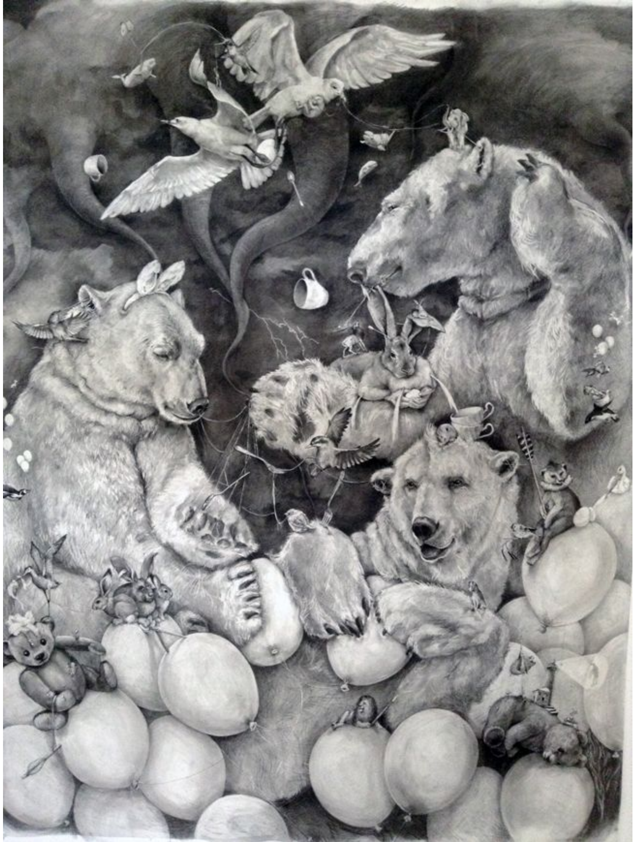
"Osos polares / Polar Bears " © Adonna Khare