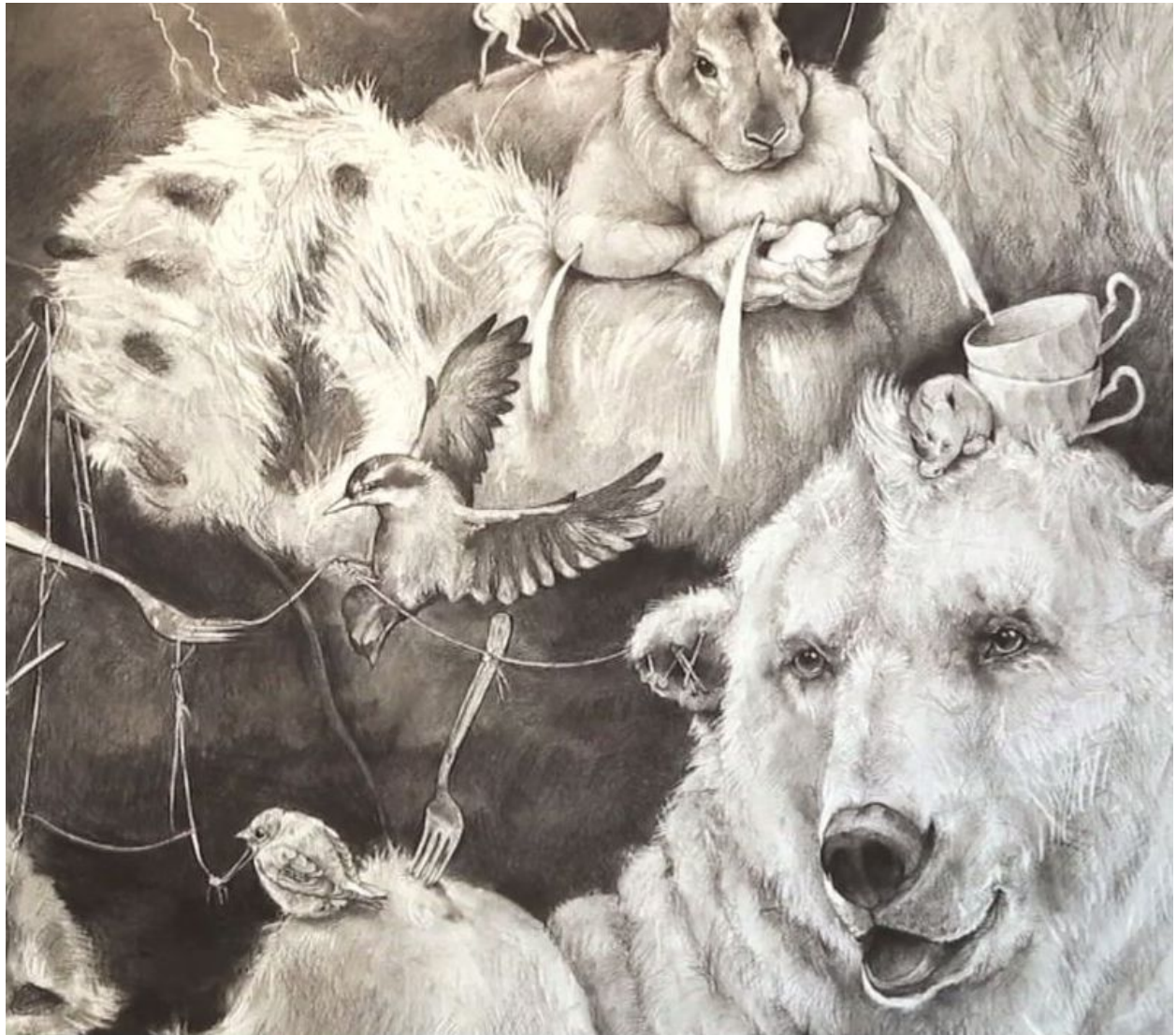
"Osos polares / Polar Bears" (detalle / detail) © Adonna Khare

Adonna Khare en "El Hurgador" / in this blog: