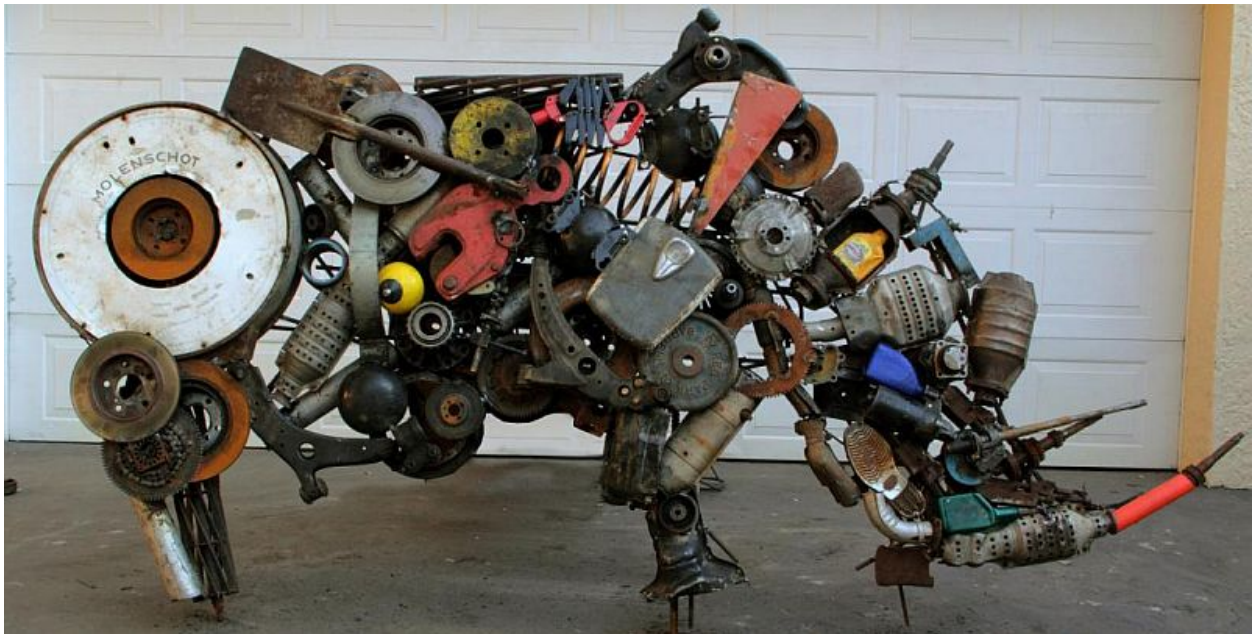
"Rinoceronte de basura / Scrap Rhino " Escultura de metal y objetos plásticos / metal sculpture and plastic objects , 64" x 125", 2012