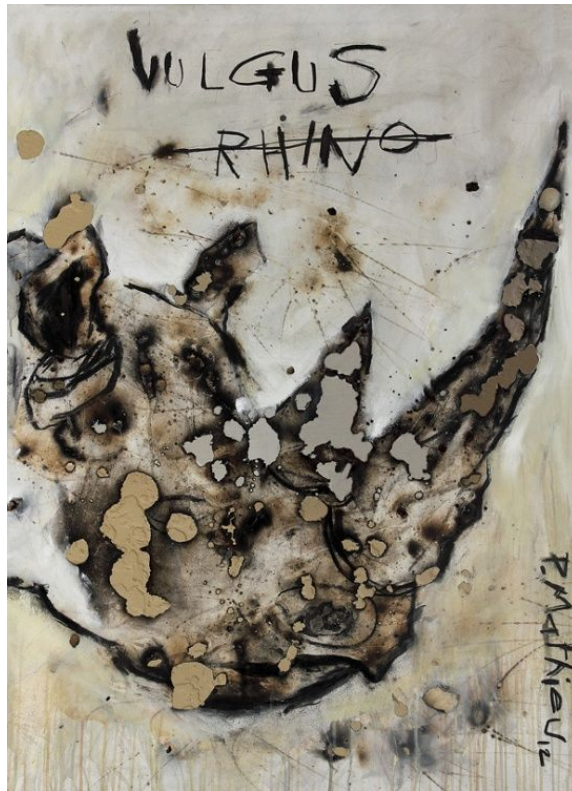
"Vulgus Rhino", acrílico sobre lienzo quemado / acrylic on burnt canvas , 130 x 97 cm., 2013