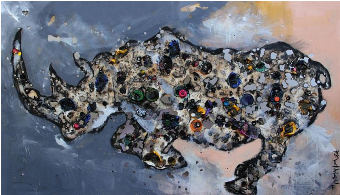
"Esfumarse / Vanish"

Técnica mixta sobre lienzo / mixed media on canvas , 62 x 113 inches, 2012