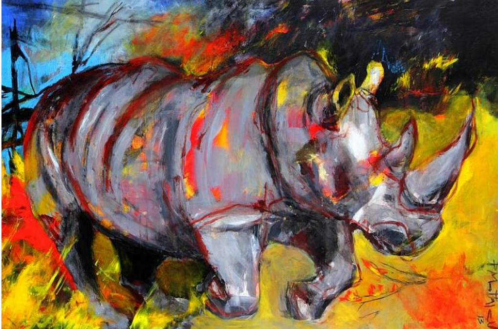
"Huída del bosque / Bush Escape ", acrílico sobre lienzo / acrylic on canvas , 130 x 195 cm., 2013