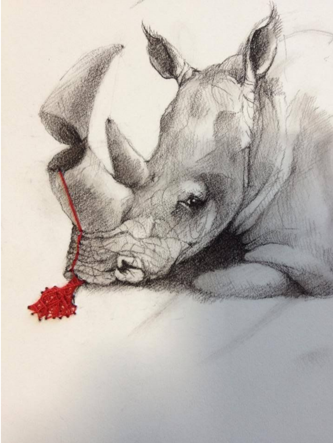
Pequeño dibujo de un rinoceronte. Es una pena que los estemos perdiendo / Small drawing of a Rhino. Sad that we're losing them © Adonna Khare