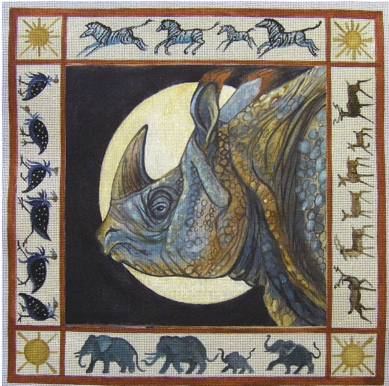
"Rinoceronte indio con borde decorativo / Indian Rhino Decorative Border " Acrílico sobre lienzo / acrylic on canvas, 17" x 17"

Más sobre Anne en / More about Anne in: Blog, deviantART