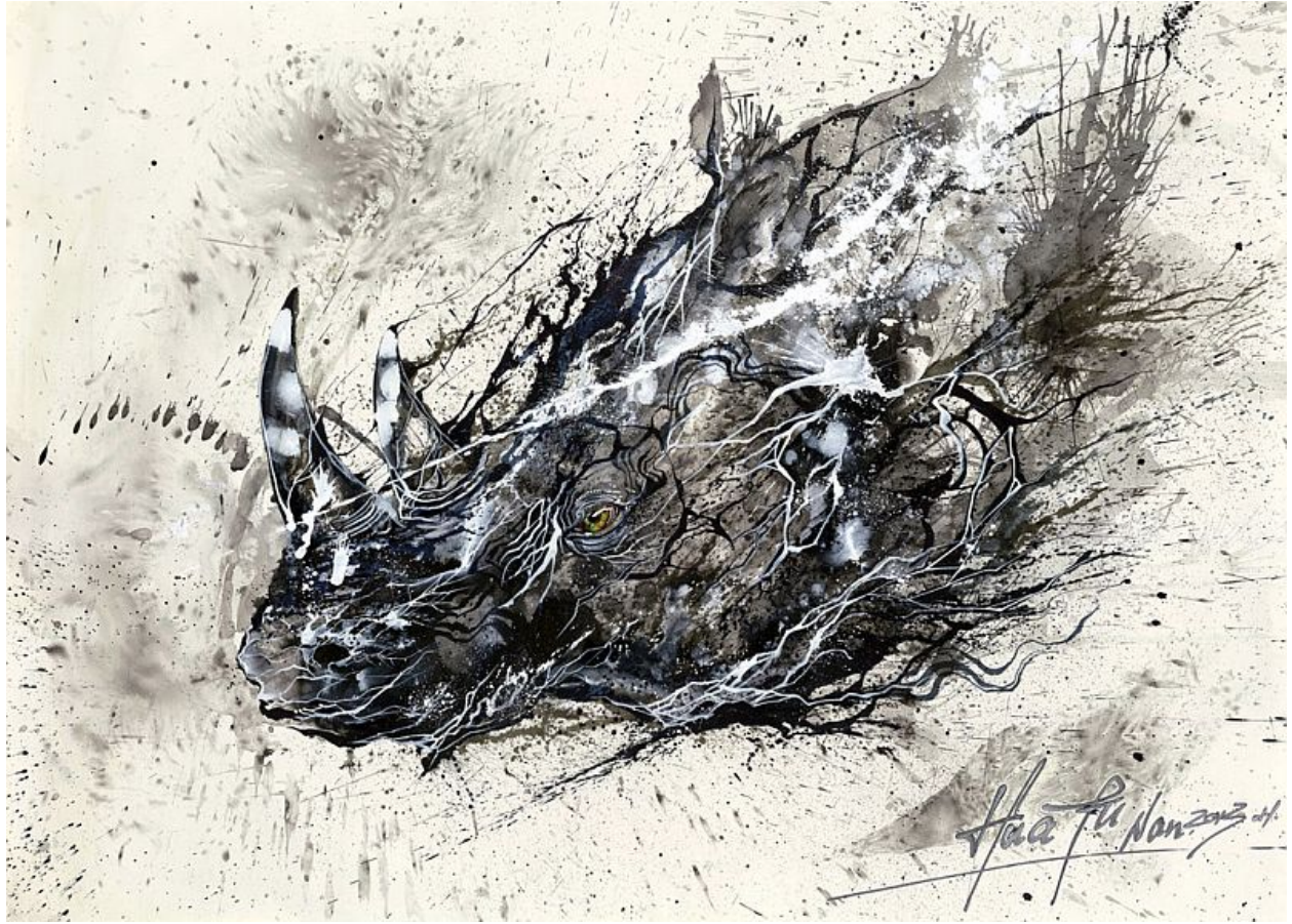
"Rinoceronte Jedi / Jedi Rhino", tinta sobre papel / ink on paper, 79 x 110 cm.

Hua Tunan (画图男) es un pintor y artista del graffiti chino nacido en 1991 en Foshan, Guangdong.