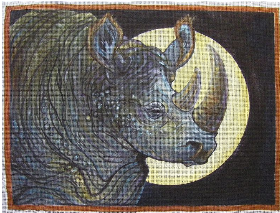
"Rinoceronte bicorne en acrílico / 2 Horned Rhino in Acrylic "

Copyright: Chabrier HouseofChabrier Anne E. Shoemaker-Magdalenno 2010