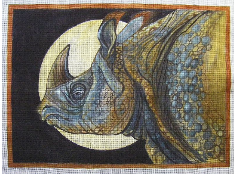
"Rinoceronte indio a la luz de la luna / Indian Rhino Moonlight "

Acrílico sobre lienzo / acrylic on canvas, 24" x 26"