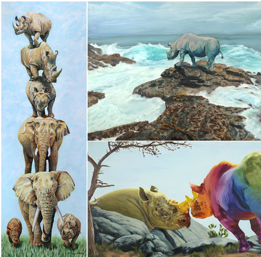
Izq./ Left: "Torre de poder / Tower of Power ", óleo sobre lienzo / oil on canvas , 12" x 36", 2014

«La serie Rinotopía es sobre la forma, la pintura, la luz y la composición. Sin embargo, también es necesario contar historias, y mi deseo es tenerlo muy en cuenta. En cada pintura, ligo al rinoceronte con lo sagrado. A veces una pintura incluye un mito específico, sutilmente mencionado en la obra. Otras veces busco características de una deidad / arquetipo y eso está retratado en la pintura. No soy una experta en el mundo de las religiones y mitología. Soy una estudiante de todo, y me gusta compartir lo que aprendo. En mis pinturas immortalizo al rinoceronte. En mi vida real (fuera de los lienzos) dono un porcentaje de lo que se me paga por cada pieza de arte relacionado con rinocerontes a la Fundación Internacional del Rinoceronte ( www.rhinos.org ). Además de ser artista, también soy conservacionista.»