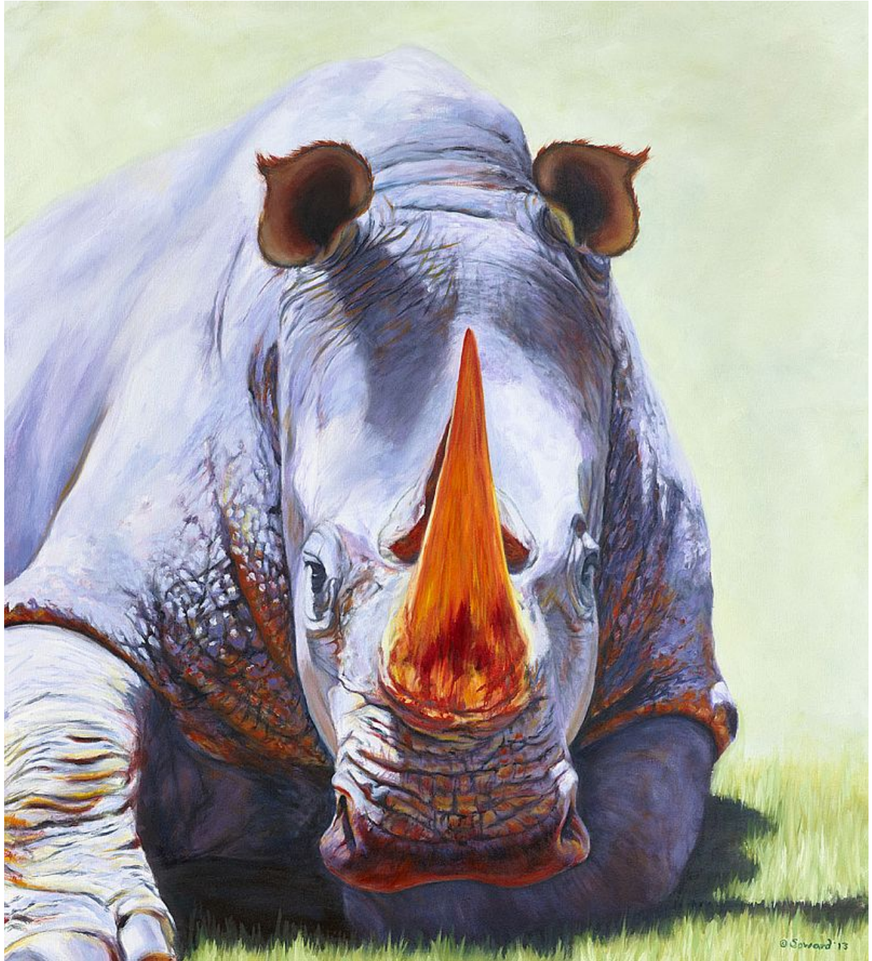
"Espectro completo / Full Spectrum ", óleo sobre lienzo / oil on canvas , 36" x 40", 2013 © Sarah Soward