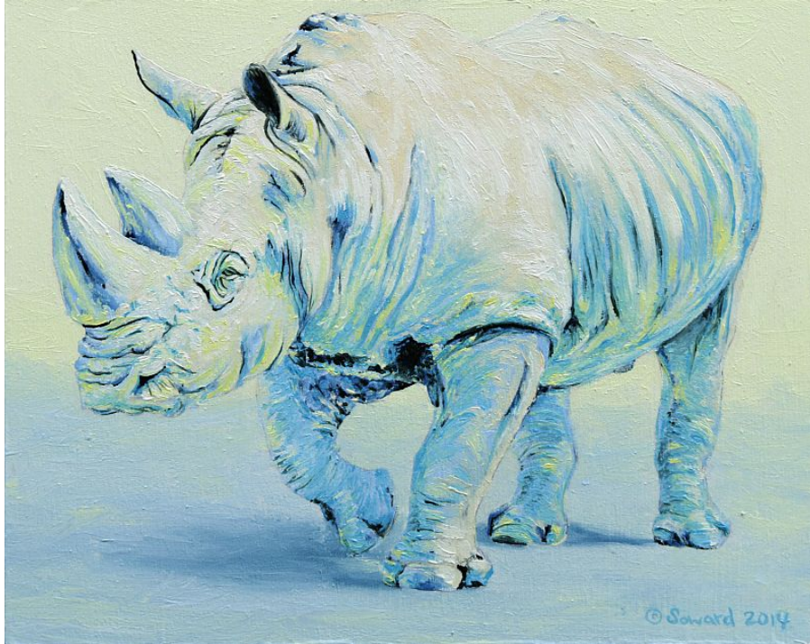
"George Rhino", óleo sobre panel / oil on panel , 8" x 10", 2014 © Sarah Soward