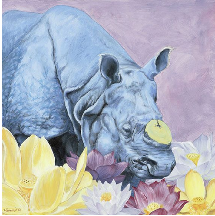
"Colmillo / Tusk", óleo sobre lienzo / oil on canvas, 24" x 24", 2012 © Sarah Soward