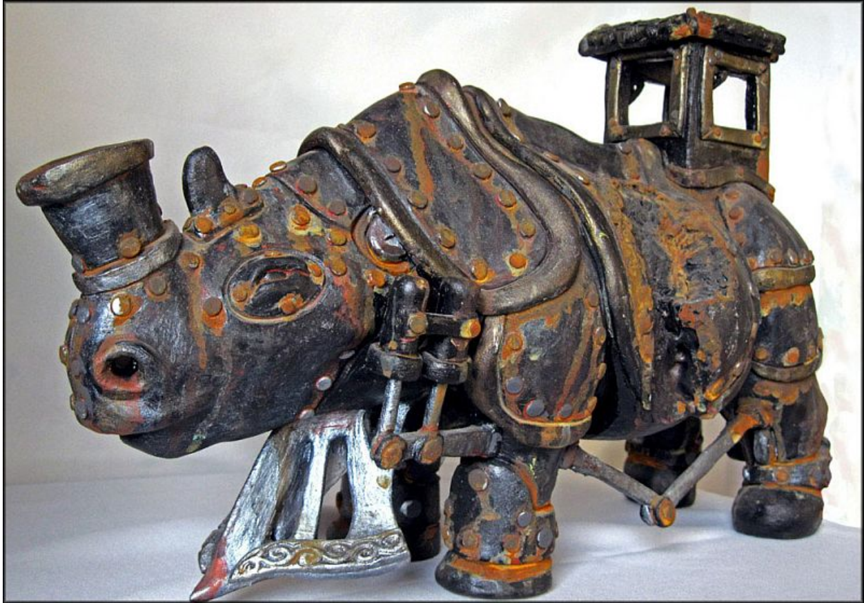
"Rino-Locomotora a vapor / Steam Powered Rhino Locomotive"

Arcilla, tinta india, pintura acrílica y herrumbre / clay, india ink, acrylic paint & rust medium