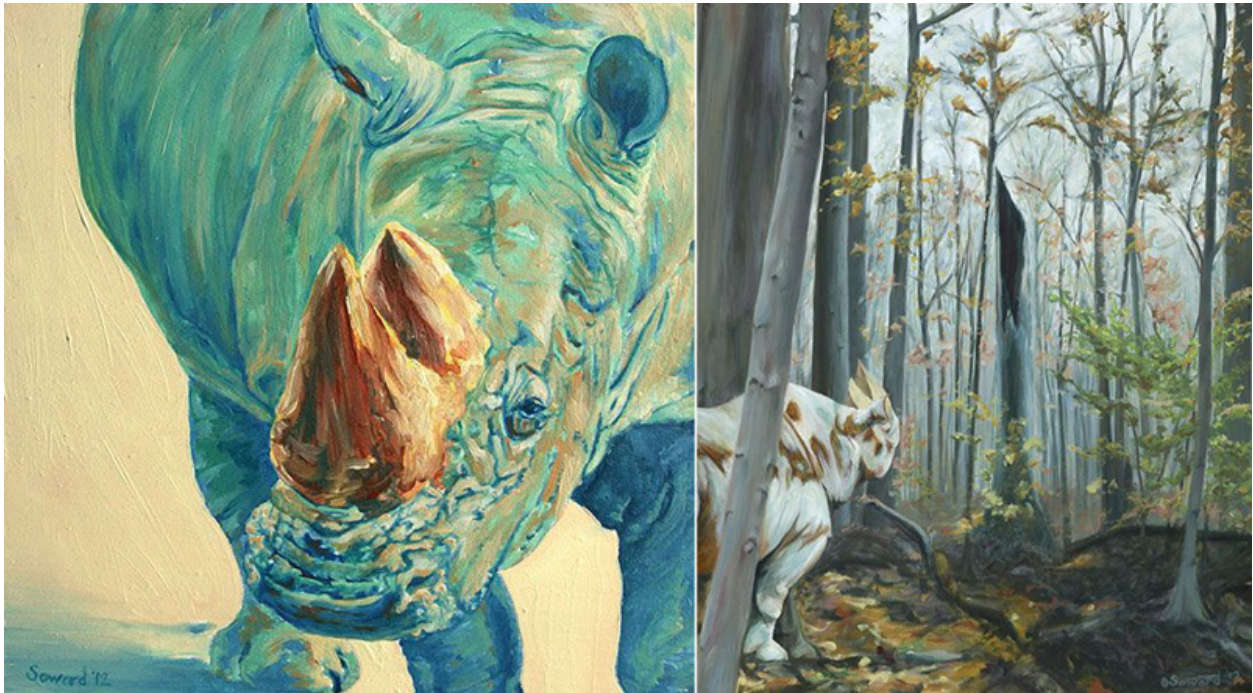
Izq./ Left: "En la luz, Otto / Into the Light, Otto", óleo sobre panel / oil on panel, 6" x 6", 2012