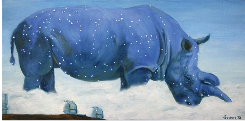
"Noche estrellada / Starry Starry Night ", óleo sobre lienzo / oil on canvas, 8" x 16", 2012 © Sarah Soward

«I've been painting rhinos off and on and in fits and starts since 1999. I am obsessed with them: Their shapes and negative spaces, their wrinkles and horns, the hairy ones, the armored ones, the stoic ones rolling in mud. The first paintings were made because a friend needed a wedding present. In my process of research and study, I fell in love. Those first paintings were, for the most part, even more surreal and often more abstract than my current series, Rhinotopia. The very first three rhino paintings I made had amorphic backgrounds and were a bit abstract. One of them was even called Marriage. The painting that my friend and her new husband decided on was not that one. They chose a different painting altogether. It was made after a fire in my studio apartment and was very..flame oriented.»