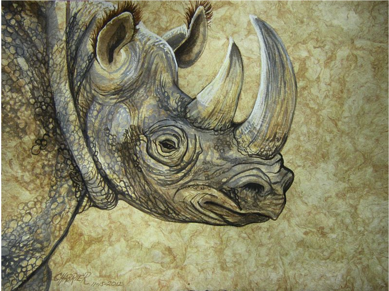
"Rinoceronte dorado / Golden Rhino", acuarela sobre papel de corteza / watercolor on bark paper , 11,5" X 15,5"

Anne E. Shoemaker-Magdaleno es una artista estadounidense que pinta bajo el nombre de Chabrier.