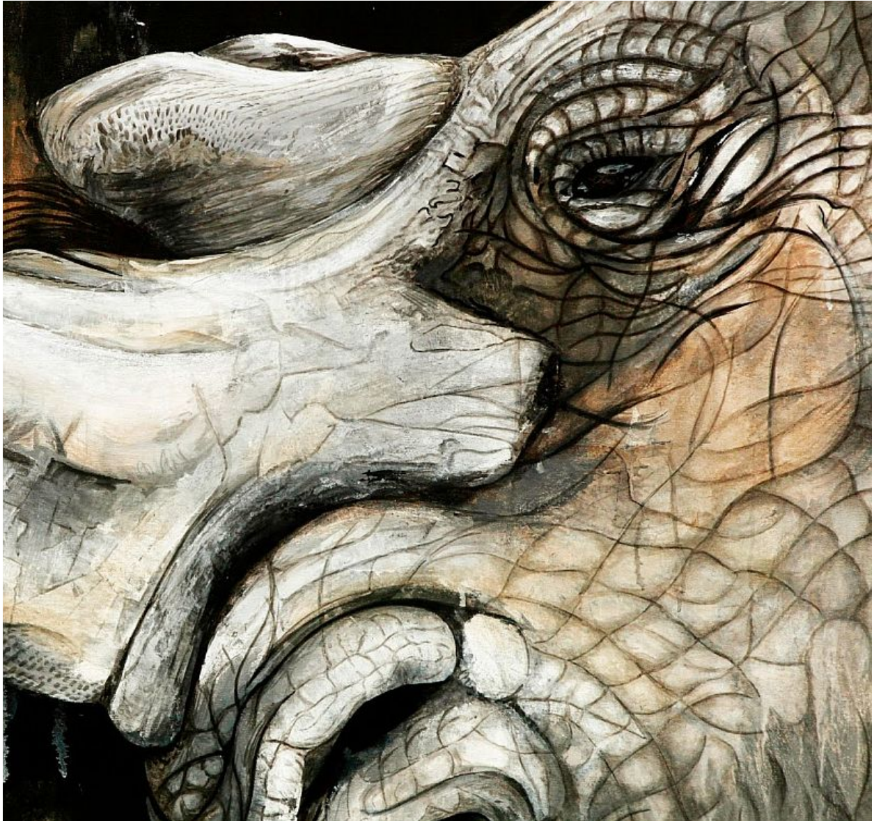
"Rinoceronte / Rhinoceros" (detalle / detail)

Juan José Sabogal is an architect and fine artist born in Colombia in 1985. In 2013 founded Expansive Design, Workshop of arts and techniques. That same year he began his artistic production with a series of works without script with which participates in XI Salon of Artists of Quindio. Subsequently performs "Coffee Landscape" collection that has been selected in the call Regional Figure 8, led by the Central Bank.