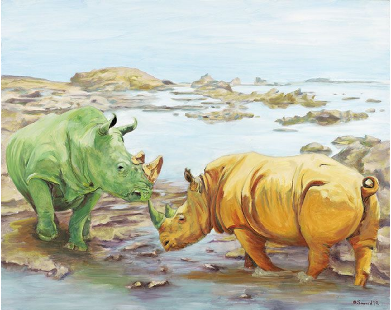
"Familia / Family ", óleo sobre lienzo / oil on canvas , 30" x 24", 2012 © Sarah Soward 2012

Sarah Soward en "El Hurgador" / in this blog : [ Asonancias (XXVII) ]