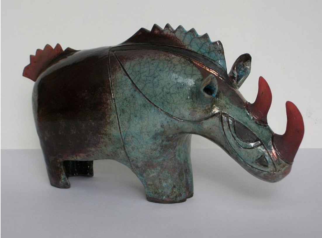
Cerámica / Ceramics