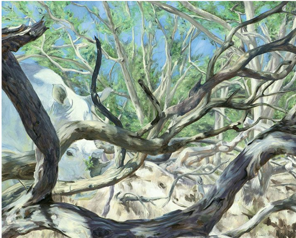
"Medicina / Medicine ", óleo sobre lienzo / oil on canvas , 30" x 24", 2012 © Sarah Soward