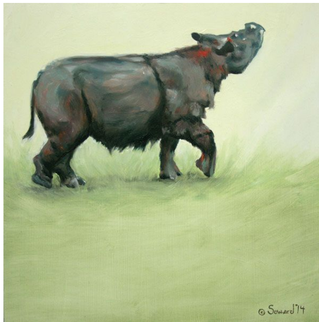
"Suci Rhino", óleo sobre lienzo / oil on canvas, 10" x 10", 2012 © Sarah Soward

«I've been painting rhinos off and on and in fits and starts since 1999. I am obsessed with them: Their shapes and negative spaces, their wrinkles and horns, the hairy ones, the armored ones, the stoic ones rolling in mud. The first paintings were made because a friend needed a wedding present. In my process of research and study, I fell in love. Those first paintings were, for the most part, even more surreal and often more abstract than my current series, Rhinotopia. The very first three rhino paintings I made had amorphic backgrounds and were a bit abstract. One of them was even called Marriage. The painting that my friend and her new husband decided on was not that one. They chose a different painting altogether. It was made after a fire in my studio apartment and was very..flame oriented.»