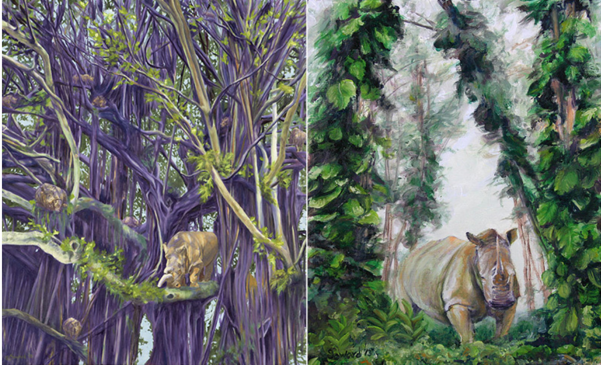
Izq./ Left: "Espacios aislados / Secluded Spaces", óleo sobre lienzo / oil on canvas, 20" x 24", 2012