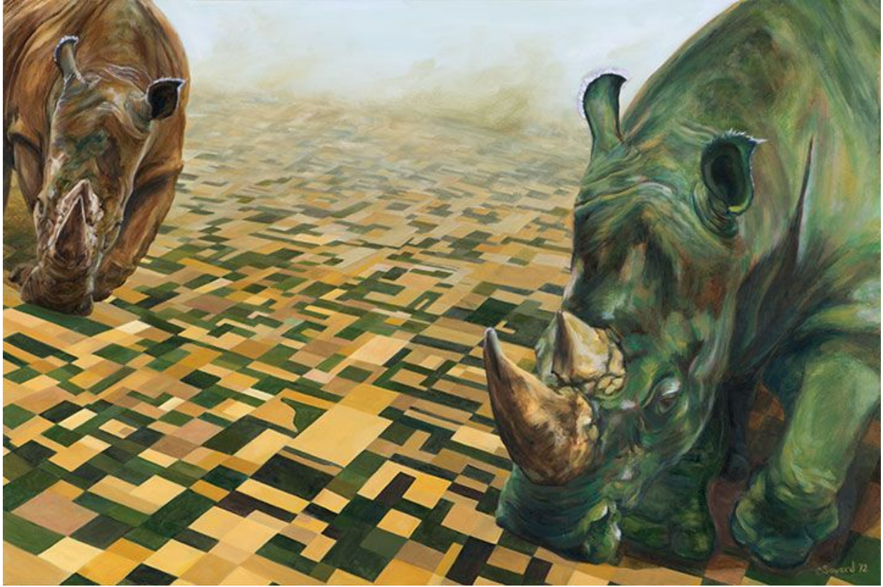
"Esas manos / These Hands ", óleo sobre lienzo / oil on canvas , 36" x 24", 2012 © Sarah Soward

«He estado pintando rinocerontes de vez en cuando y a trompicones desde 1999. Estoy obsesionada con ellos; sus formas y espacios negativos, sus arrugas y cuernos, los peludos, los acorazados, los estoicos revolcándose en el barro. Las primeras pinturas las hice porque una amiga necesitaba un regalo de bodas. En mi proceso de investigación y estudio, me enamoré de ellos.