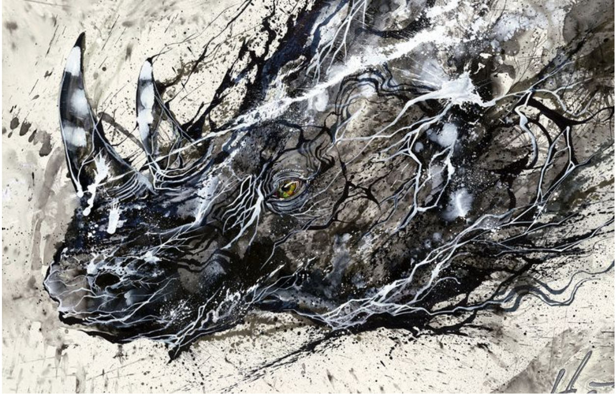
"Rinoceronte Jedi / Jedi Rhino" (detalle / detail)

Hua Tunan (画图男) is a Chinese Graffiti-Artist/Painter born 1991 in Foshan, Guangdong.