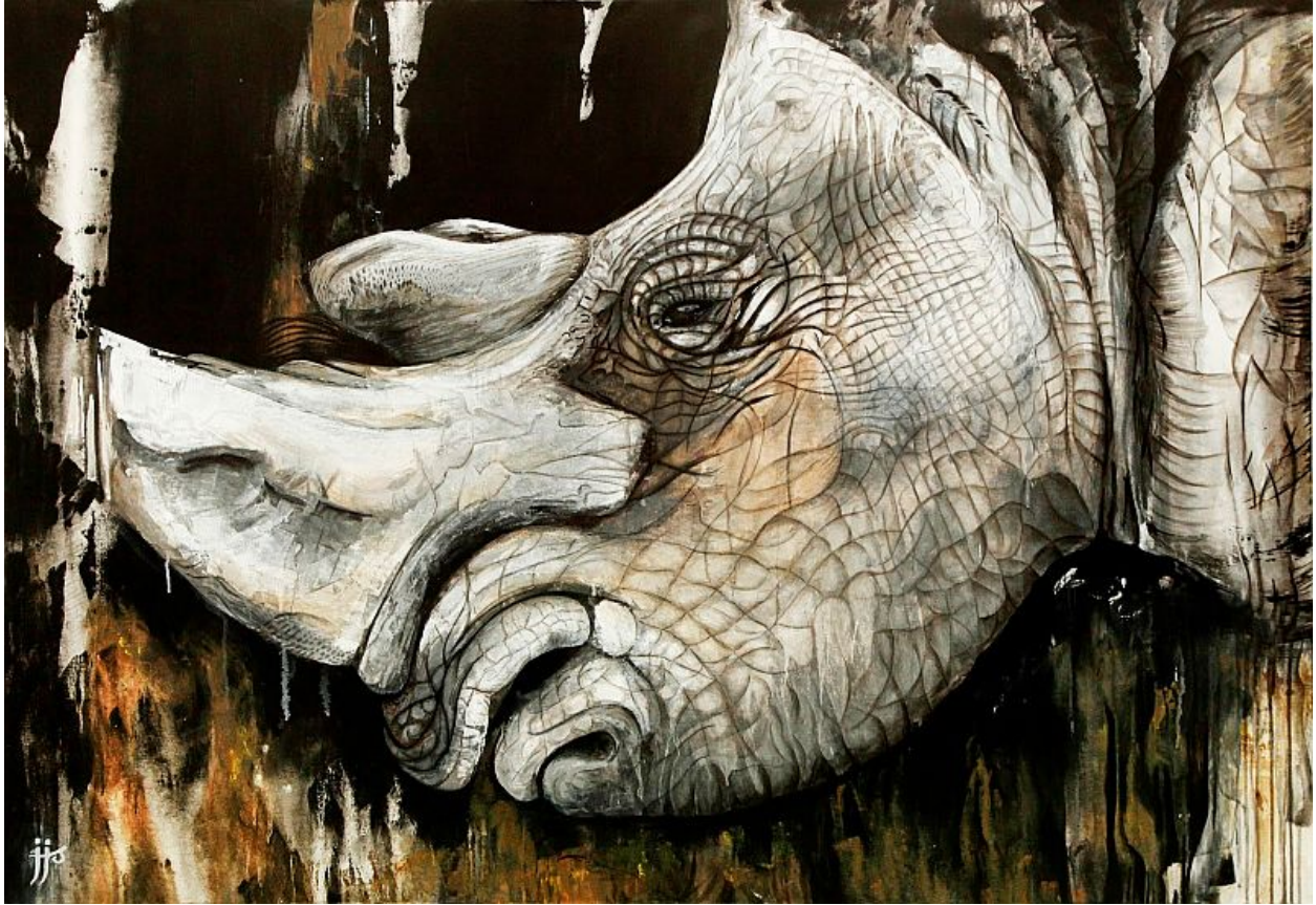
"Rinoceronte / Rhinoceros ", acrílico sobre lienzo / acrylic on canvas , 160 x 110 cm