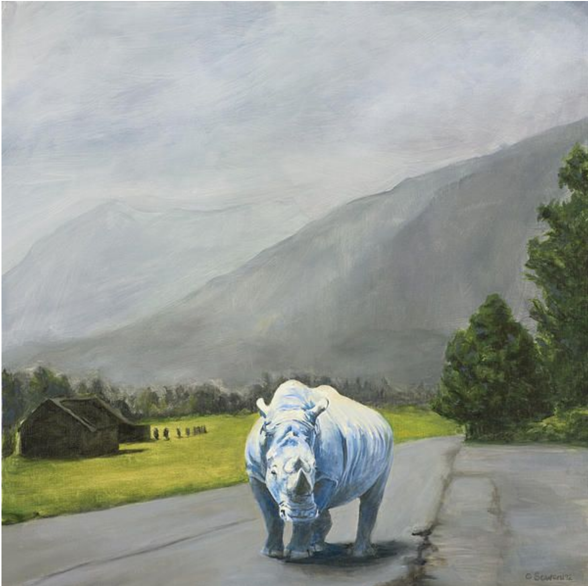
"Cielo Azul / Sky Blue", óleo sobre lienzo / oil on canvas, 24" x 24", 2012 © Sarah Soward

One of her rhinoceros paintings, Medicine, was accepted into the Wildlife Artist of the Year 2013 exhibition in London, England.