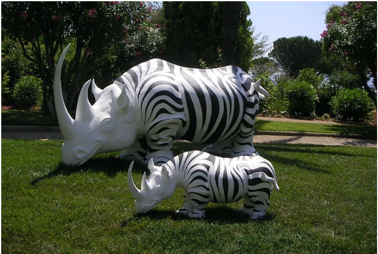
"La escultura monumental / The Monumental Sculpture " - Grand Hôtel - Saint Jean Cap Ferrat, 2007