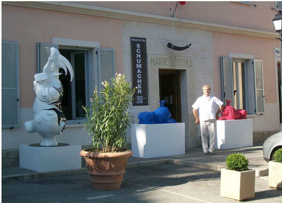
Exposición / Exposition Festival du Peu - Bonson, Julio / July , 2011