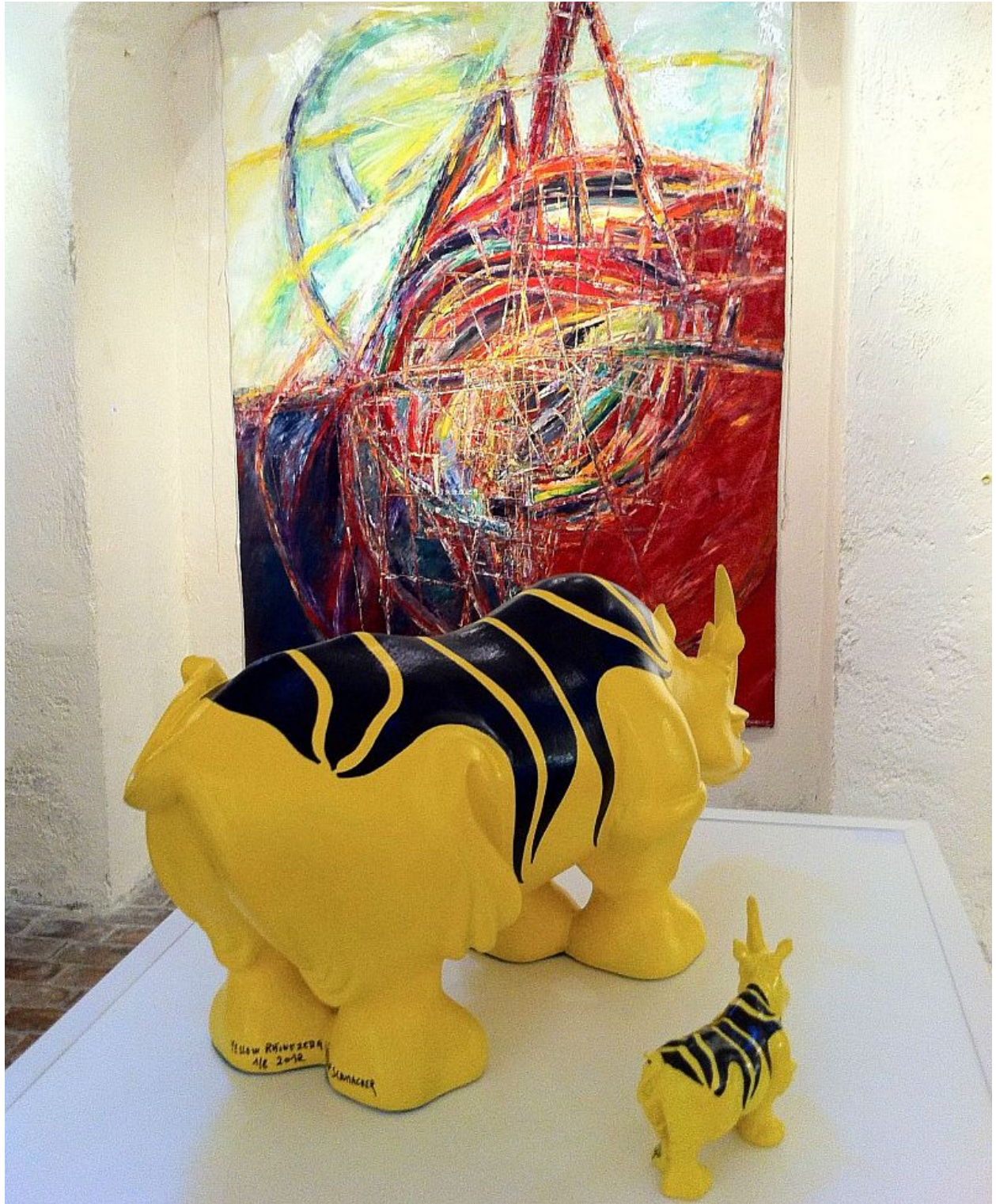
Exposición en / Exposition in Beaulieu sur Mer, Chapelle Sancta Maria