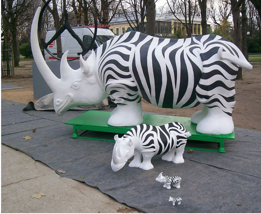
Art en Fête, Campos Elíseos / Champs-Élysées - Paris, 2008