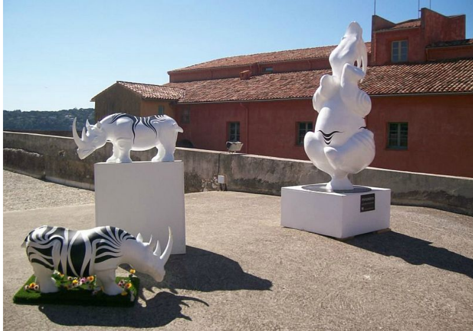
Exposición / Exposition Villefranche sur Mer, Abril - Mayo / April - May 2012 Citadelle de Villefranche sur Mer et Chapelle Saint Elme