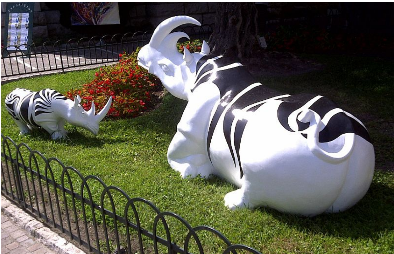
Exposición en / Exposition in Beaulieu sur Mer, Chapelle Sancta Maria

His work can be found in many private collections in France, Germany, Italy, USA, Monaco, Switzerland.