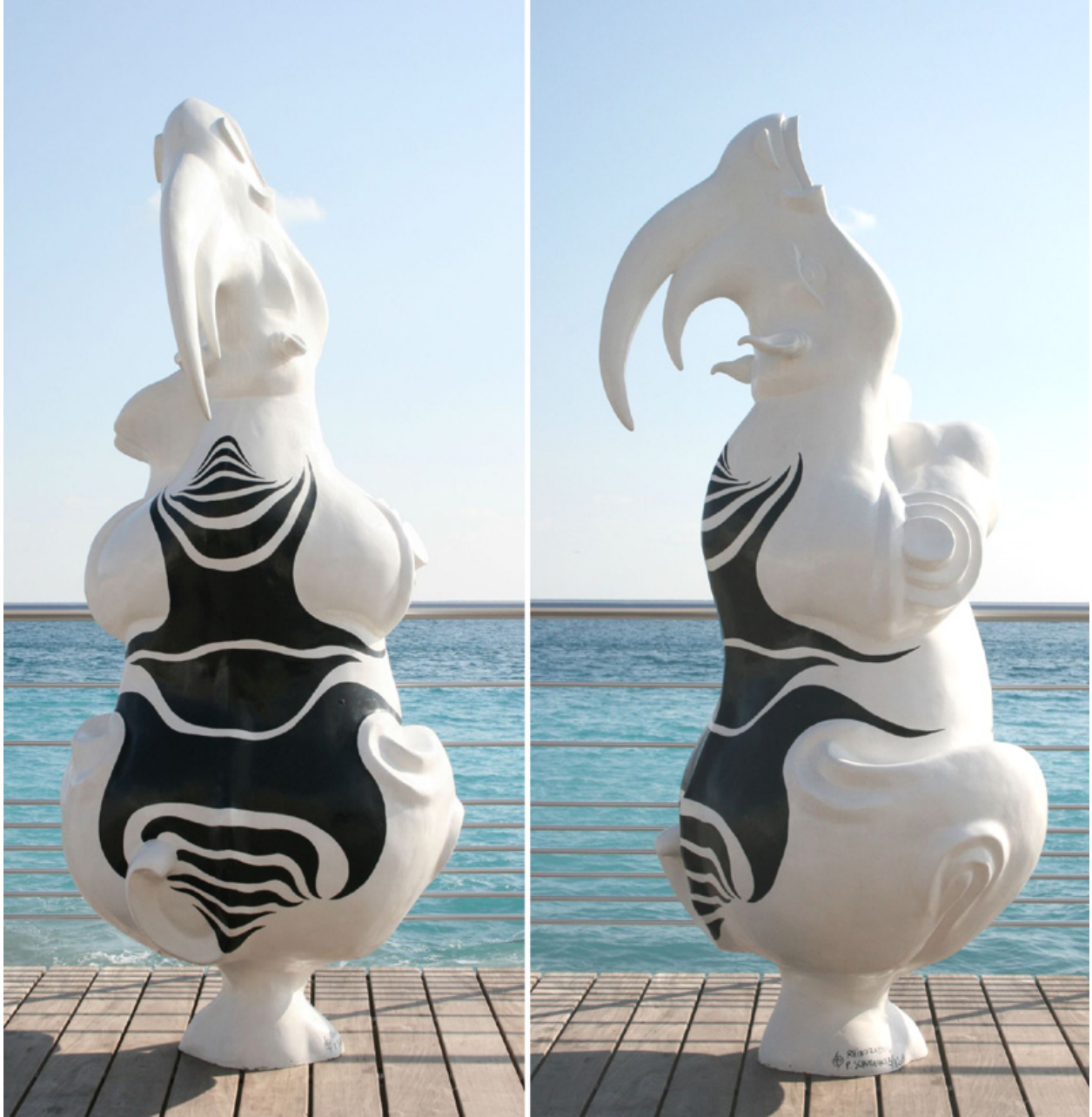
Art Beach - Cagnes sur Mer, 2011