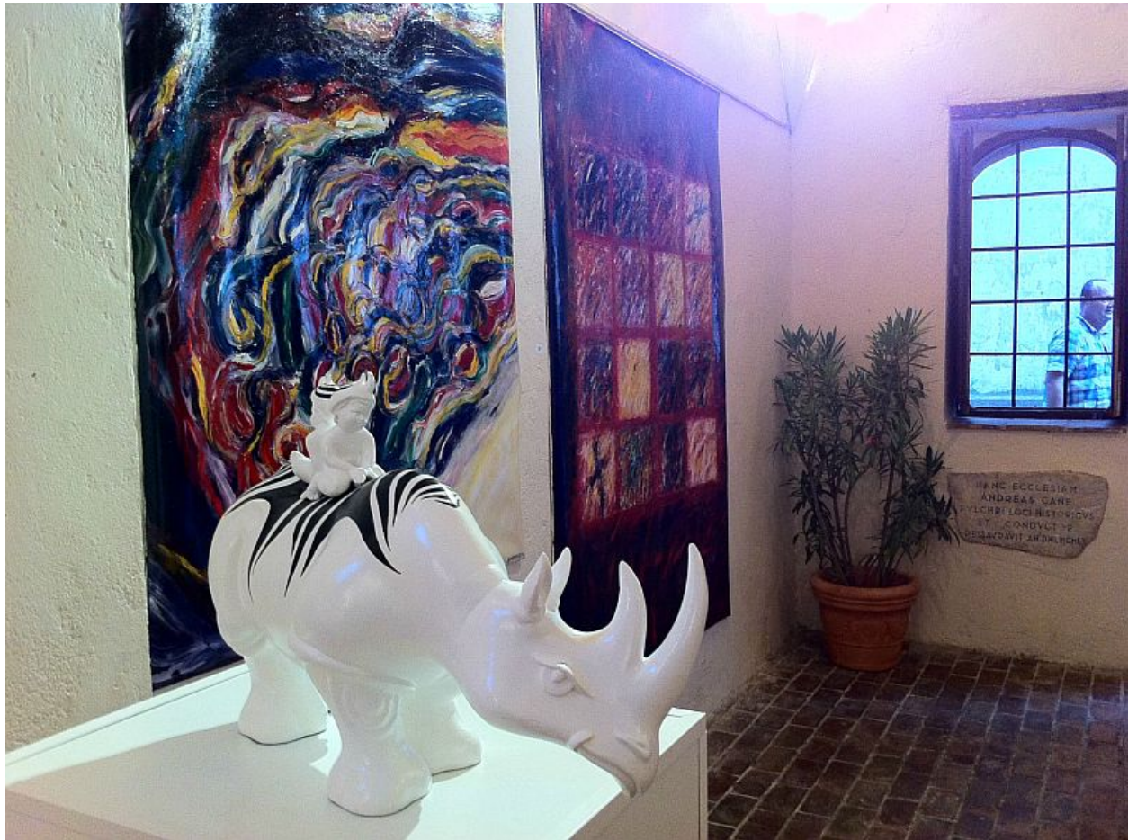
Exposición en / Exposition in Beaulieu sur Mer, Chapelle Sancta Maria

En 2005 creó un "Rhinocebra"; un rinoceronte con piel de cebra. Desde obras monumentales a bisutería, ha derivado una familia de rinocebras de ojos conmovedores que cautivaron a muchos. Sus trabajos se han presentado en varias exposiciones. Los rinocebras fueron expuestos durante la época navideña en los Campos Elíseos durante ART ELYSEES, donde fue uno de los artistas destacados y una de sus obras fue invitado al plató de France 2 "Vivement Dimanche", en compañía de Michel Drucker y Claude Sérillon. Su fama no deja de crecer en todo el mundo, y es acogido por prestigiosas galerías.