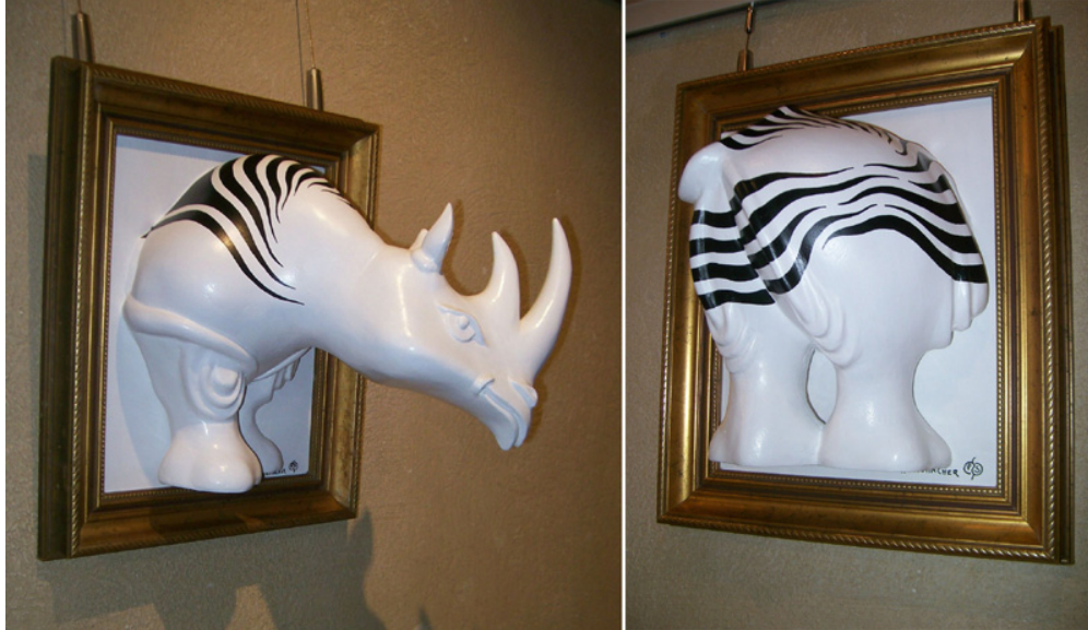
Exposición / Exposition Villefranche sur Mer, Abril - Mayo / April - May 2012 Citadelle de Villefranche sur Mer et Chapelle Saint Elme