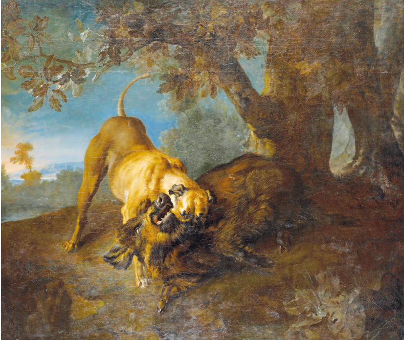
Abb. 1: Jean-Baptiste Oudry, „Kampf zwischen Hund und Wildschwein“, 1731, Staatliches Museum Schwerin, Inv.-Nr. G 875

Das Zitat verdeutlicht die genaue Beobachtungsgabe des jungen Prinzen. Friedrichs Interesse an einer Verifizierbarkeit der Naturdarstellung wird hier offenkundig. Genau stellt er die Abweichung von einer naturgetreuen Wiedergabe im Werke Oudrys sowohl im Kolorit wie auch in der dargestellten Handlung fest. Dennoch erscheint ihm das Werk als „sehr schön“.