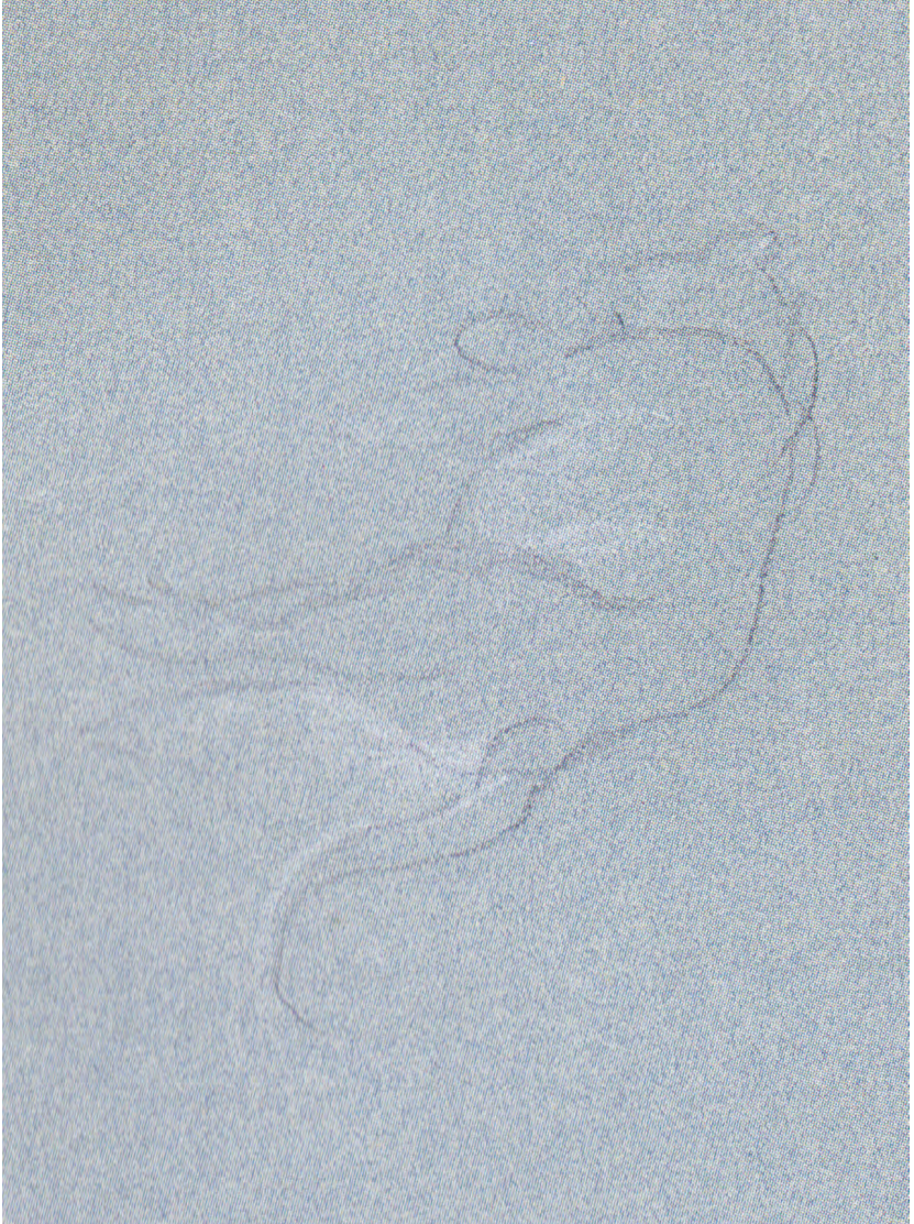
Abb. 10: Friedrich von Mecklenburg-Schwerin, Studie eines toten Tigers, ehemals „eines schleichenden Leoparden“, Detail um 90° gedreht, unbezeichnet, Staatliches Museum Schwerin, Inv.-Nr. 1173 Hz