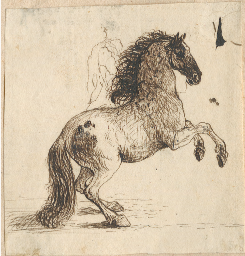
Abb. 7: Friedrich von Mecklenburg-Schwerin, Skizze eines steigenden Pferdes, um 1737/8, LHAS, 2.12–1/25, Nr. 216/1 (wie Anm. 6).

Spannung der Hinterhand erzeugen und den Eindruck erwecken, dass sie in kurzer Zeit entstanden sein muss. Das Auge des Pferdes wirkt in der Komposition starr und rund. 41