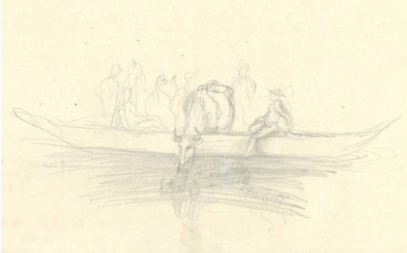
Abb. 2: Friedrich von Mecklenburg-Schwerin, Skizze nach Adriaen van der Velde, 1737, LHAS, 2.12–1/7, Nr. 296 (wie Anm. 5), Brief 9.