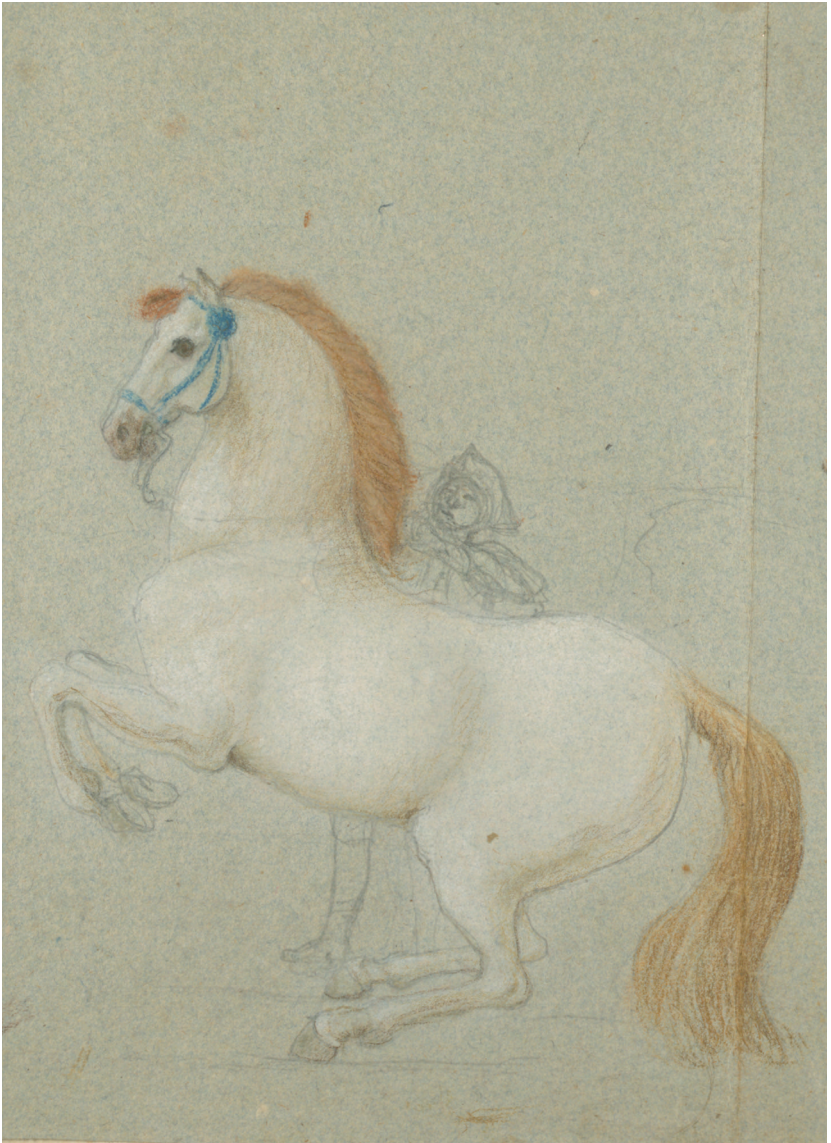
Abb. 5: Friedrich von Mecklenburg-Schwerin, Pastellstudie eines weißen Pferdes, undatiert, LHAS, 2.12–1/25, Nr. 216/1 (wie Anm. 6), S. 26 verso.