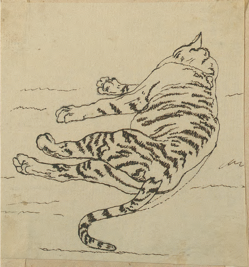
Abb. 11: Friedrich von Mecklenburg-Schwerin, Skizze eines toten Tigers, undatiert, LHAS, 2.12–1/25, Nr. 216/1 (wie Anm. 6), S. 43 verso.

der Machine de Marly 61 , an Anatomie (er besuchte anatomische Vorlesungen), an Architektur und Musik. Besonders fasziniert war er von der hydraulischen Skulptur eines Flötenspielers in den Tuilerien, den Jacques de Vaucanson