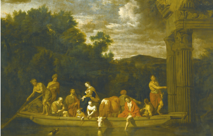
Abb. 3: Adriaen van der Velde, „Die Fähre“, 1659, Staatliches Museum Schwerin, Inv.-Nr. G 112