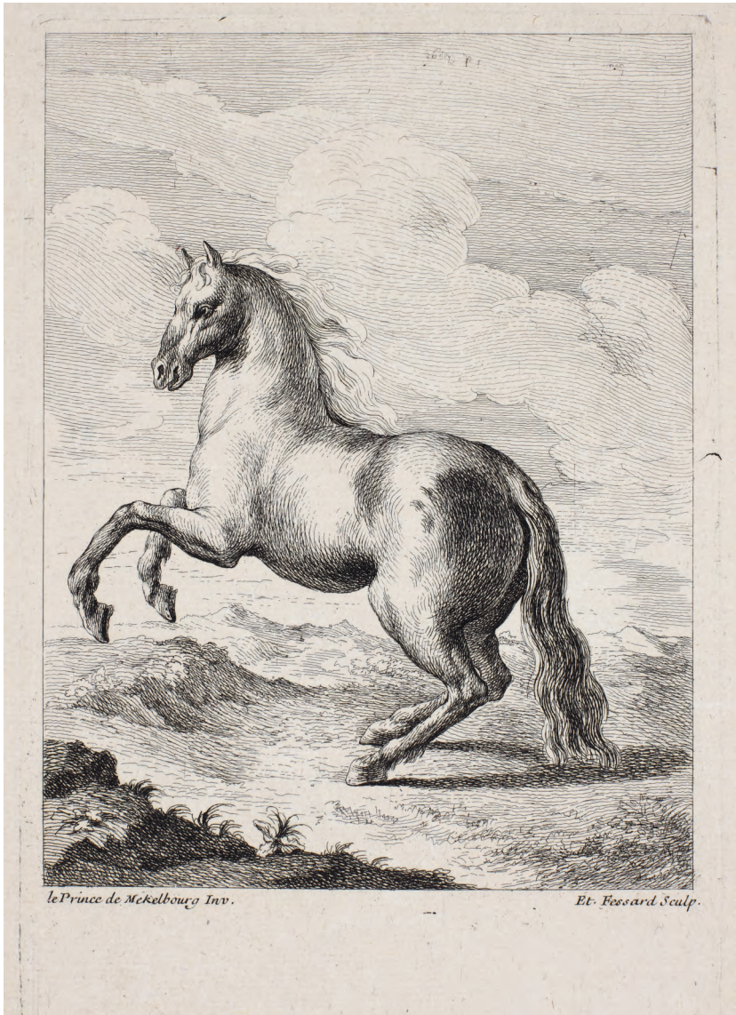
Abb. 6: Friedrich von Mecklenburg-Schwerin, Kupferstich eines steigenden Pferdes, gestochen von Fessard, undatiert, Staatliches Museum Schwerin, Inv.-Nr. 4536 Gr