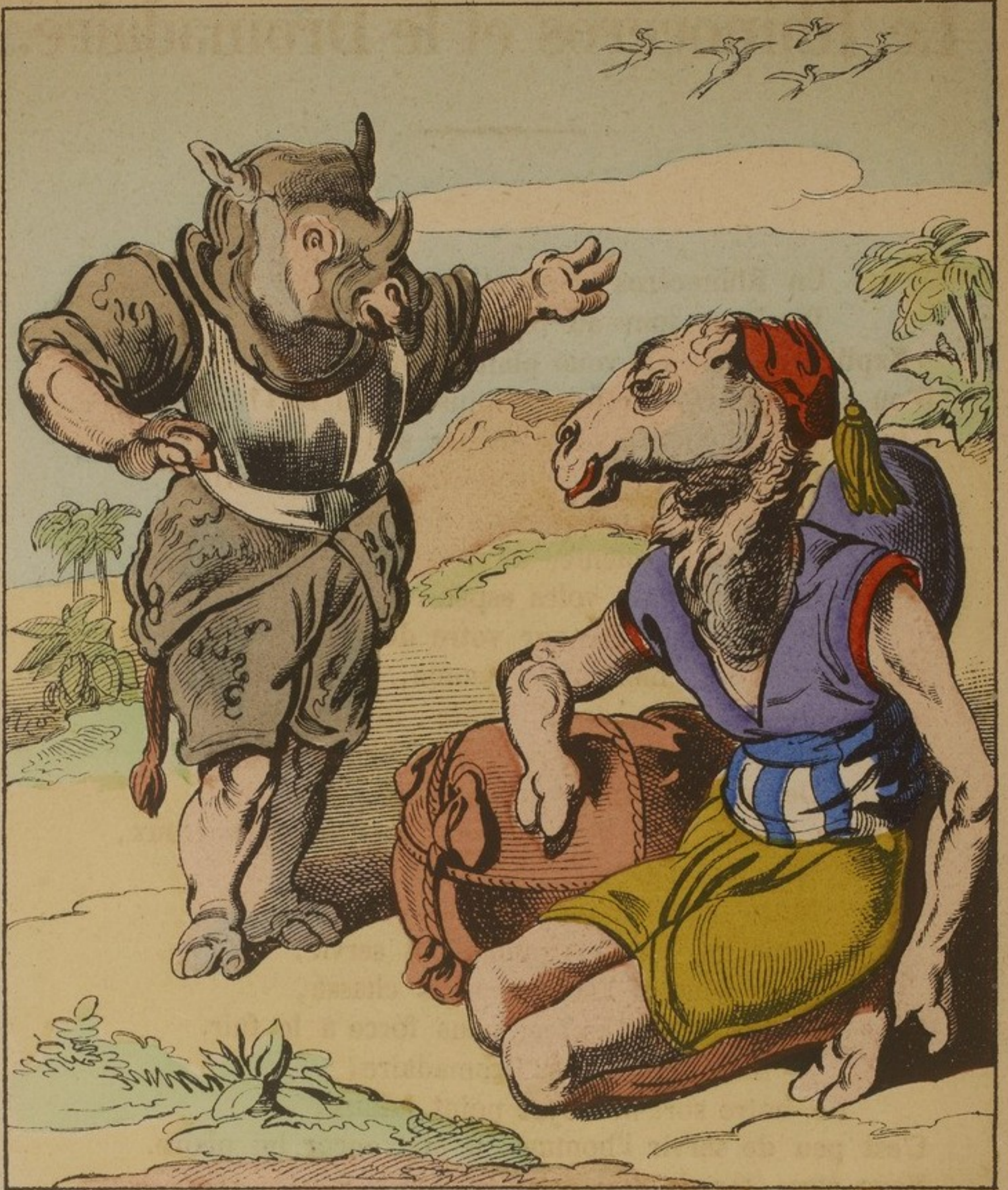
LE RHINOCÉROS & LE DROMADAIRE.