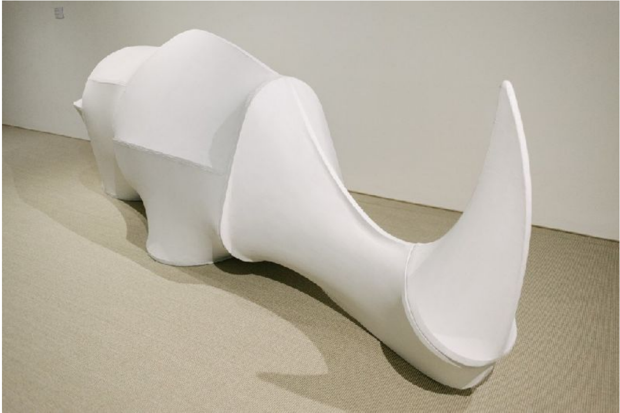
"La decapitazione del rinoceronte / La decapitación del rinoceronte / The Behead of the Rhino ", 140 x 93,5 cm., 1966-1967.

Pino Pascali fue un artista, escultor, escenógrafo y artista de performances italiano nacido en 1935 en Bari, Italia.