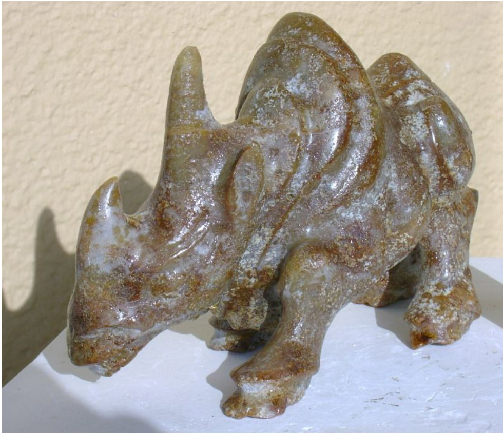
"Rinoceronte / Rhinoceros ", jade negro con pátina / dark jade with patina