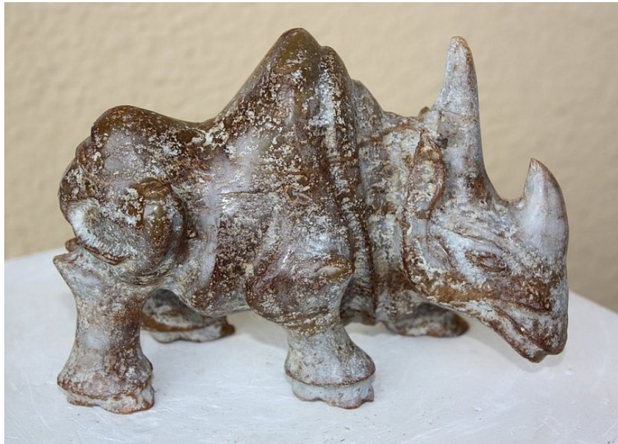
"Rinoceronte / Rhinoceros ", jade negro con pátina / dark jade with patina