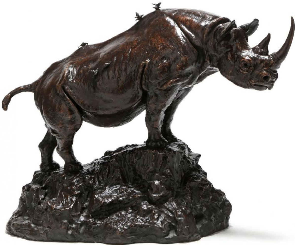
"Rinoceronte negro africano con picabueyes / African Black Rhino with Tick Birds" Bronze con pátina marrón / bronze with brown patina, 28,75" x 39" x 18,5", 1912. Leland Little