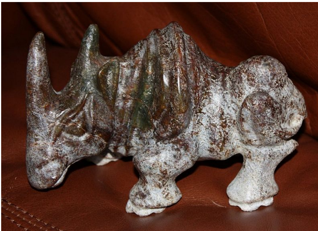
"Rinoceronte / Rhinoceros ", jade negro con pátina / dark jade with patina , 15 x 9 cm., 1.150 g. Posiblemente Dinastía Shang: 1600 a 1046 A.C. ó Dinastía Zhou: 1111 a 225 A.C. / Possible attributions: Shang dynasty: 1600 BC to 1046 BC or Zhou dynasty: 1111BC to 255 BC.