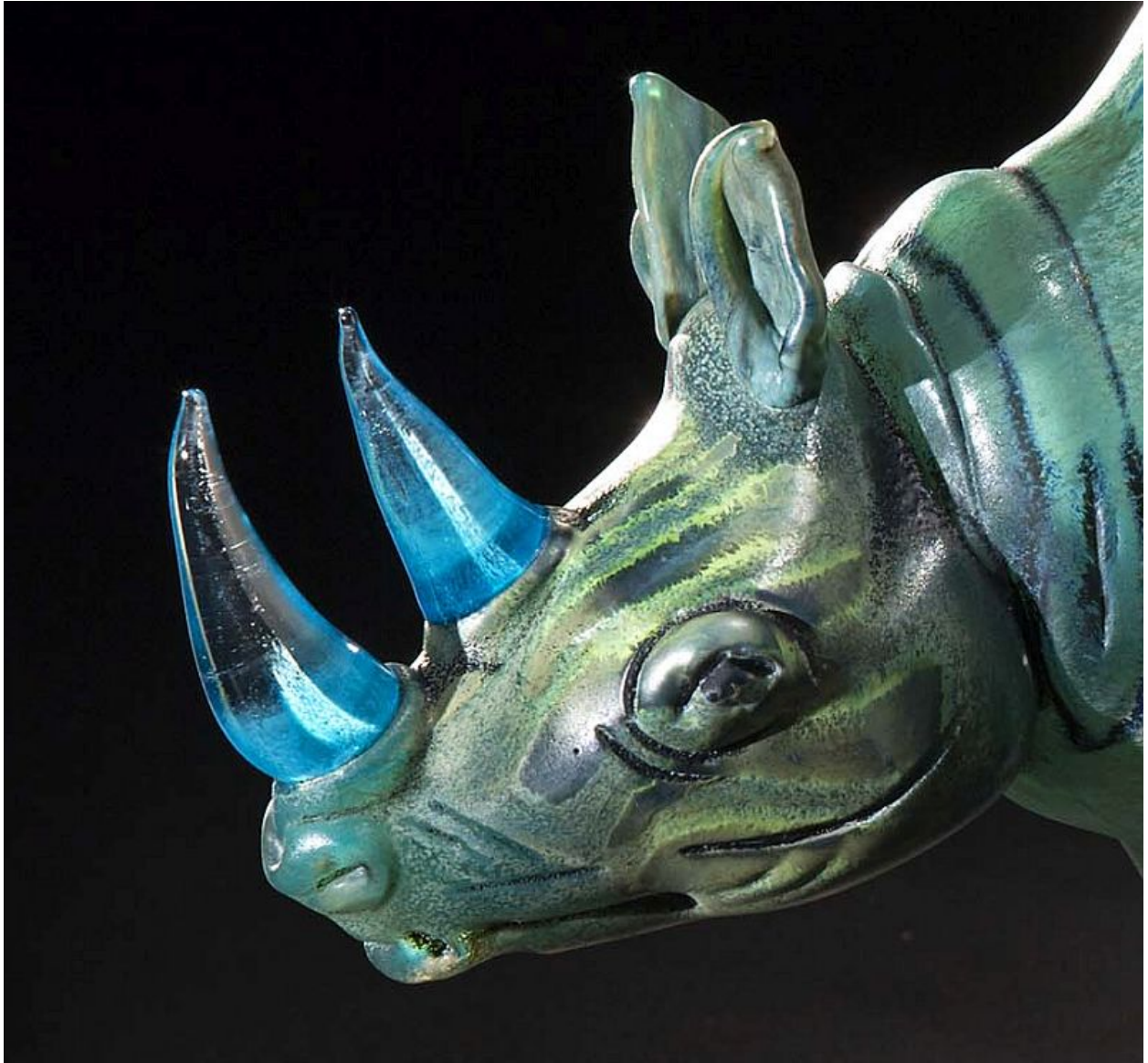
"Escudero / Squire" (detalle / detail)