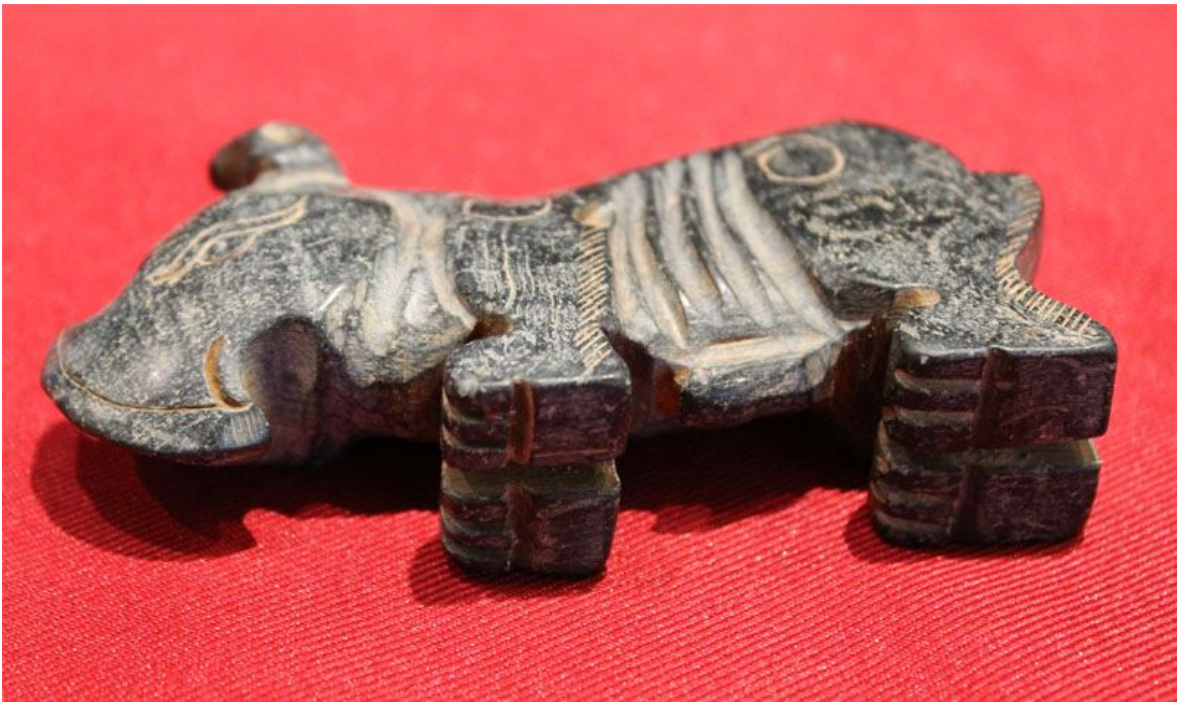
"Rinoceronte / Rhino", piedra negra / black stone