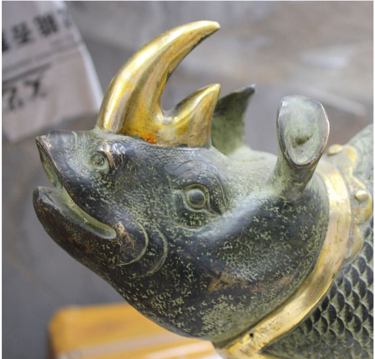
"Rinoceronte / Rhino ", bronce, hecho a mano (detalle) / bronze, handmade (detail)