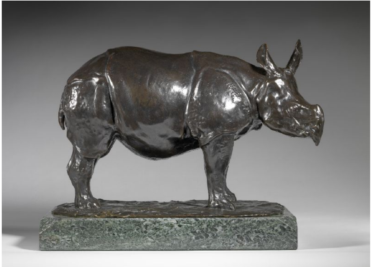
"Rinoceronte de Java Grande / Large Javan Rhinoceros"

Bronce con pátina marrón con matices marrón oscuro / bronze brown patina with dark brown undertones , 27 x 42 cm., c.1907-08.