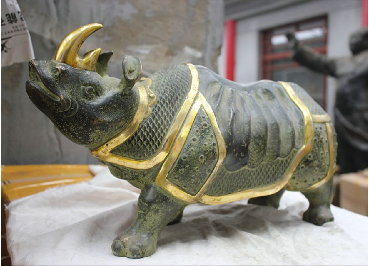
"Rinoceronte / Rhino", bronze, hecho a mano / bronze, handmade