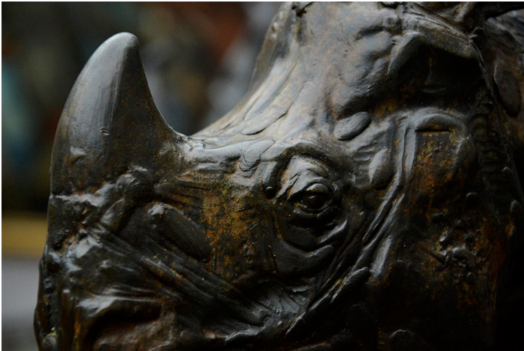
"Rinoceronte de tres años / Three Year Old Rhinoceros ". Alte Nationalgalerie

Rembrandt Bugatti en "El Hurgador" / in this blog : [ Aniversarios (XXXIX) ]