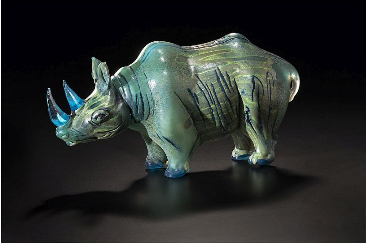
"Escudero / Squire", vidrio soplado, esculpido y grabado a mano / blown, hand-sculpted and engraved glass, 7" x 12,5" x 5", 2014

Shelley Muzyłowski Allen es una estupenda artista del vidrio nacida en Manitoba, Canadá, cuya obra hemos tenido oportunidad de disfrutar más de una vez en el blog (ver enlaces más abajo). Les dejo ahora una selección de sus coloridos rinocerontes.