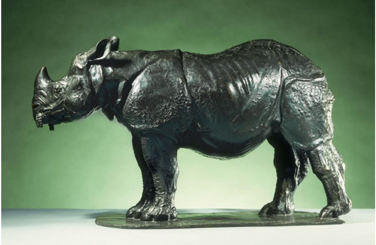
"Rinoceronte de tres años / Three Year Old Rhinoceros "