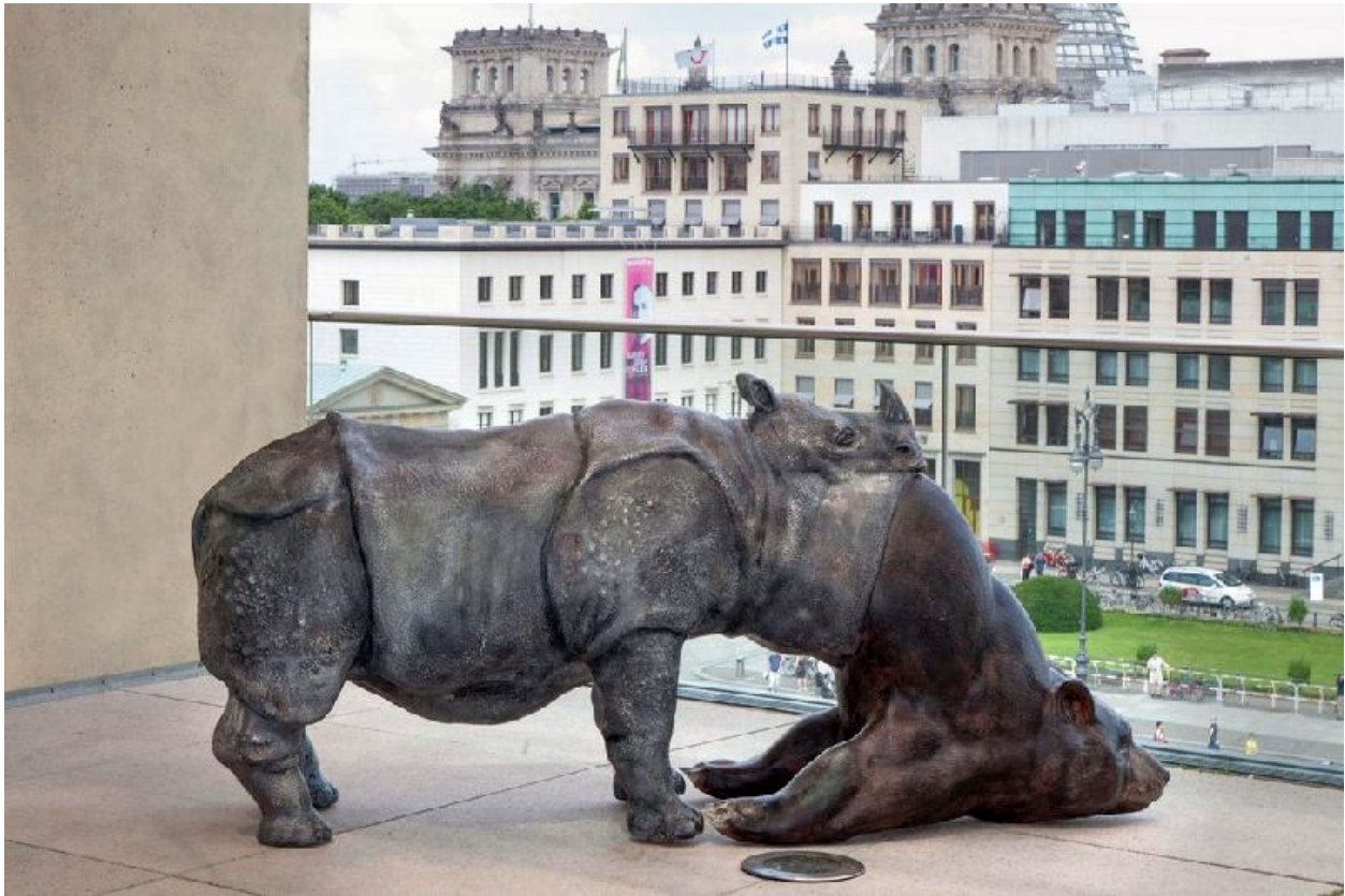
L'Avelée des avelés / Serie El tragador tragado / The Swallower Swallowed Series "Rinoceronte - Oso / Rhino - Bear"

Espuma de alta densidad cortada con CNC, pintura acrílica / CNC routed high density foam, acrylic paint, 230 x 103 x 62 cm, 2016.