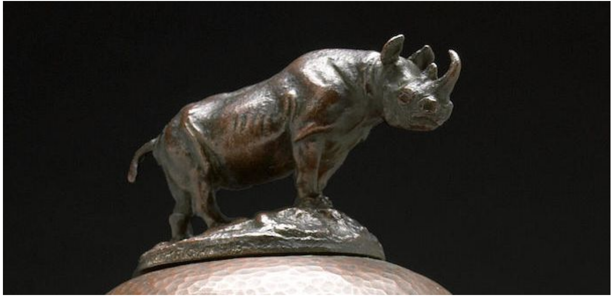
Rinoceronte del remate / Rhino finial : bronze / bronze, altura / height 3 ¼", 1913. Bonhams

In the Victorian tradition of natural curios and trophies mounted as functional household items this taxidermy foot of a rhino is fashioned as a humidior. Fitted with a hammered copper collar, lining and cover, it contains a removable glass liner for storage of cigars and a copper lid to the interior. The bronze finial designed in the form of a rhino is signed by J.L.Clark