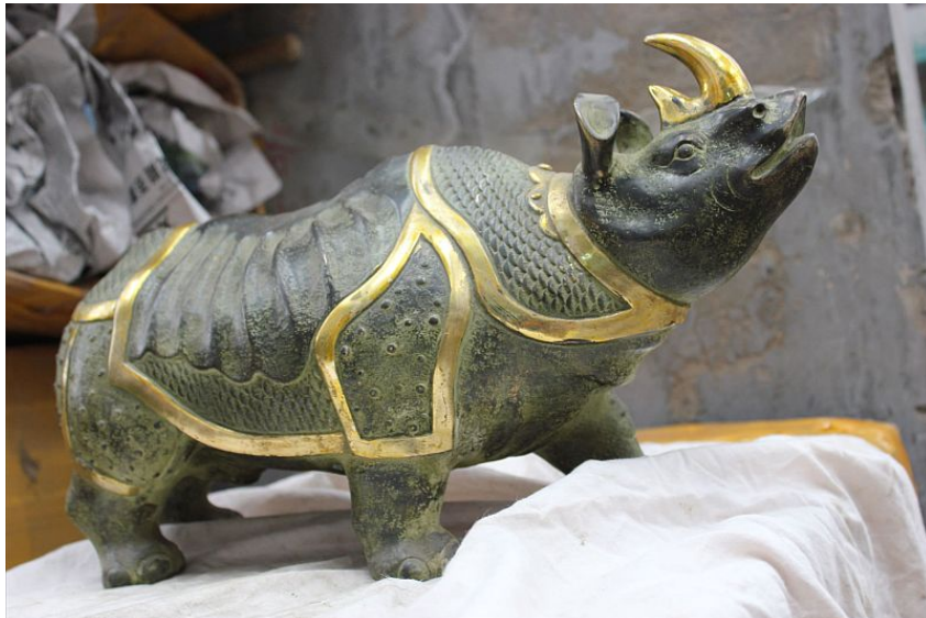
"Rinoceronte / Rhino", bronze, hecho a mano / bronze, handmade