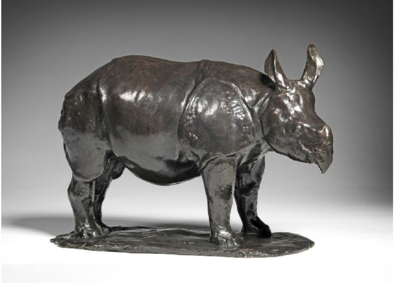
"Rinoceronte de Java / Javan Rhinoceros "

Bronce con pátina negra / bronze black patina , 14 x 21 cm., 1907-08.