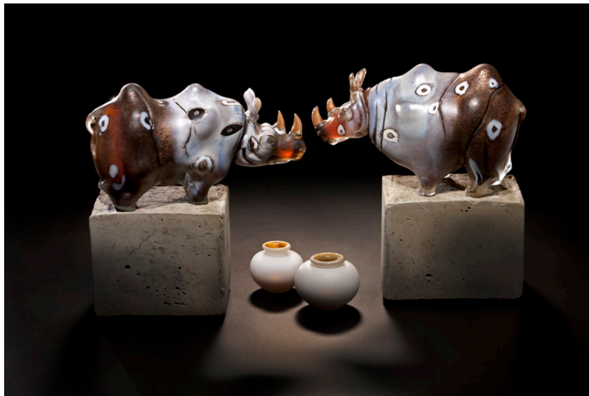
"Can Tankeres", vidrio soplado y esculpido a mano, hormigón, acero / blown and hand-sculpted glass, concrete, steel, 13" x 23" x 9", 2012