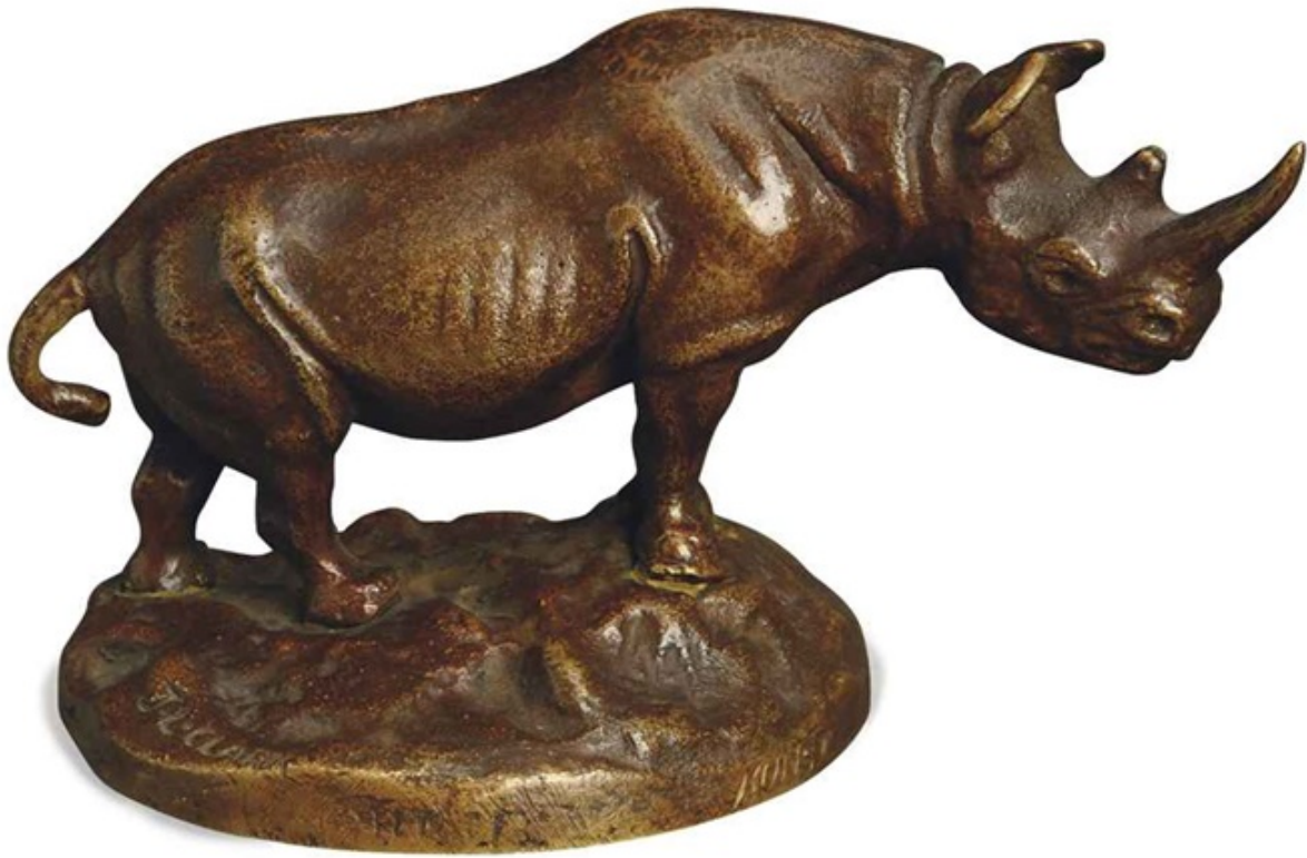
"Rinoceronte africano / African Rhinoceros ", bronze patinado / patinated bronze , 8,8 x 5 x 5 cm., c.1908.