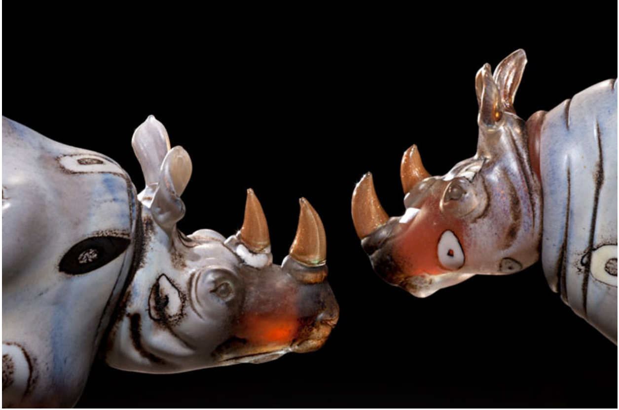
"Can Tankeres" (detalle / detail)

Más sobre Shelley en / More about Shelley in: Website , Schantz Galleries