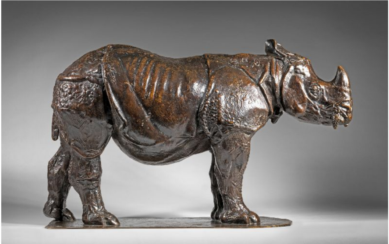
"Rinoceronte de tres años / Three Year Old Rhinoceros "

pátina marrón cálido con matices dorados / warm brown patina with golden undertones , 27 x 42 cm., 1909-10