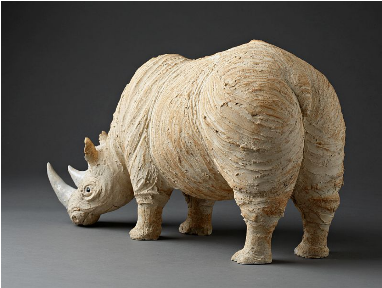
"Rinoceronte / Rhinoceros"

On the threshold of the 2000s and more recently, as a trend towards more lightness and the search for something more aerial, the inspiration of the artist centered around the birds. Familiar with the landscapes and gardens of her childhood, the birds imagined by Charlotte Poulsen takes flight from a base, itself part of the work, to the point of having quickly become its major expression.