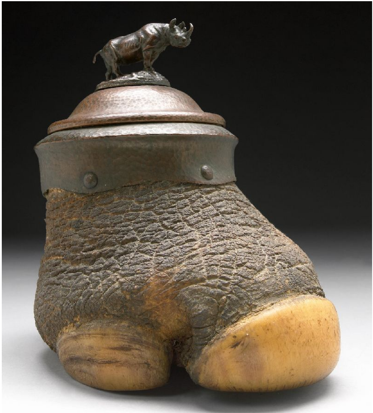
"Humidificador para tabaco hecho con una pata de rinoceronte, montado en bronce / Bronze-Mounted Rhinoceros Foot Humidor ". Altura total / height overall : 10 1/2"

En la tradición victoriana de curiosidades naturales y trofeos montados como artículos funcionales para el hogar, esta taxidermia de una pata de rinoceronte se configura como un humidificador. Equipado con un collar de cobre martillado, forro y cubierta, contiene un forro de vidrio extraíble para el almacenamiento de cigarros y una tapa de cobre. El remate de bronce diseñado en forma de rinoceronte está firmado por J.L.Clark.