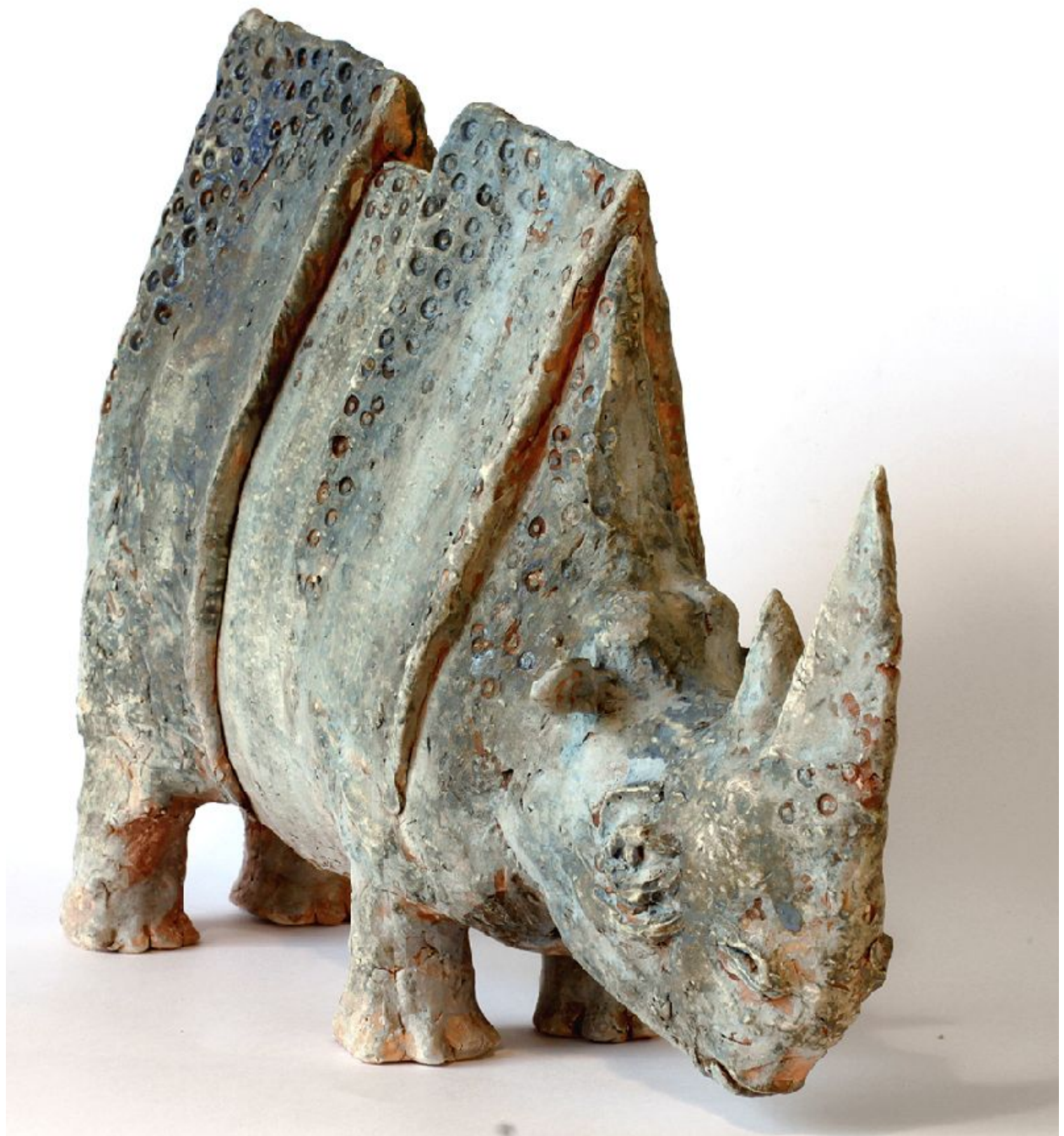
"Nosorożec niebiski / Rinoceronte azul / Blue Rhinoceros "