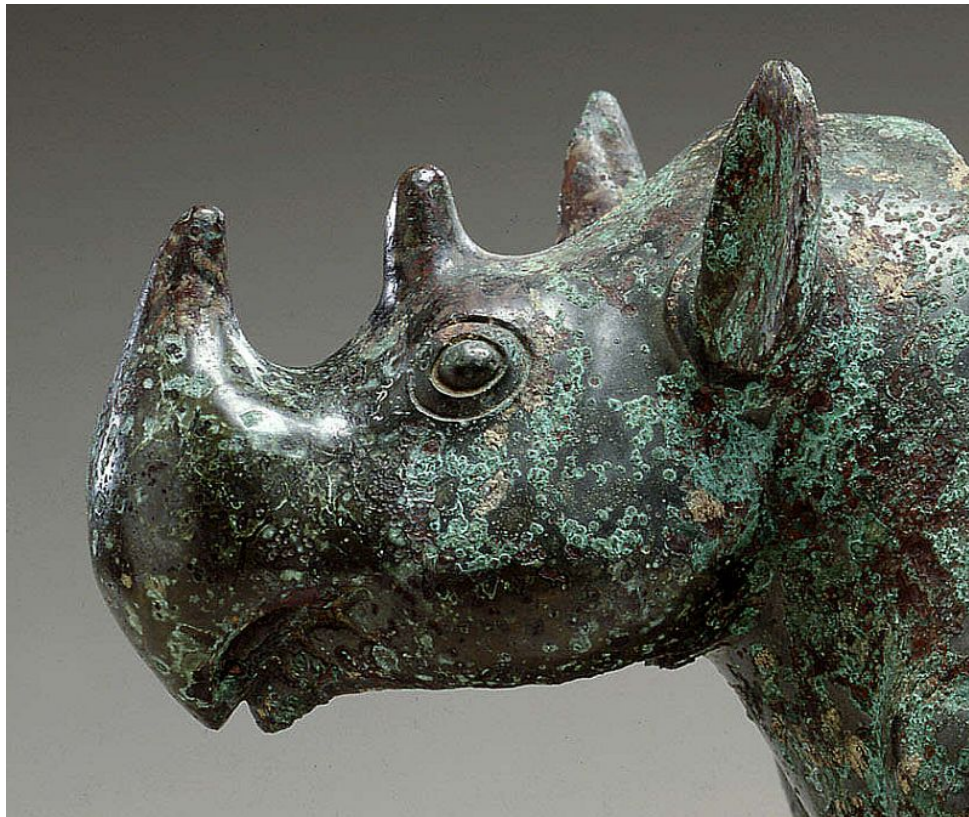
"Vasija ritual / Ritual Vessel" (detalle / detail)

The rhinoceros's flesh-like representation distinguishes it from other animal-shaped vessels of the same period, which have dense geometric motifs. It features a round belly and muzzle, animated eyes, and life-like folds of skin around its head and shoulders, creating an effect of dynamic energy and animation.