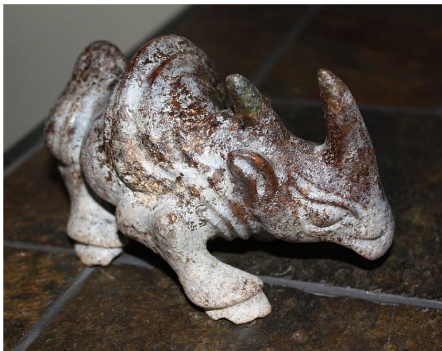
"Rinoceronte / Rhinoceros ", jade negro con pátina / dark jade with patina