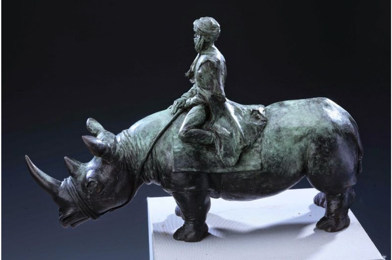
"Cavalcata Africana / Cabalgata africana / African Horseback" Bronze / bronze, 37 x 56 x 18 cm., 2004

Giuseppe Tirelli was born in Tanzania in 1957. He lives and works in Piacenza where he attended the Institute of Fine Art "Gazzola" in the late 80's.