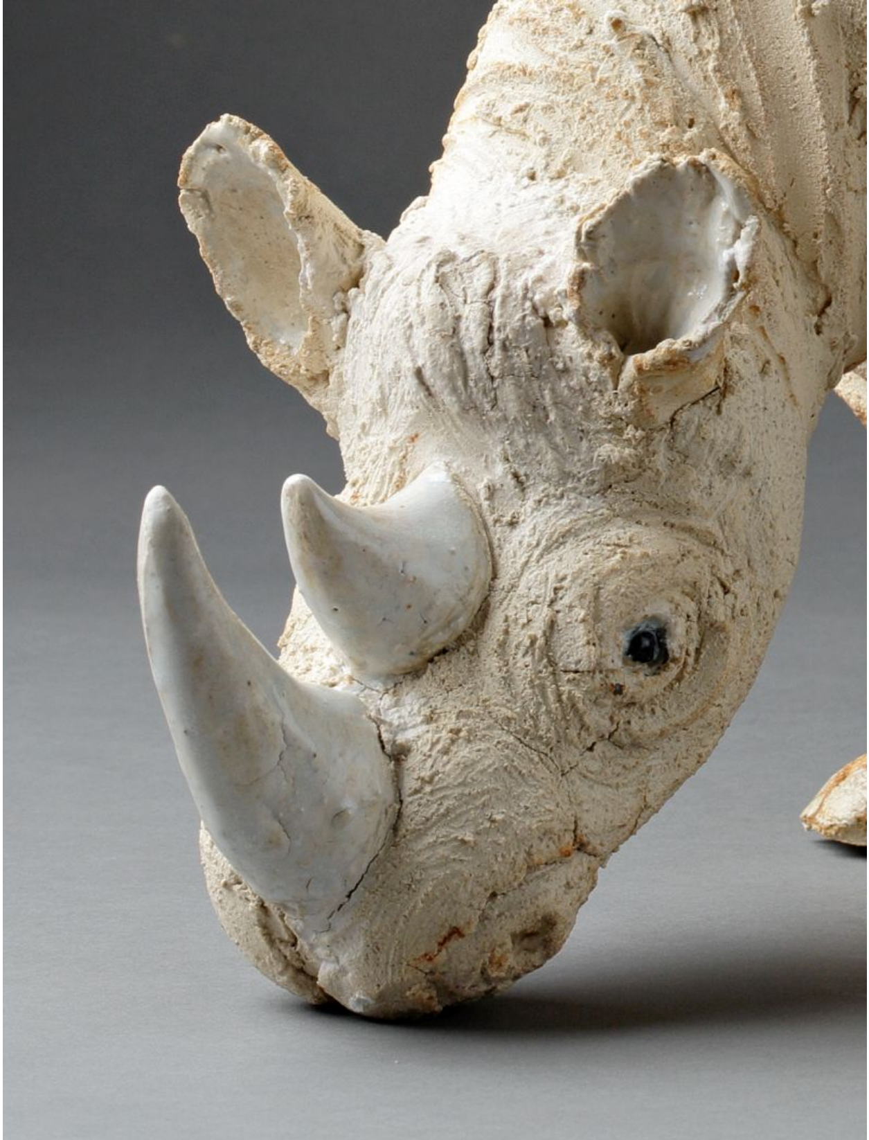
"Rinoceronte / Rhinoceros " (detalle / detail)