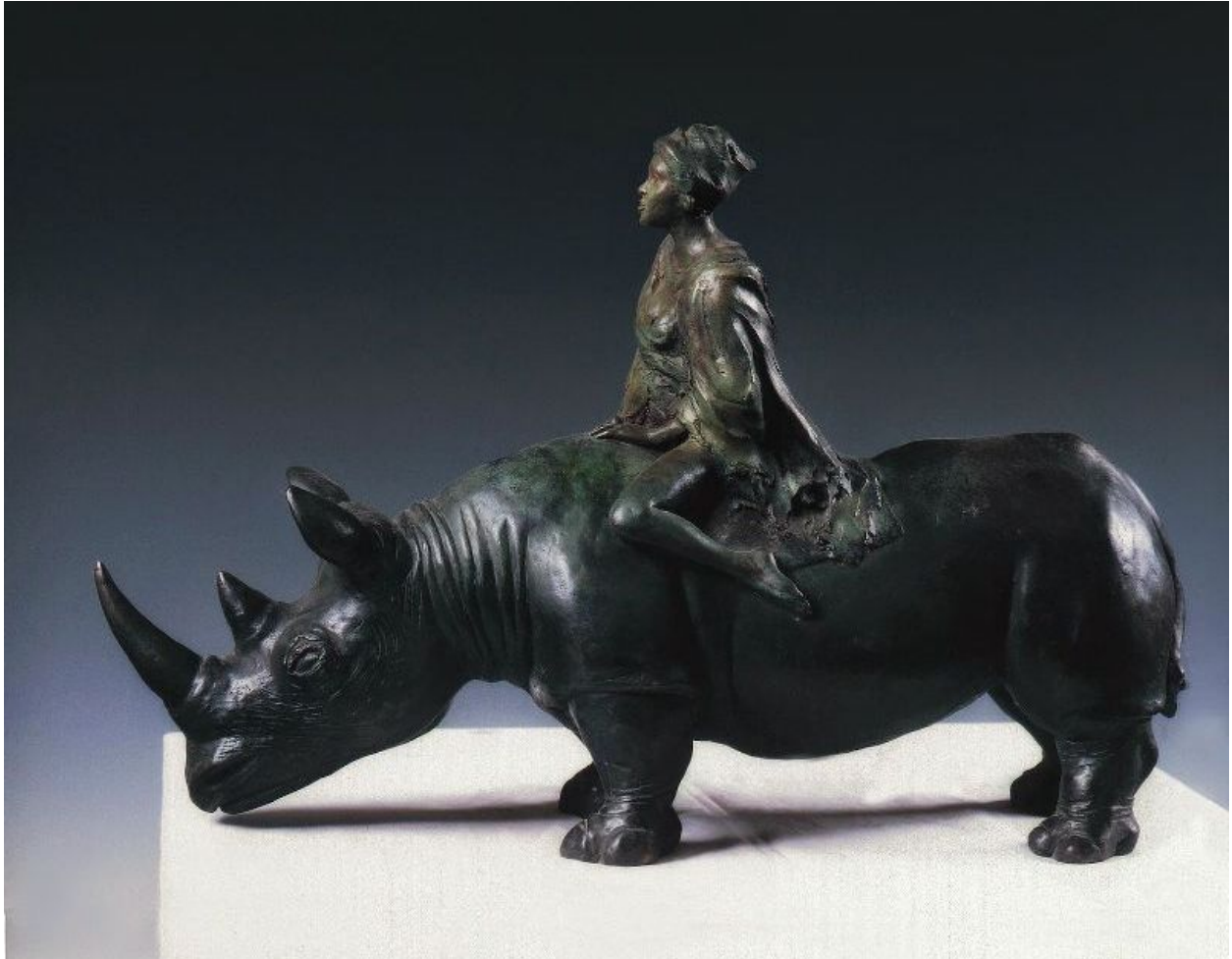
Bronce / bronze (?)