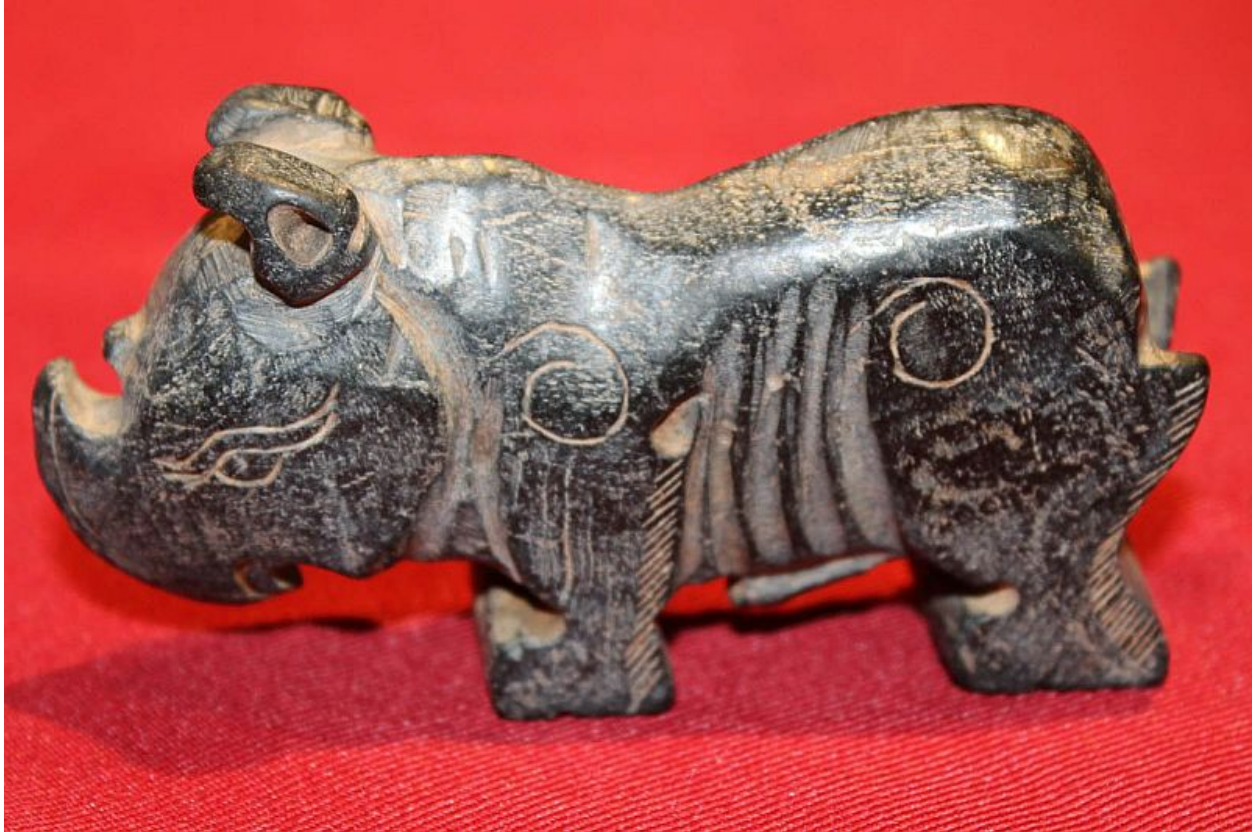
"Rinoceronte / Rhino", piedra negra / black stone, 5 x 10 cm. Período de los reinos combatientes. 476 - 221 A.C. / Zhou warring state period, 476 BC - 221 BC. Real Rare Antiques