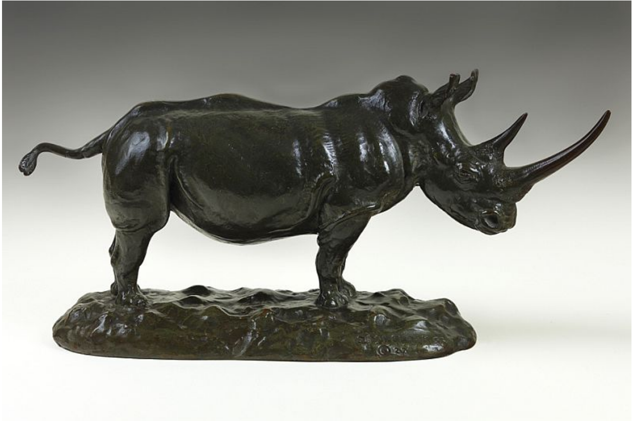
"Rinoceronte blanco africano / African White Rhinoceros ", bronce / bronze , 1927.

James Lippitt Clark fue un distinguido explorador, escultor y científico estadounidense nacido en 1883 en Providence, Rhode Island.