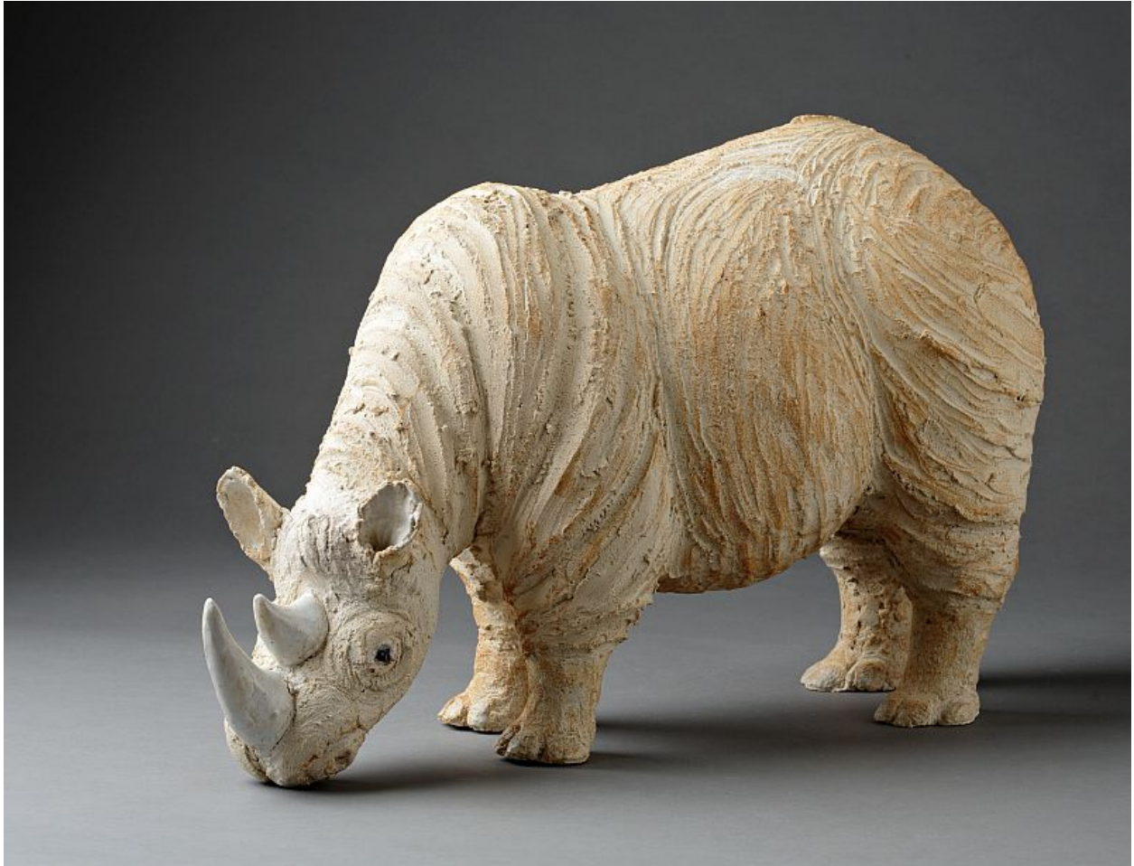
"Rinoceronte / Rhinoceros ", cerámica / ceramic , altura / high : 32 cm.

Ceramista de origen danés (Horsens, 1950), Charlotte Poulsen se hizo famosa en los años '90 por sus esculturas inspiradas en historias de viajeros: antílopes y otros grandes herbívoros de África. Muy característicos, sus animales se modelan a medio camino entre el expresionismo y el realismo.