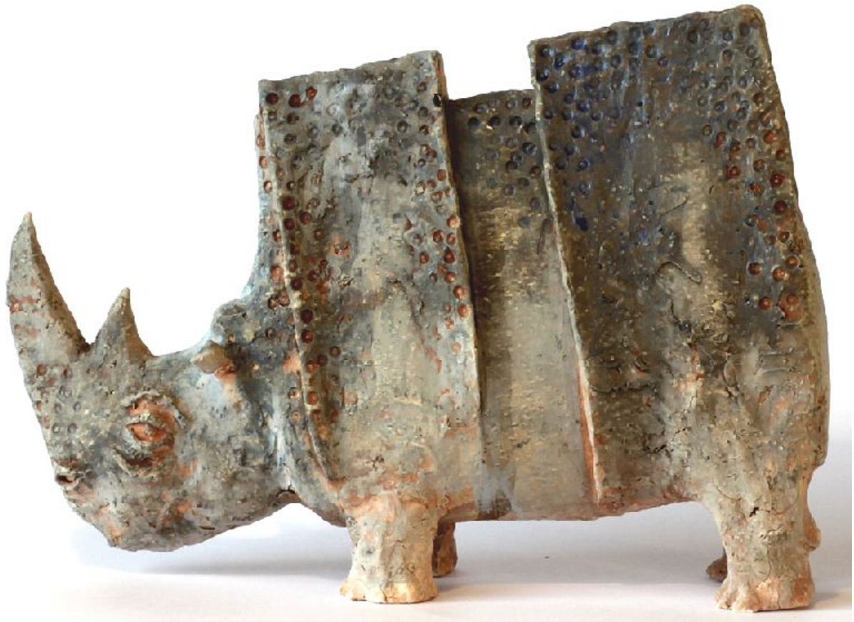
"Nosorożec niebiski / Rinoceronte azul / Blue Rhinoceros " cerámica con esmaltado mate / ceramic with matt glaze , 23 x 23 cm.

Arek Szwed es un artista polaco, nacido en 1969. Así se presenta: