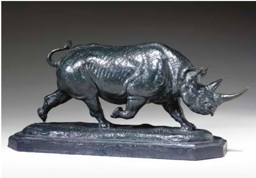
"Rinoceronte a la carga / Charging Rhino " bronce con pátina marrón / bronze with brown patina , altura / high: 43,2 cm., 1949. Christie's

In the Victorian tradition of natural curios and trophies mounted as functional household items this taxidermy foot of a rhino is fashioned as a humidior. Fitted with a hammered copper collar, lining and cover, it contains a removable glass liner for storage of cigars and a copper lid to the interior. The bronze finial designed in the form of a rhino is signed by J.L.Clark