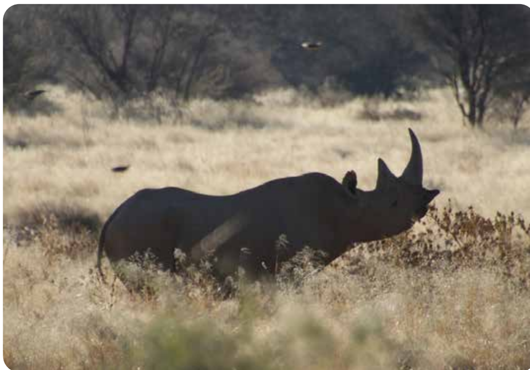
Rhinocéros noir ( Diceros bicornis ).

Les rhinocéros blancs ( Ceratotherium simum ) et les rhinocéros noirs ( Diceros bicornis ) d'Afrique sont inscrits en Annexe I de la CITES sauf les populations de rhinocéros blancs de l'Eswatini et d'Afrique du Sud inscrites en Annexe II pour les animaux vivants et les trophées de chasse.