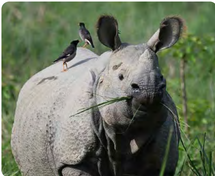
Rhinocéros unicorne de l'Inde ( Rhinoceros unicornis ).

Les rhinocéros blancs ( Ceratotherium simum ) et les rhinocéros noirs ( Diceros bicornis ) d'Afrique sont inscrits en Annexe I de la CITES sauf les populations de rhinocéros blancs de l'Eswatini et d'Afrique du Sud inscrites en Annexe II pour les animaux vivants et les trophées de chasse.