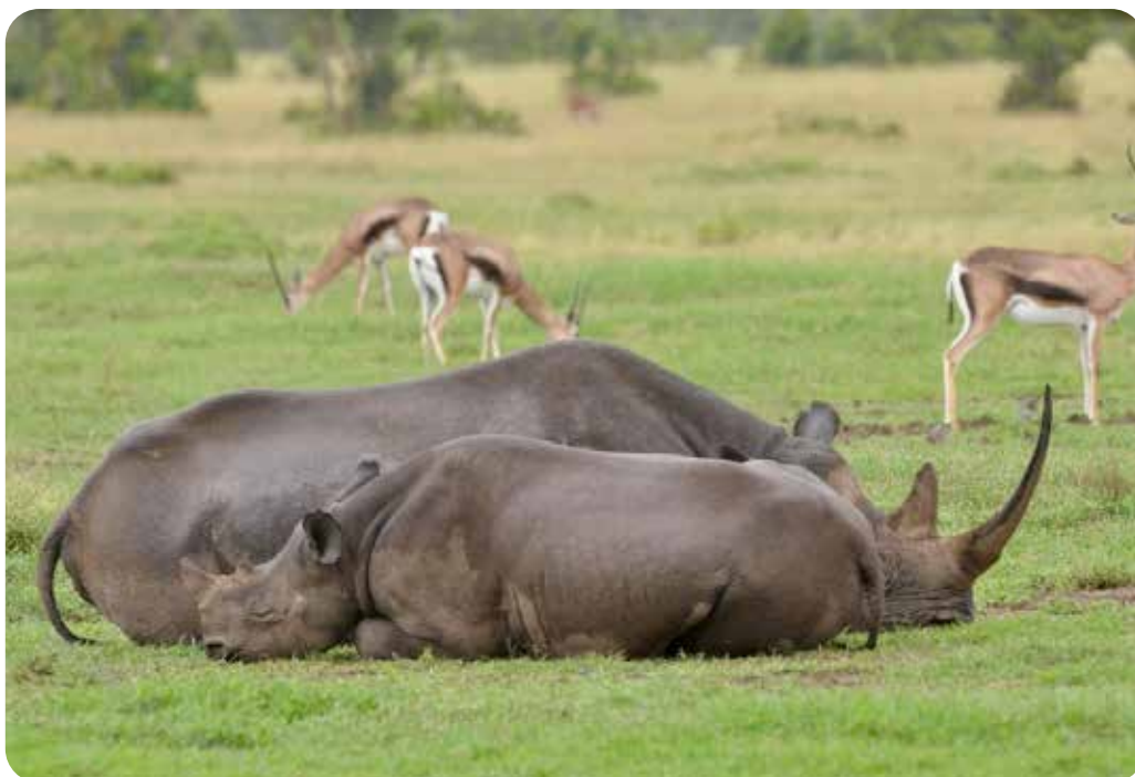
Rhinocéros noirs ( Diceros bicornis ).

Les rhinocéros blancs ( Ceratotherium simum ) et les rhinocéros noirs ( Diceros bicornis ) d'Afrique sont inscrits en Annexe I de la CITES sauf les populations de rhinocéros blancs de l'Eswatini et d'Afrique du Sud inscrites en Annexe II pour les animaux vivants et les trophées de chasse.