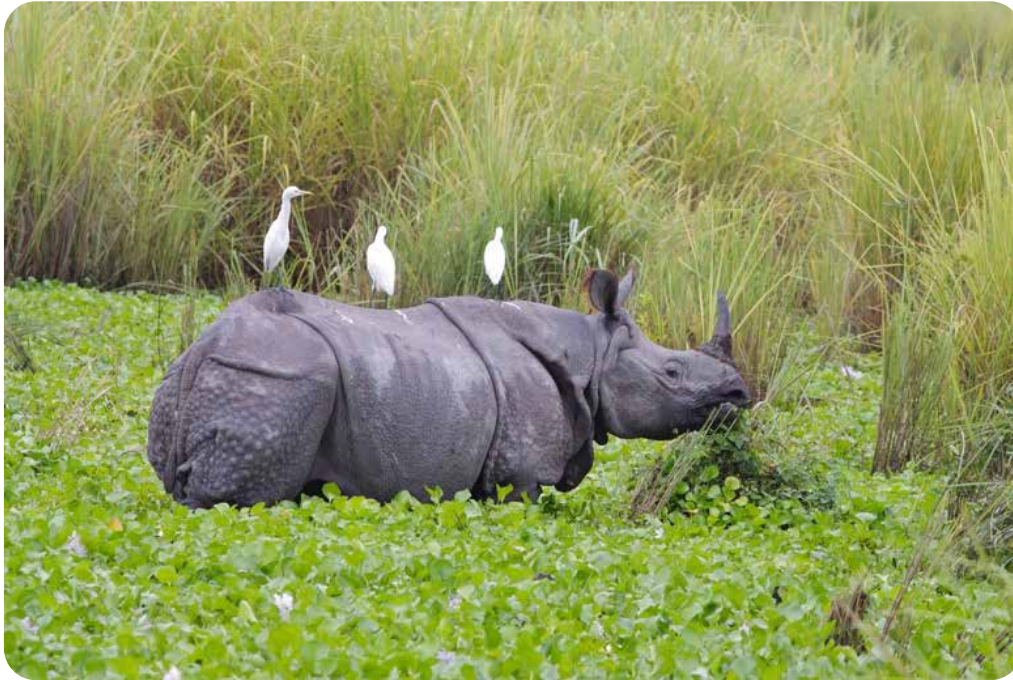
Rhinocéros indien ( Rhinoceros unicornis ) et hérons garde-boeufs ( Bubulcus ibis ).

Les rhinocéros blancs ( Ceratotherium simum ) et les rhinocéros noirs ( Diceros bicornis ) d'Afrique sont inscrits en Annexe I de la CITES sauf les populations de rhinocéros blancs de l'Eswatini et d'Afrique du Sud inscrites en Annexe II pour les animaux vivants et les trophées de chasse.