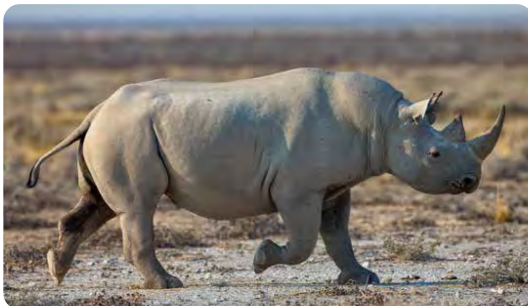
Rhinocéros noir ( Diceros bicornis ).

Les rhinocéros blancs ( Ceratotherium simum ) et les rhinocéros noirs ( Diceros bicornis ) d'Afrique sont inscrits en Annexe I de la CITES sauf les populations de rhinocéros blancs de l'Esuatini et d'Afrique du Sud inscrites en Annexe II pour les animaux vivants et les trophées de chasse.