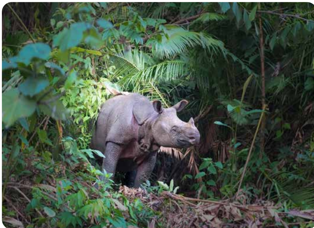
Rhinocéros de Java ( Rhinoceros sondaicus ).

Les rhinocéros blancs ( Ceratotherium simum ) et les rhinocéros noirs ( Diceros bicornis ) d'Afrique sont inscrits en Annexe I de la CITES sauf les populations de rhinocéros blancs de l'Eswatini et d'Afrique du Sud inscrites en Annexe II pour les animaux vivants et les trophées de chasse.