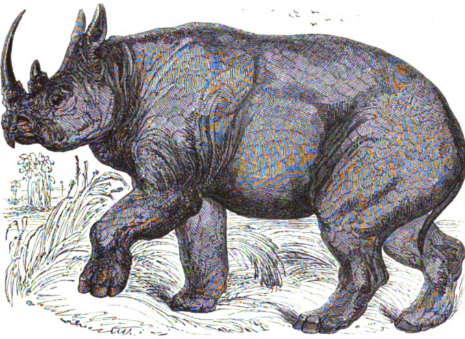
RHINOCÉROS BICORNE, D'AFRIQUE.