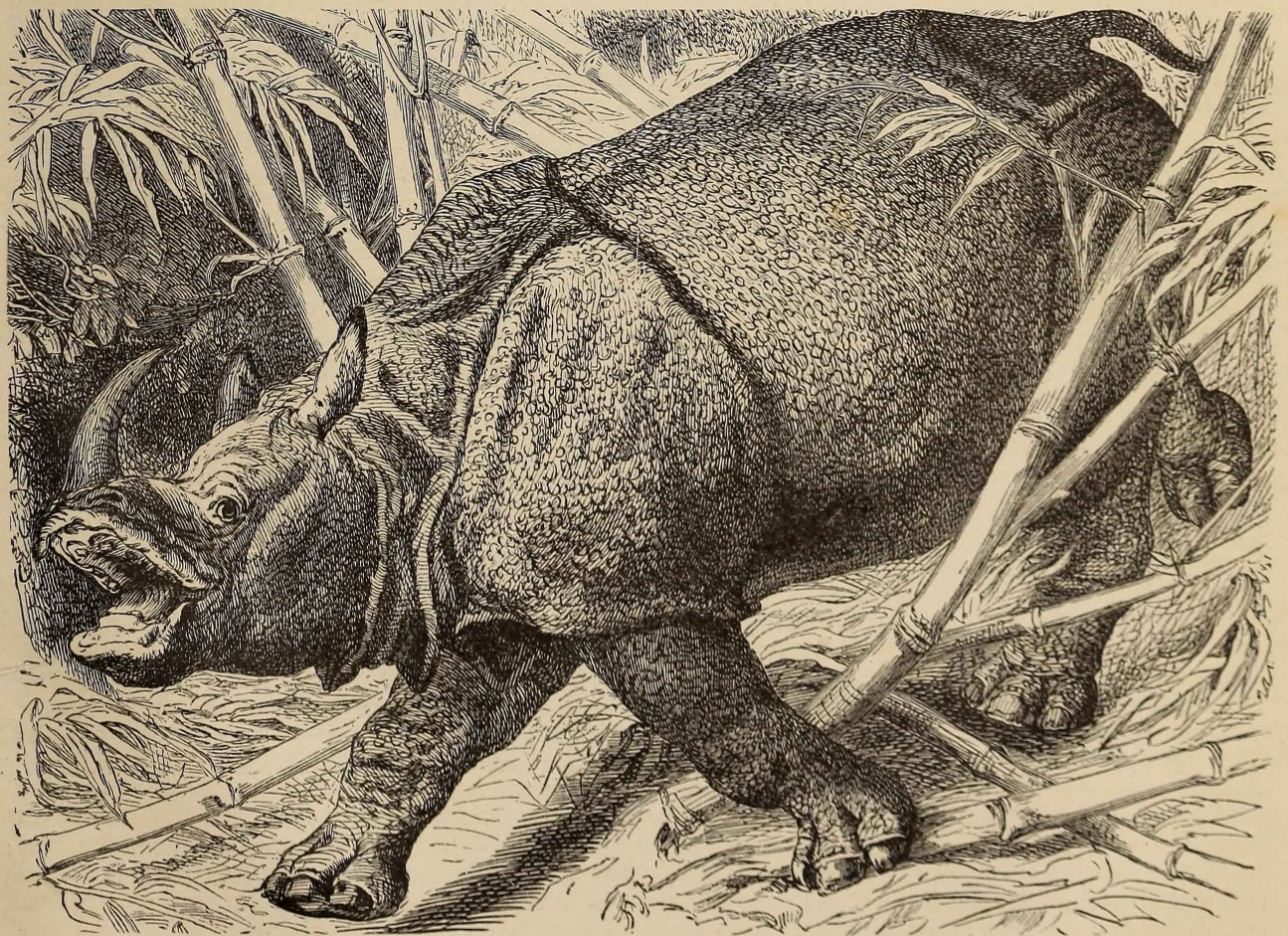
Indisches Nashorn ( Rhinoceros indicus ). \frac{1}{30} .