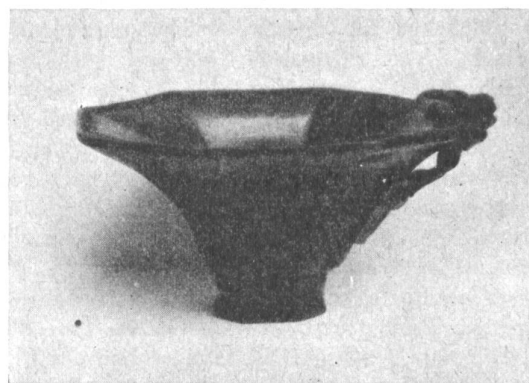
Bilder 3–5: Becher aus Rhinoceroshorn, aus Kanton (China), jetzt im Museum für Völkerkunde, Basel.