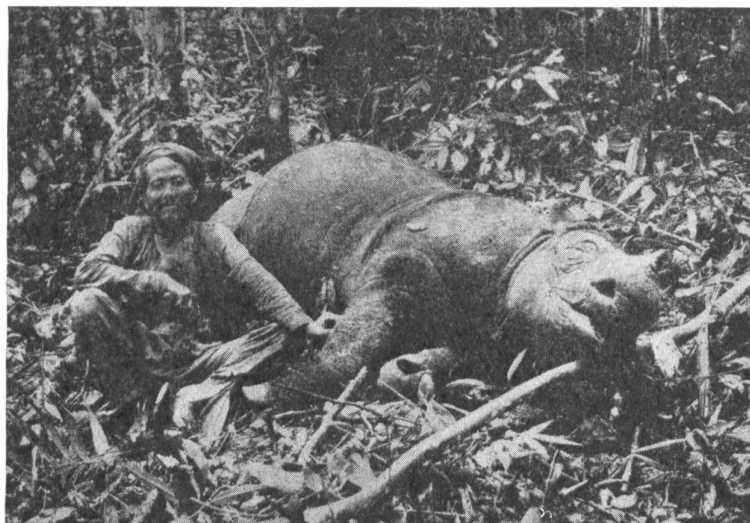
Bilder 1 und 2: Von einem Eingeborenen erbeutetes Sumatranisches Nashorn.