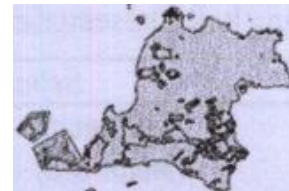
Gambar 1 Kesesuaian habitat badak jawa ( Rhinoceros sondaicus Desmarest 1822) di TNUK