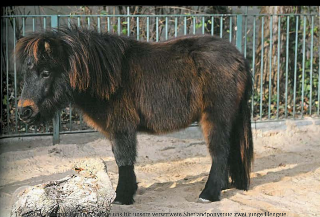
1. Zoo Tierpark Berlin schenkte uns für unsere verwitwete Shetlandponystute zwei junge Hengste.