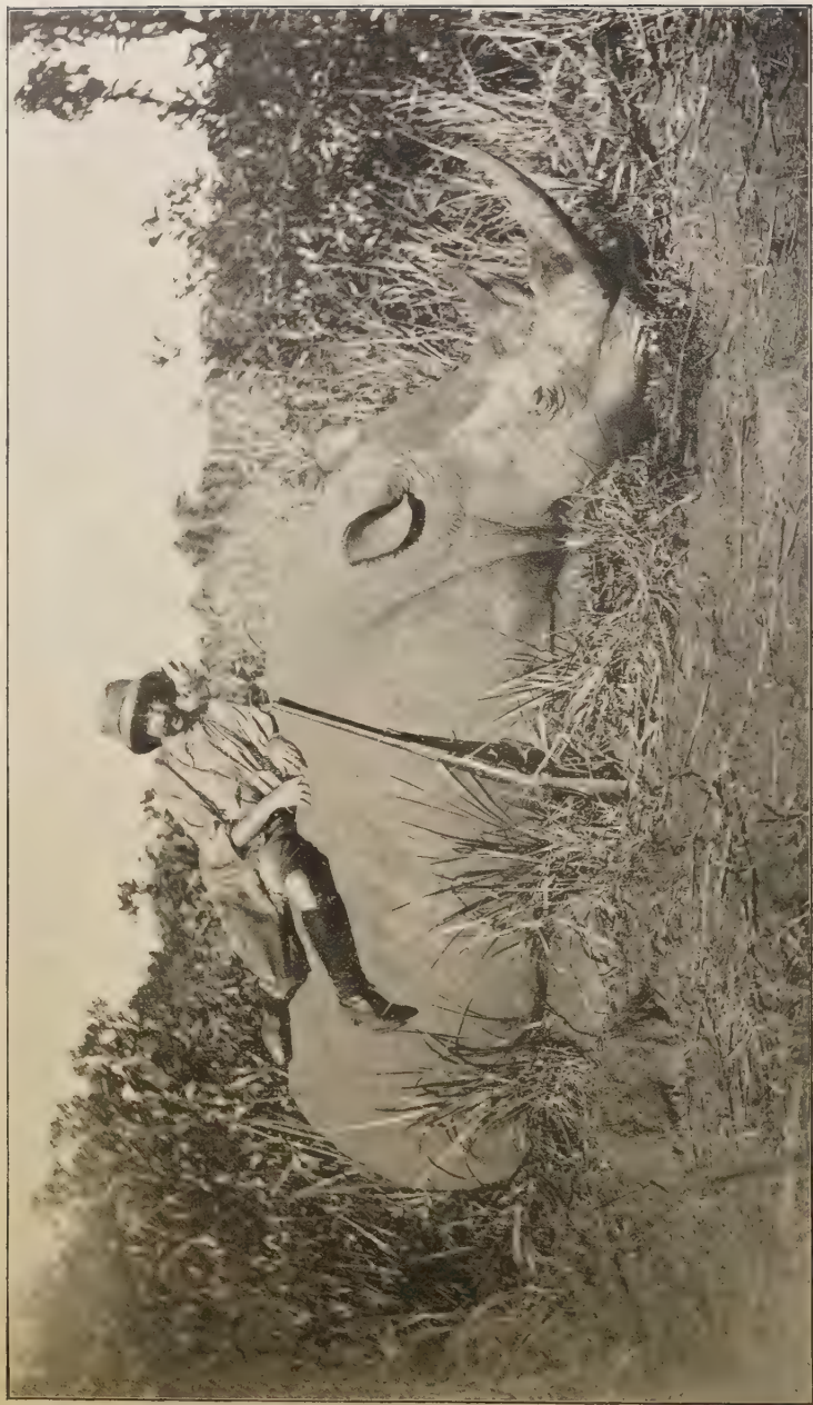
Fig. 27. — Rhinocéros blanc du Haut Uélé, tué par M. Lebrun.