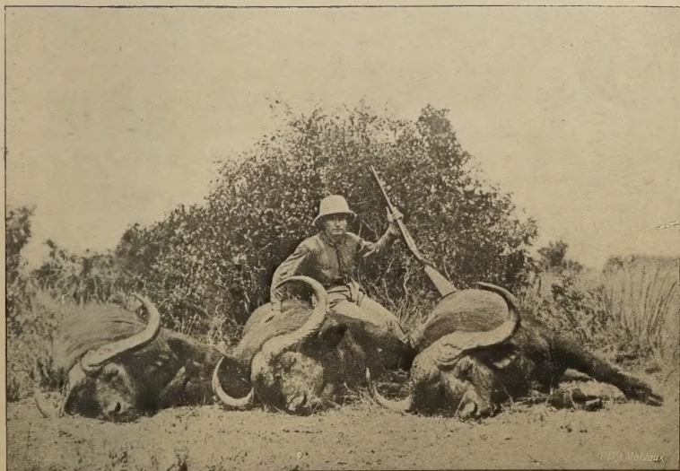
Buffles noirs de la Province orientale.