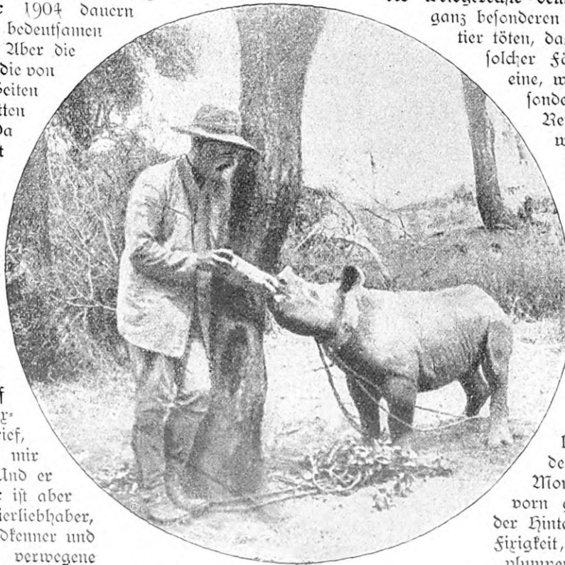
Der Afrikareisende Schillings als Nashornamme.

Natürlich ist es ein Augenblick höchster Spannung, wenn der Jäger inmitten dickster Dornenwildnis plötzlich auf kaum hundert Schritt eine Nashornmutter erblickt in Begleitung eines einige Monate alten Jungen. Dann heißt es kurz entschlossen handeln. Die Büchse an den Kopf, und im nächsten Moment wirft sich, spitz von vorn getroffen, die Alte auf der Hinterhand herum, mit einer Sirigkeit, wie man sie solchem „plumpen Dickhäuter“ nicht im entferntesten zutrauen sollte. Auf