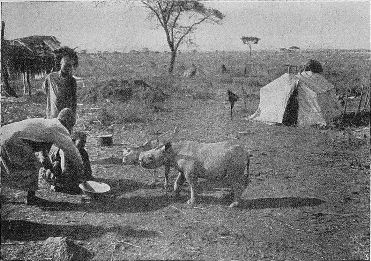
Das junge Nashorn erwartet seine Mahlzeit.