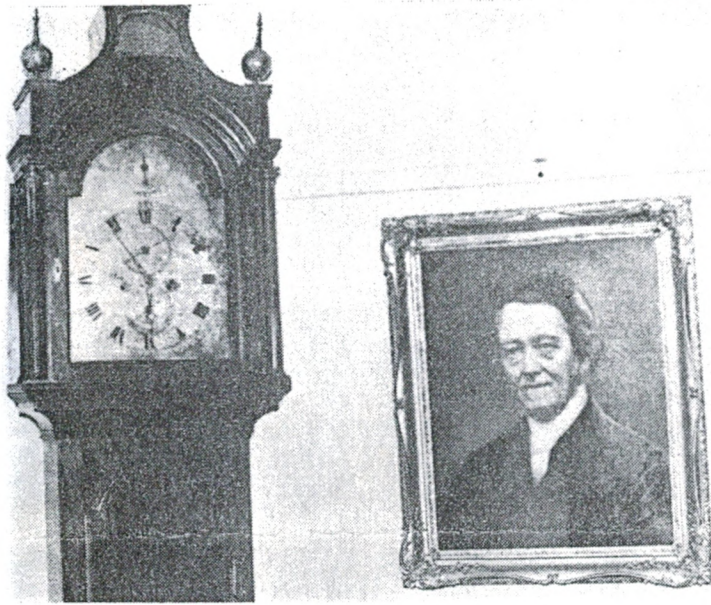
Die oorspronklike „Grandfather clock“ wat tagtig jaar lank in die pastorie op Graaff-Reinet die sekondes afgetik het langs-aan 'n olieverfskildery van die eerste Andrew Murray.