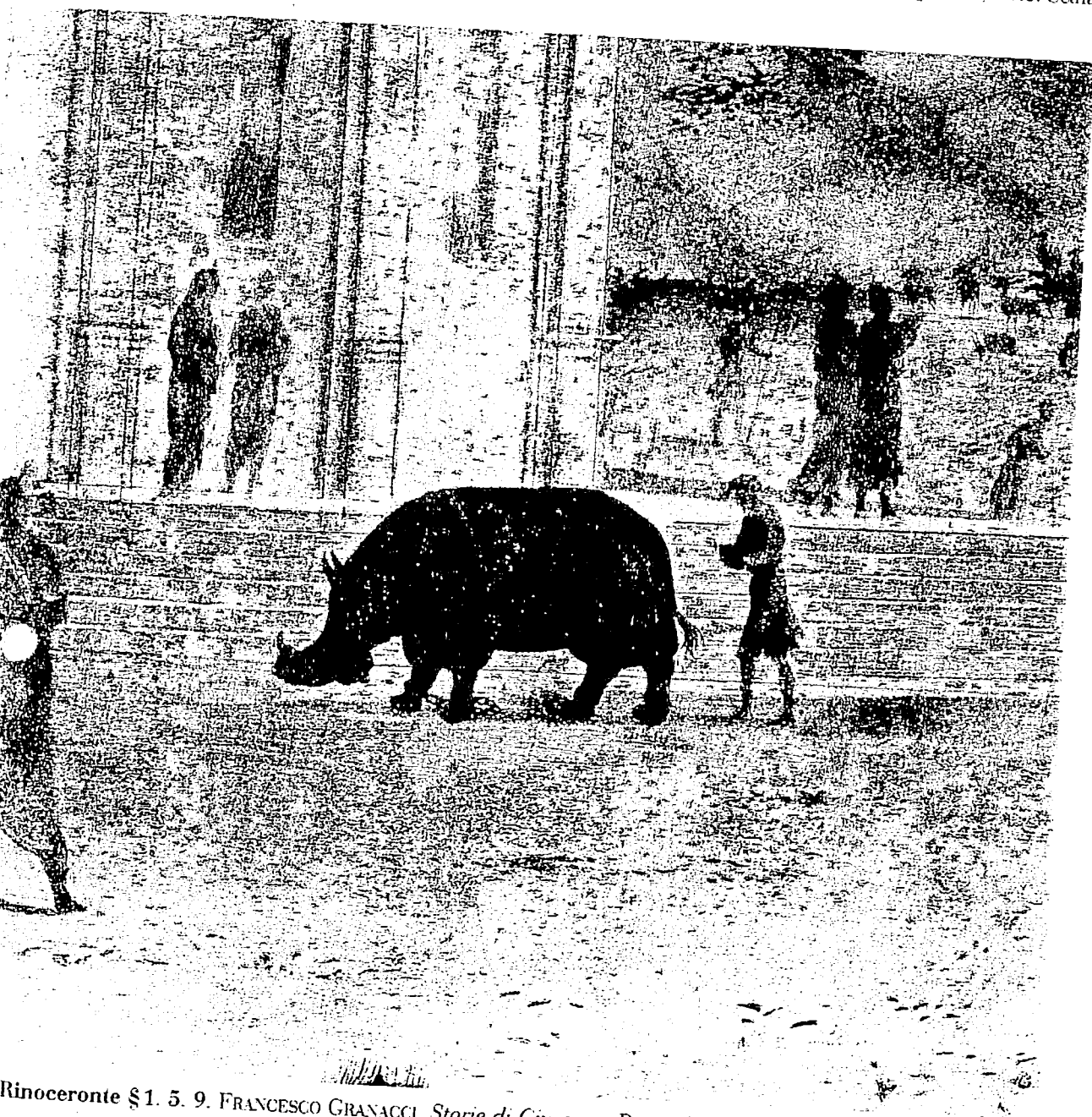
Rinoceronte §1. 5. 9. FRANCESCO GRANACCI. Storie di Giuseppe . Particolare