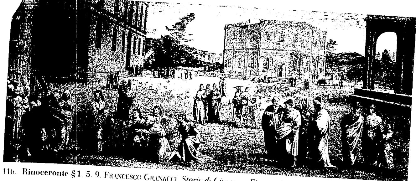
116. Rinoceronte §1. 5. 9. FRANCESCO GRANACCI. Storie di Giuseppe , Firenze. Uffizi. Tavola Bogherini.