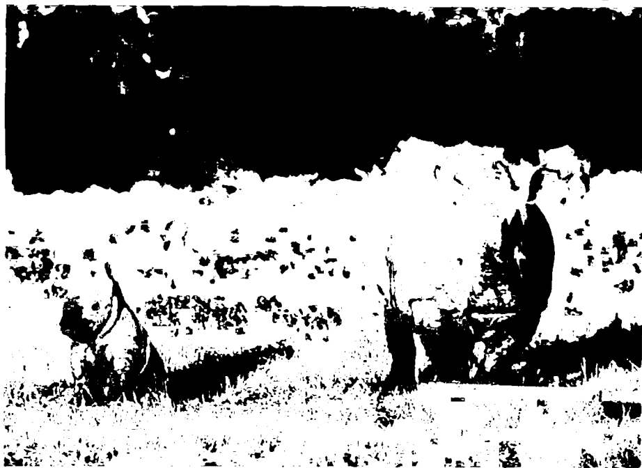
Prolifique - Famille de rhinocéros blancs du parc Kruger.