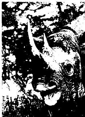
Pointu! — Comme laèvre supérieure du rhinocéros noir.

En Asie, les espèces de Java et de Sumatra parviennent à survivre dans quelques