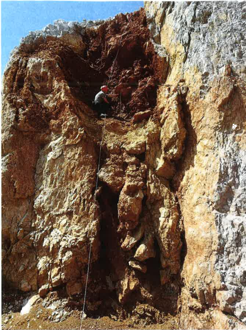
Slika 1: Najdišče 5 v kamnolomu Črni Kal v marcu 2020.

Sprva smo vse ostanke nosorogov zmotno pripisali merkovemu nosorogu (Polak in sod., 2023). Podrobnejši nedavni pregled pa je pokazal, da večina ostankov pripada manjši vrsti nosoroga Stephanorhinus hundsheimensis (Toula, 1902).