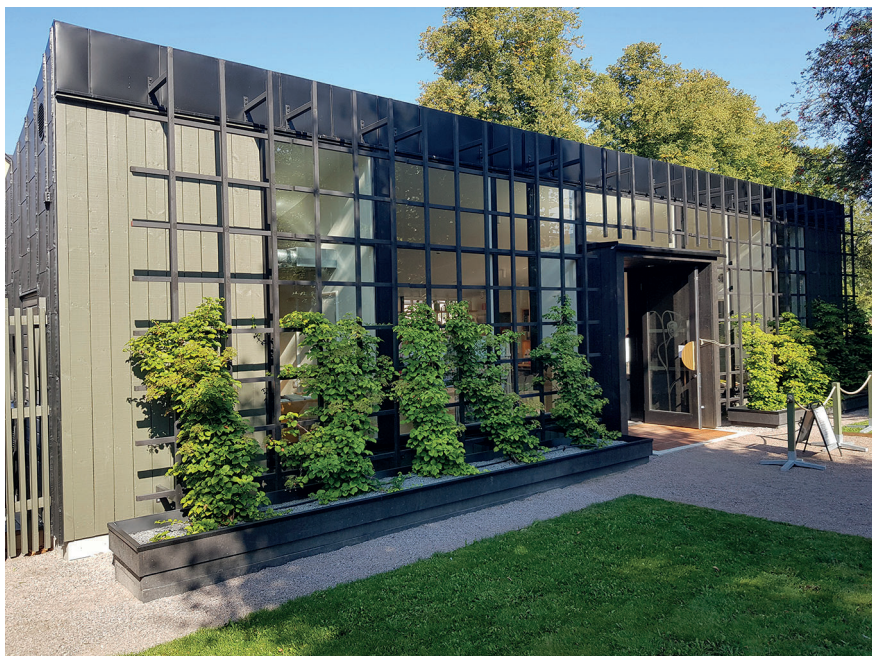
Linnéträdgårdens nya entrébyggnad sedd inifrån förgården.

NY ENTRÉ TILL LINNÉTRÄDGÅRDEN. Inför Linnéjubileet 2007 uppfördes en temporär entrébyggnad i Linnéträdgården, placerad till vänster när man gick in genom grinden vid Svartbäcksgatan. Denna ritades av arkitektfirman Hide-mark & Stintzing. Byggnaden var ett provisorium, med tillfälligt bygglov, som fick stå kvar till hösten 2021 (se SLÅ 2022, 213). Därefter utfördes arkeologiska utgrävningar på platsen. I september 2023 kunde en ny entrébyggnad invigas på samma plats och den togs i bruk i maj 2024 när Linnéträdgården öppnades