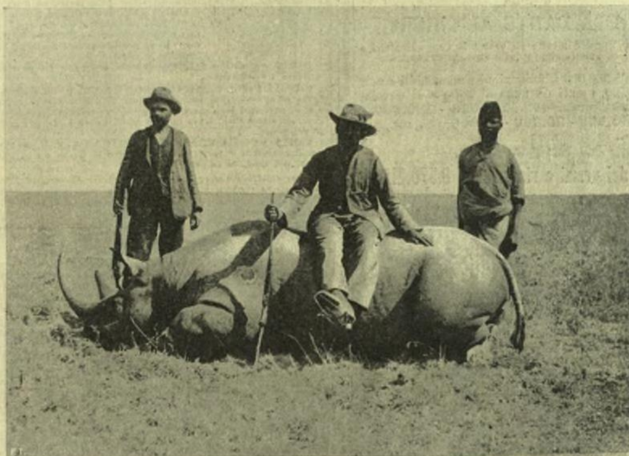
La caccia al rinoceronte.

Questa montagna dell'Africa tropicale fu già la meta agognata di moltissimi esploratori ed alpinisti, i quali avevano tentato vanamente, a