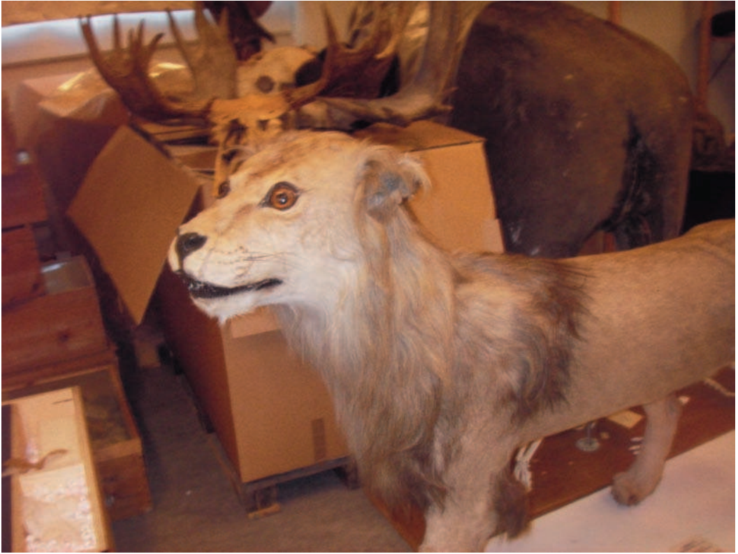
Thunbergs lejon, numera bevarad i uppstoppad form i Evolutionsbiologiska museets samlingar vid Uppsala universitet.

Thunberg noterar att det var också besynnerligt "att om hunden sedan flere gånger kastades på Loën, bjöd hvarken den förra till, att vidare angripa, eller den sednare, att försvara sig". I vilken utsträckning sådan djurhetsning fortfarande var vanlig