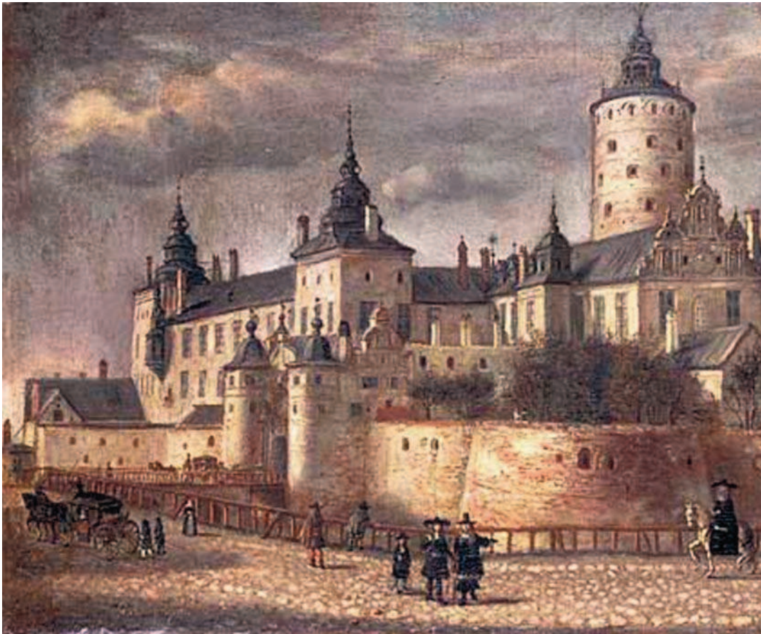
Fig. 1. Lejonkulan invid vallgraven till Stockholms slott. Oljemålning av Govert Camphuysen 1661 (Uppsala universitetsbibliotek).