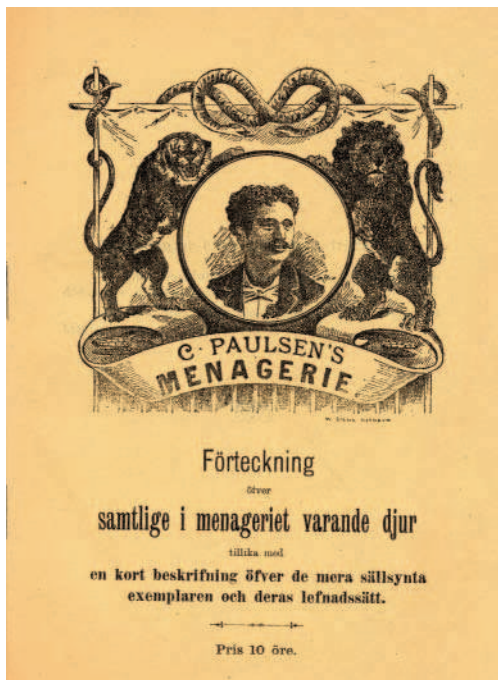
Katalogomslag med lejon och tiger till C. Paulsens menageri.

som i så fall skulle kunna vara ett exemplar av den likaså försvunna underarten kaplejonet, Panthera leo melanochaitus Ch. H. Smith, 1842. Men även ett nubiskt lejon fanns i samlingarna. Vidare hade man flera lejonungar, som var födda i menageriet: tre var födda 1894 och tre ungar var födda i danska Viborg den 25 juni 1895. Vidare hade man en tiger, flera svarta pantrar och leoparder, gepard, jaguar, serval, ozelot, isbjörn, brunbjörn från Norge, japansk björn, näsbjörn, tvättbjörn-