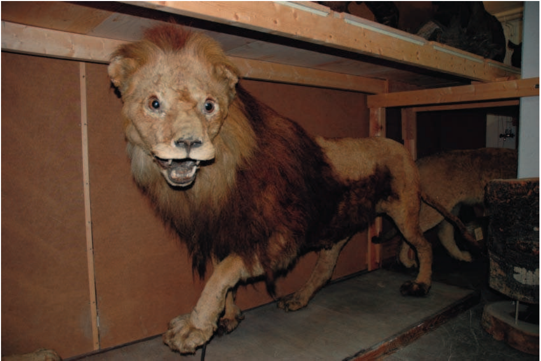
Lejon från Djurgården som var uppställt i Grills naturaliekabinett på Söderfors i nordöstra Uppland, numera i Naturhistoriska riksmuseets samlingar.

Kungl. Vetenskapsakademien, och det finns fortfarande kvar i Naturhistoriska riksmuseets samlingar. 23