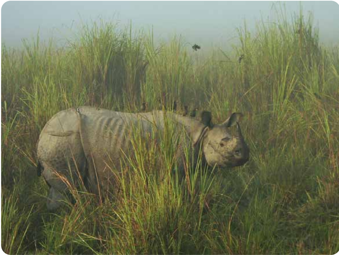
Rhinocéros Indien ( Rhinoceros unicornis ).

Les rhinocéros blancs ( Ceratotherium simum ) et les rhinocéros noirs ( Diceros bicornis ) d'Afrique sont inscrits en Annexe I de la CITES sauf les populations de rhinocéros blancs de l'Eswatini et d'Afrique du Sud inscrites en Annexe II pour les animaux vivants et les trophées de chasse.