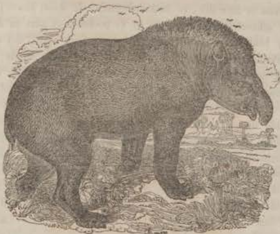
DE GEWONE TAPIR.

heeft witte ooren, en de geheele bovenhelft van den romp, van achter de schouders af, is insgelijks wit.