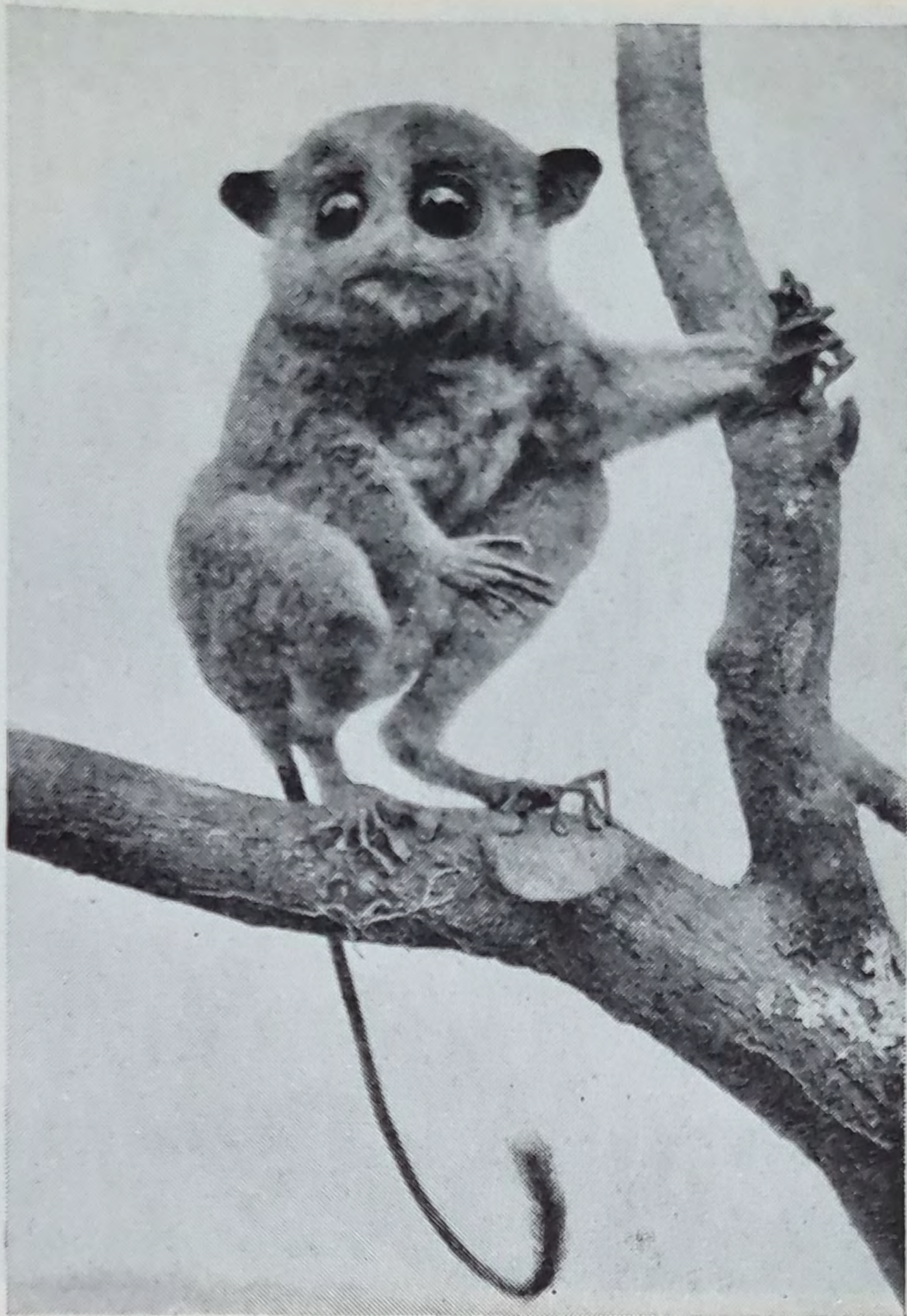
Tarsius tarsier saltator Ell. Spookdiertje, Tarsier, Krabuku.

5. Neushoorns ( Rhinoceros sondaicus en Dicerorhinus sumatrensis ). In de Indonesische Archipel komen twee soorten neushoorns ( Badak ) voor, waarvan er één, de Javaanse ( Rhinoceros sondaicus ), beperkt is tot enkele streken van West-Java en Sumatra, en reeds zo goed als uitgeroeid is. De tweede soort, welke, in tegenstelling met de Javaanse, twee kleine hoorns op de kop draagt, bewoont Sumatra en Borneo, waar hij echter sterk in aantal afneemt. Buiten Indonesië komen beide soorten voor in Malaya, Tenasserim en ten dele nog in Assam, doch ook hier in slechts enkele exemplaren.