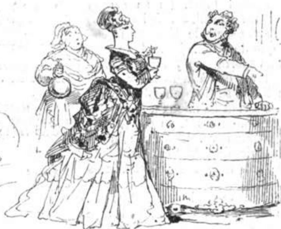
RÉPÉTITION D'ÉLOQUENCE PARLEMENTAIRE POUR LA RENTRÉE.

— Mon cher directeur, je meurs avec le regret de ne pas avoir assez fait pour la France. — Adieu, mon ami, adieu! Quant à moi, je ne saurais plus vivre ici sans toi, je donne ma démission.