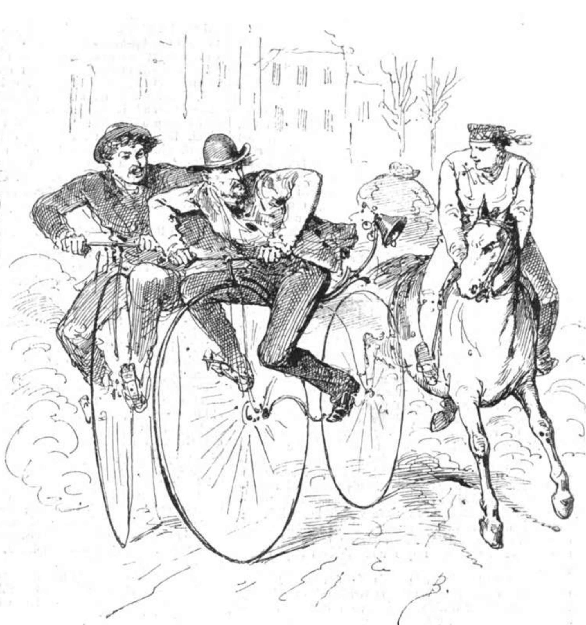
LES VÉLOCIPÈDES PERSÉCUTÉS.

— Pas de cas d'exemption? — Aucun. Seulement je désirerais être exempté d'aller à pied; je voudrais être dans les hussards. — A quatre roues.