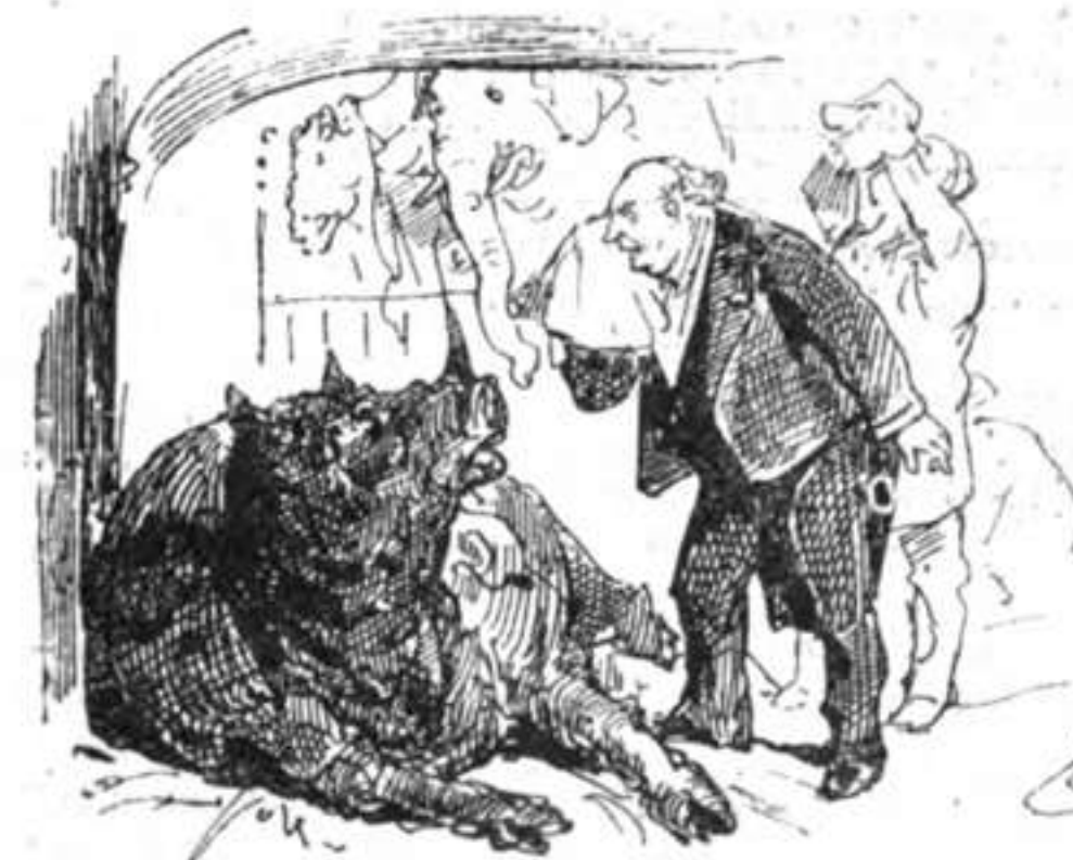
1 MORT DU RHINOCÉROS.

— C'est encore le meilleur poussin sorti des œufs d'Offenbach; allez plutôt voir aux Variétés la pièce de Gilie et Sardon, à la Renaissance celle de Leterrier et Vanloo. Deux attractions!!