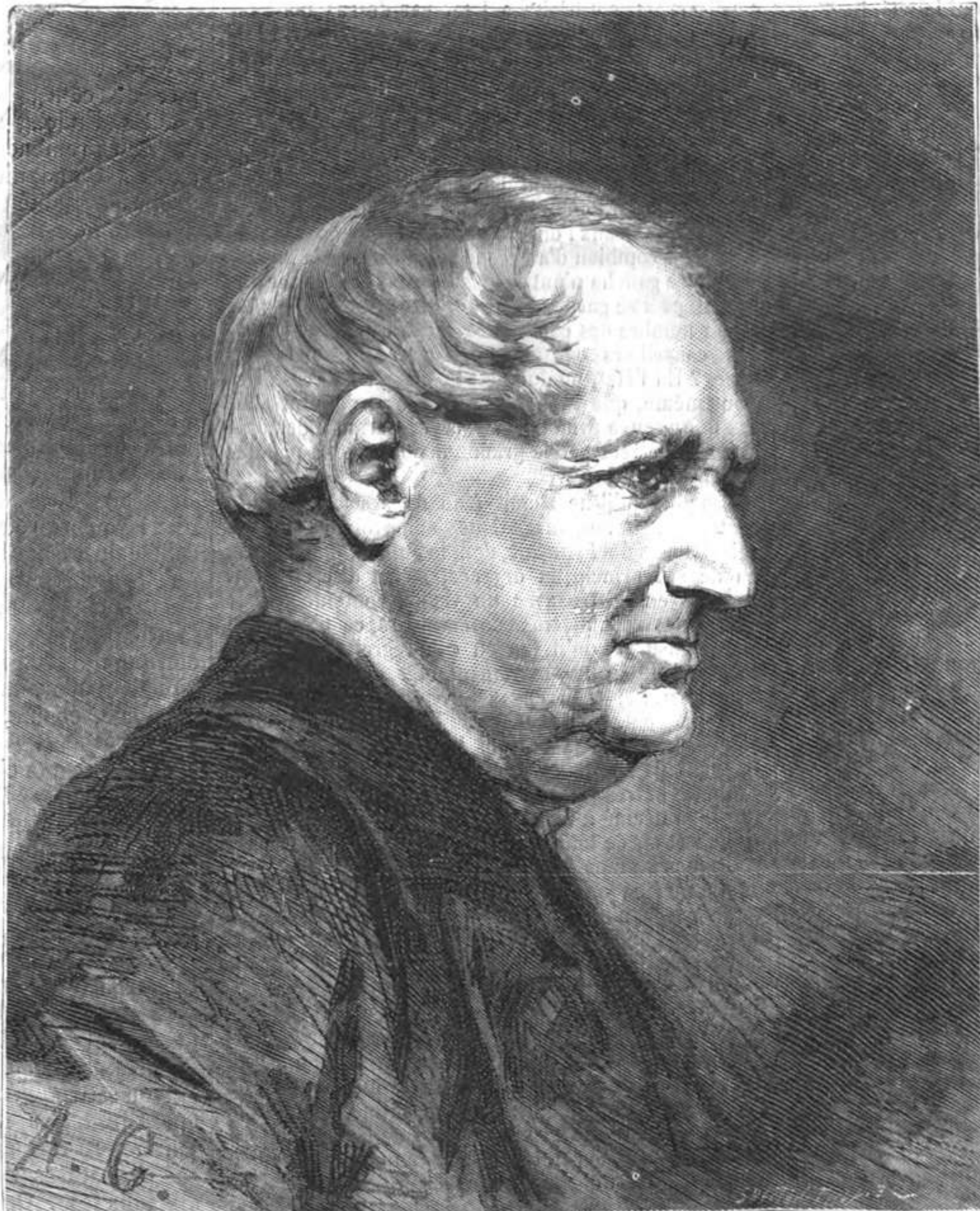
HENRI MONNIER.

Henri Monnier. Les élections municipales : une réunion électorale dans la banlieue de Paris. Le drame de la Rochette (Charente) : un loup enragé, trois victimes. L'explosion de Saint-Denis : Atelier pour la préparation du violet de Paris; Chaudière servant à la fabrication du rouge d'aniline; Atelier pour la fabrication du bleu d'aniline; Aspect des ruines de l'usine Poirier après l'explosion. L'Albanie et le Monténégro : Scutari d'Albanie. Revue comique du mois, par Bertall (9 sujets). La nouvelle frégate cuirassée la Galissonnière . Rébus.