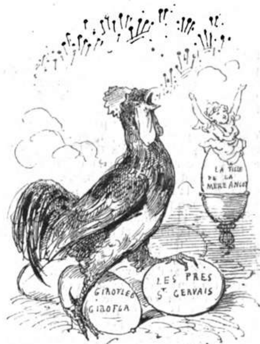
M. le coq, M. le coq, M. le coq.

— Vous verrez que tous ses petits, tous ses poussins et toutes ses cocottes envahiront toutes les scènes! A quand le Gymnase, l'Odéon et le Théâtre-Français?