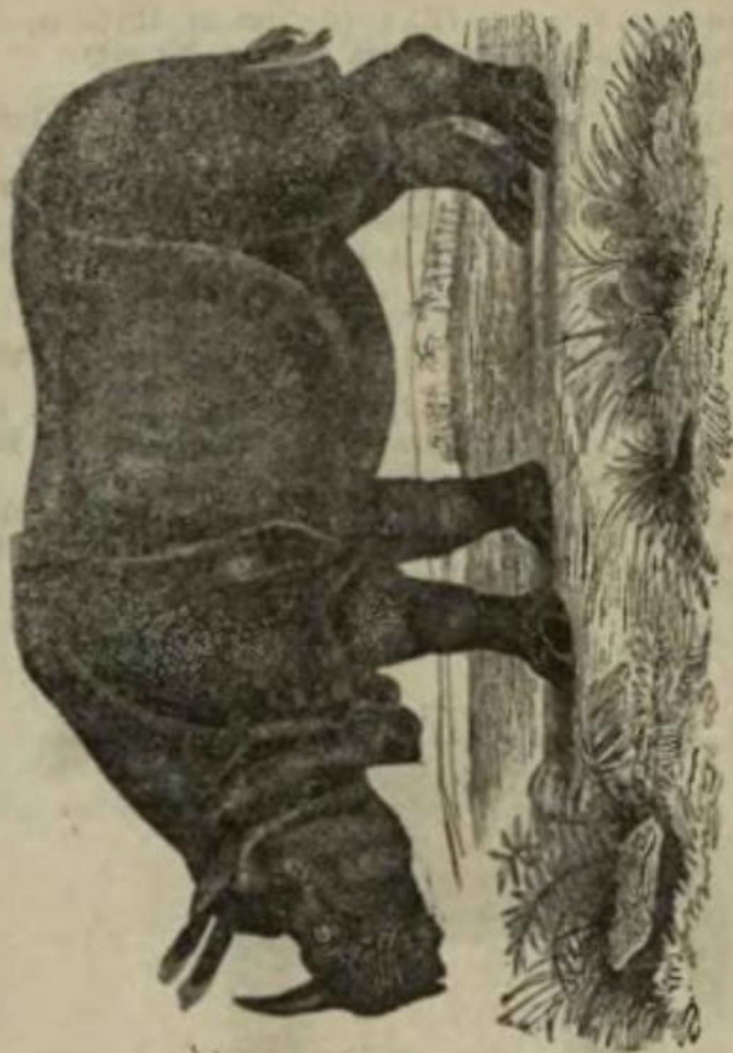
Obr. 62. Nosorožec indický.

Žije nyní již jen při řekách a jezerách středoafriických a živí se rostlinami; plove velmi obratně a vydrží delší čas pod vodou. Člověku poskytuje masa, pevné kůže a klů, jichž upotřebuje se podobně jako kosti slonové.