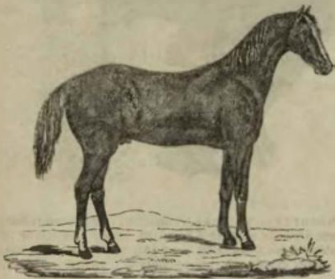
Obr. 68. Kůň anglický.

Jsou to velká zvířata, živící se rostlinami. V divokém stavu obývají v četných zástupech roviny a pouště starého i nového světa, vyjma Evropu a Australii.