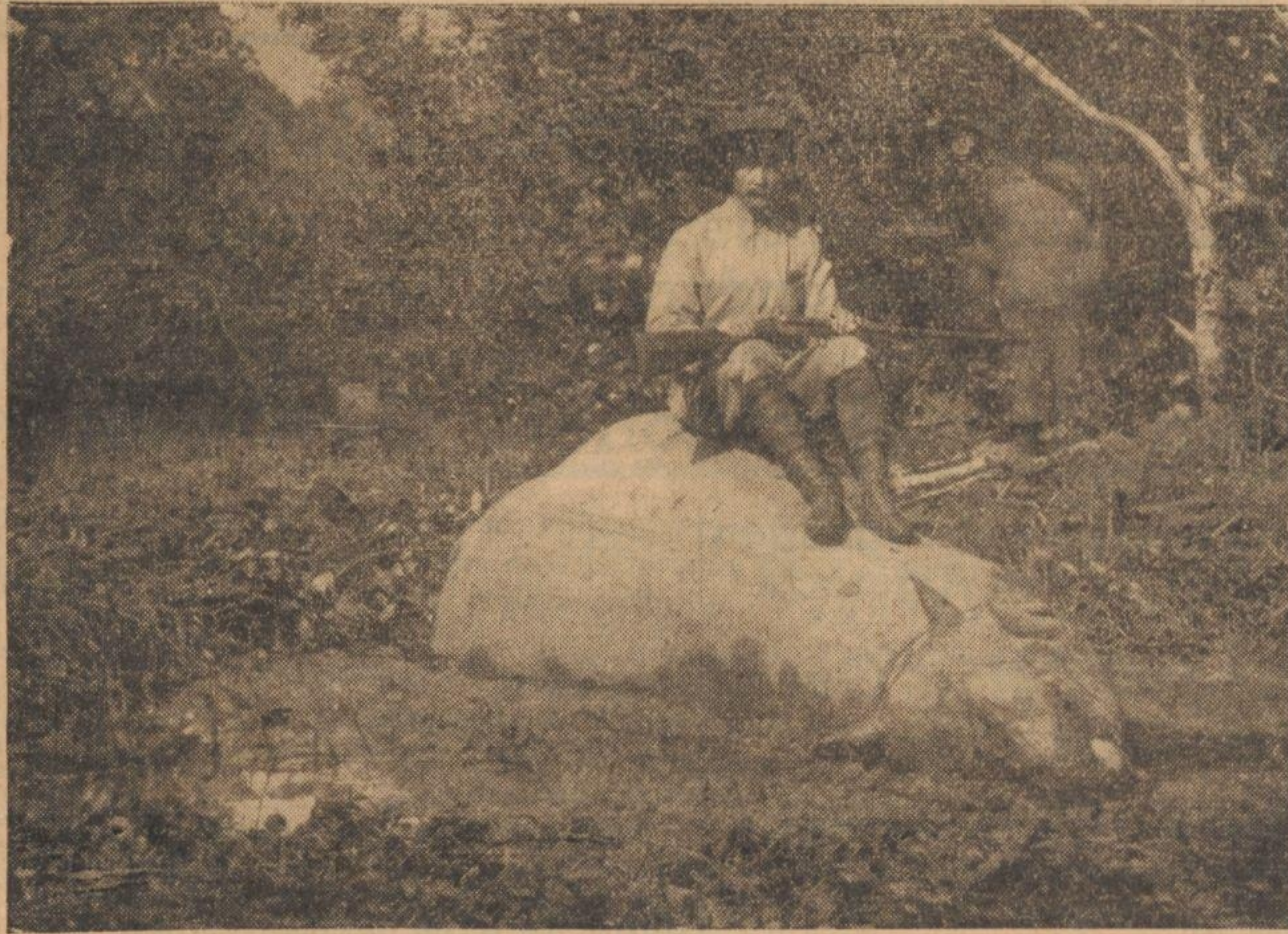
Dertig jaar geleden, toen het in Oedjoeng Koelon nog wemelde van neushoorns. Sedert dien zijn er heel wat van de thans nog sporadisch voorkomende badaks gestroopt.

Tot driemaal toe zag de heer H. neushoorns op zijn weg, eenmaal in een modderbad, waaruit het dier werd opgejaagd en wegliep. Doch toen de heer H. bezig was