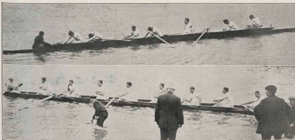
De beroemde roeiwedstrijd van het voor-seizoen tusschen Cambridge en Oxford is door eerstgenoemde ploeg gewonnen. Men ziet op onze eerste foto in dit nummer Oxford uitgeroeid na den kamp en daaronder de nog frische sportsmen uit Cambridge.

Vraagt prijscourant met beschrijving en conditiën Prinsengracht 581/83 Amsterdam