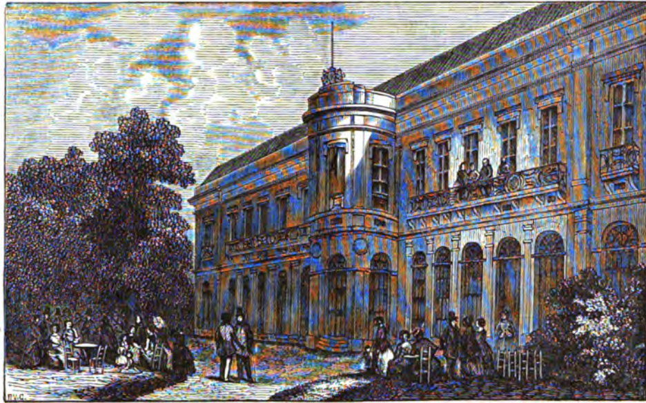
HET GEBOUW VAN HET ZOÖLOGISCH GENOOTSCHAP UIT DEN TUIN TE ZIEN