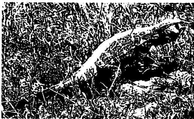
'n Waterlikkewaan stryk aan na sy skulplek te 'n miershoop. Weg is hy! Die likkewaan verdwyn in sy gat.