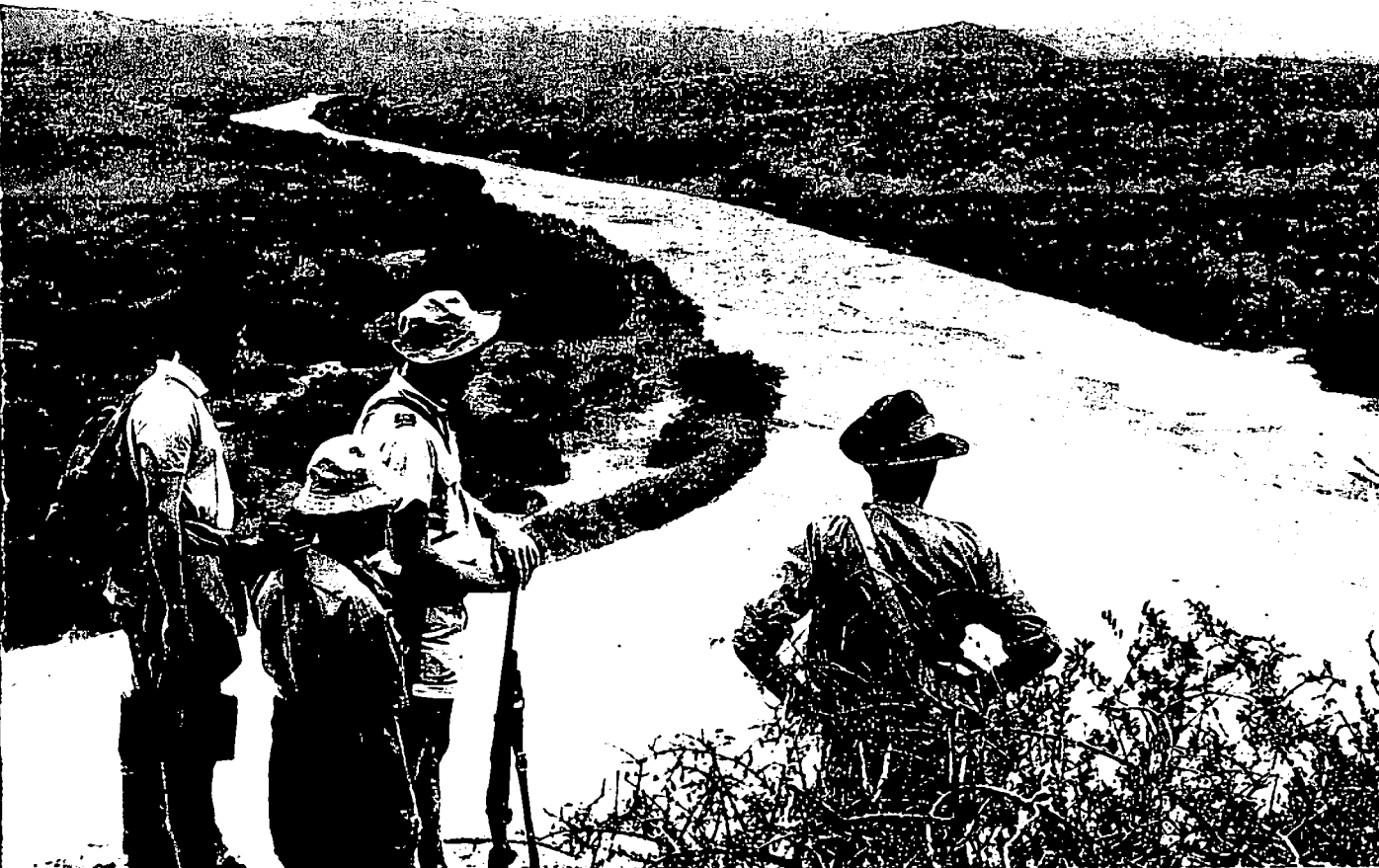
Vanaf 'n plat rots, honderde voete bokant die droë rivierbedding van die Wit Umfolozi, het ons op die ongerepte natuurskoon afgekyk.

Toe die wildreservaat in 1958 heropen is, het die Natalse Parke, Wild- en Visbewaringsraad besluit om sowat 30.000 acre as 'n wildgebied opsy te sit. Gedurende die afgelope paar jaar is dit aansienlik uitgebrei