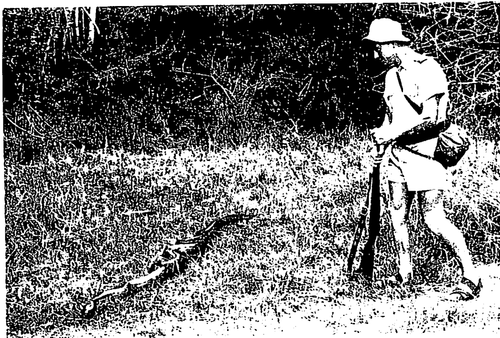
Hoewel onskadelik, het hierdie reuse tuislang ons weer eens herinner aan die gevare van die boswêreld.