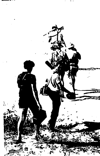
Op pad — met dapper en stapper.