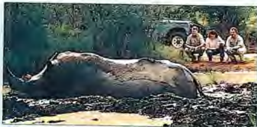
Expositie helm olifanten neushoorn in Mkhaya

Maar eerst nog een stukje cultuur, we gingen naar de Swazi-market. Een marktplaats waar de lokale bevolking houtsnijwerken en andere souvenirs aan de toeristen probeert te verkopen. Alles voor speciale prijzen natuurlijk! Er waren echte kunstwerken bij en we verliepen de markt met een grote en een kleine houten giraf, een stenen olifant, een stenen neushoorn, maskers, uitgesneden poppetjes, auto's gemaakt van staaldraad en diverse kettinkjes en armbandjes. Wij zorgden er wel voor dat de Swazi economie bloei draaie! Na de markt gingen we naar de kaarserlabriek, waar je kaarsen in allerlei (dieren)vormen en maten kunt kopen. Ook hier werden leuke souvenirs gekocht.