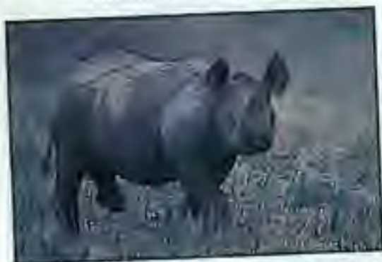
Jonge zwarte neushoorn in Mkhaya Game Reserve

Jonge zwarte neushoorns in Mkhaya Afgelopen oktober is er in Mkhaya Game Reserve in Swaziland weer een zwarte neushoorn geboren. Dat 2001 een goed jaar was voor de zwarte neushoorns bewijst wel de geboorte van dit derde jong. Eind februari werd Mfunwa, een mannetje geboren. In mei werd er een tweede jong gebo- ren. De moeder was Mababatane en deze kleine was haar tweede jong. Het duurde een tijdje voordat de ran- gers het neushoornjong goed konden waarnemen om het geslacht te bepa- len. Ze ontdekten dat het een vrouw- tje was. Reden voor extra vreugde, hoewel we natuurlijk blij zijn met elke neushoorn die geboren wordt!