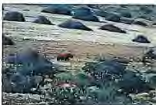
Zwarte neushoorn in Damoraland

Deze vijf dagen met Duncan in Damoraland waren erg bijzonder. We zagen in totaal vijf neushoorns; het eerste gedeelte van de Neushoorn Expeditie was hierdoor in ieder geval geslaagd! Maar het waren niet alleen de neushoorns die deze dagen tot een succes maakte. Het was vooral ook het indrukwekkende landschap; het welsde, de stilte, de kleuren, de dieren, de bomen en planten in bloei, alles bij elkaar heeft bij een ieder van ons een onvergetelijke indruk achtergelaten. Teruggelaten in de bewoonde wereld, namen we lekker een douche, want dat was