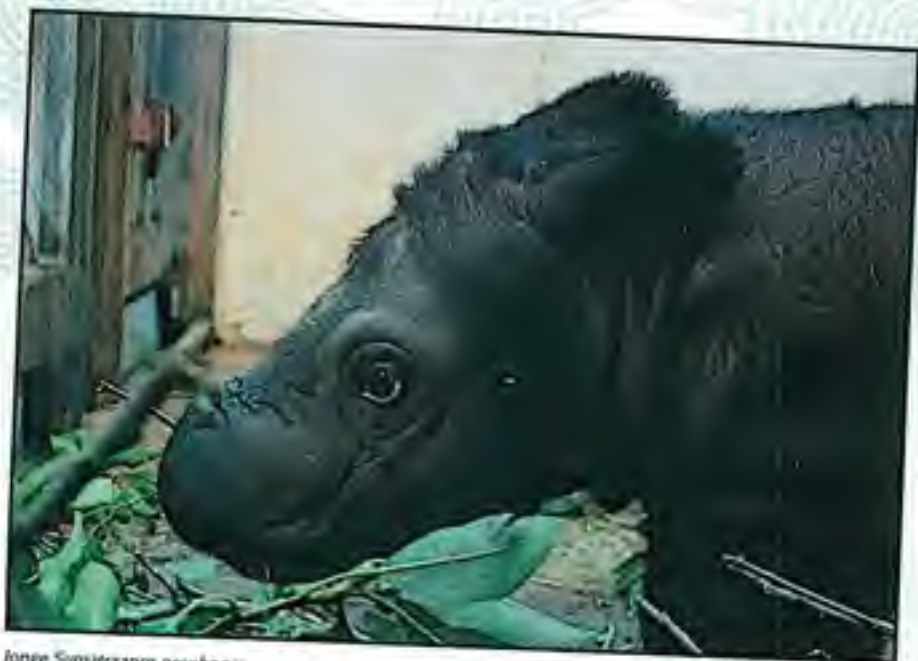
Jonge Sumatraanse neushoorn