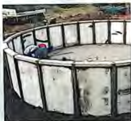
P.S.: Inmiddels is de uitkijkpost gebouwd

We zien in het nieuwe gebied een mooie uitdaging voor de Neushoorn Stichting Nederland: geld inzamelen voor de uitbreiding van het aantal waterplaatsen, d.w.z. voor de aankoop van waterleidingen en de bouw van waterbakken.