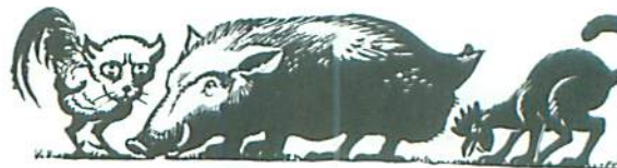
De produkten van de door Jodocus gepropageerde rasvermenging

Toch zijn er ook dieren, die hun eigen aard trouw wensen te blijven en uit dien hoofde weigeren belasting te betalen. 'Dien stand van zaken zag Jodocus gramstorig aan. Zoovelen waren er van zijn zaad gekomen in het land, dat het nodig was de heffingen steeds zwaarder te maken. Toen kwamen Boudewijn en zijn raadsheren bij elkander en Jodocus zei: "Zoo gaat het niet langer. Zoolang de dieren leven naar hun eigen aard, zal men nooit het regiment van vrijheid erkennen. Het is noodig, dat wij hen van hun aard vervreemden. Maar dat moet met verstand en overleg gebeuren. Wanneer zij in hun eigen sibbe blijven, zullen wij nooit bereiken, dat zij hun weg verliezen." Jodocus stelt nu voor dat in de toekomst dieren moeten inhuwen in families waarmee zij geen enkele verwantschap hebben. Belijn en Lietpit gaan met deze wet tot rasvermenging akkoord. 'Zij beseften niet, dat Jodocus die zich met geen enkel der dieren van verre of nabij verwant voelde en die in zijn lompe lichaam alle heete lusten voelde van het Oosten en de vage verlangens,