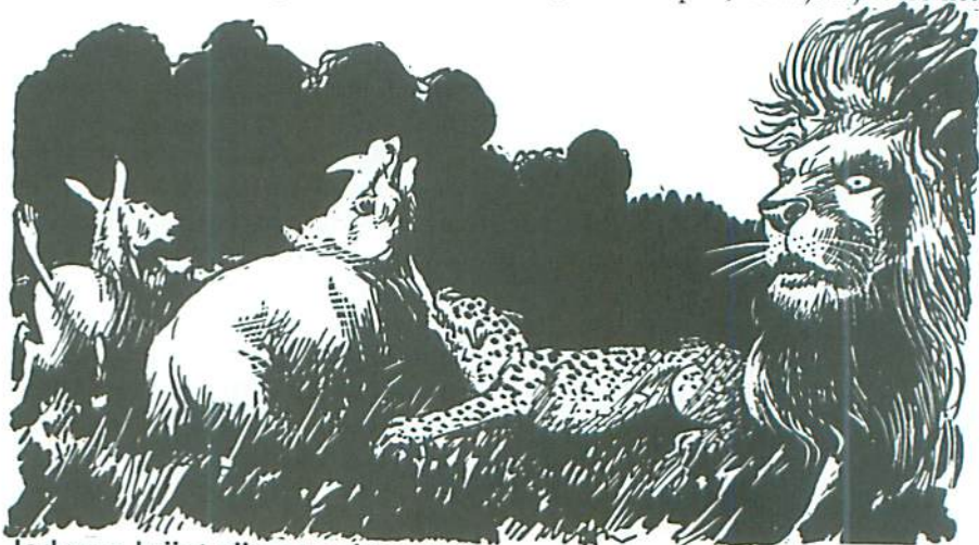
Jodocus krijgt zijn gerechte straf

'Maar plotseling verstarden allen, want daar was een machtige geeuw. En nog vóór zij bekomen waren, verscheen de jonge leeuw, gevolgd door zijn getrouwen. Zijn manen stonden als een vurige zon rond zijn hoofd en er lag een diepe wilde blik in zijn oogen. "De leeuw, de leeuw!" riepen alle dieren, die rond Boudewijn stonden. "De leeuw?" vroeg Jodocus. "Ja, ja, Jodocus," zei Firapeel, terwijl hij reeds het