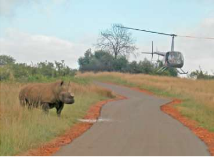
Foto 1: Onthoring operasie voltooi om te voorkom dat renosters gestroop word.