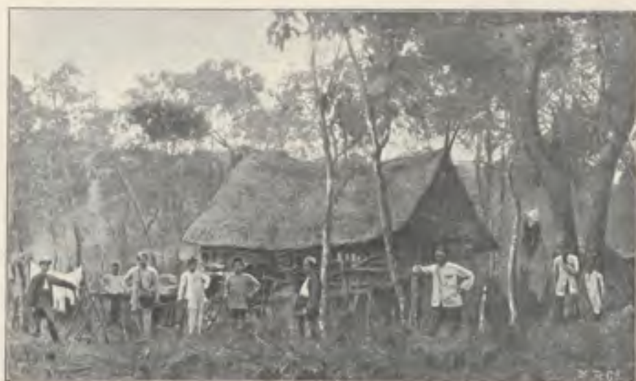
Kampement bij Padang Tarab (Tandjong Kalīng).

blijven. Door van den morgen tot den avond rijst te laten stampen, zou men spoedig een voldoende hoeveelheid voor den marsch naar Loeboek Ambatjang bijeen krijgen. Daar hoopten wij het verder benoodigde te vinden. Gelukkig hadden wij den nan batoea bij ons. Deze geslepen handelsman begreep, dat er geld te verdienen was en deelde ons mede, dat hij gaarne zooveel rijst zou inkoopen als wij verlangden. Hij wees er op dat in de negrieën Sarasak en Logei (waarlangs wij de onbewoonde woudstreek wilden bereiken) weinig of geen vee gevonden werd, en