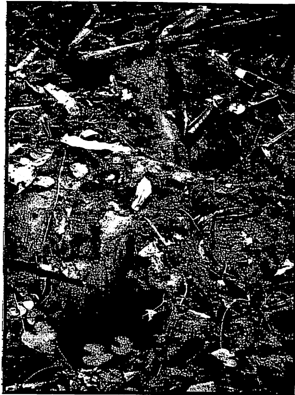
Op het spoor van de „tank”.....

Udde Bantengs op een weideplaats in Oedjoeng Koelon