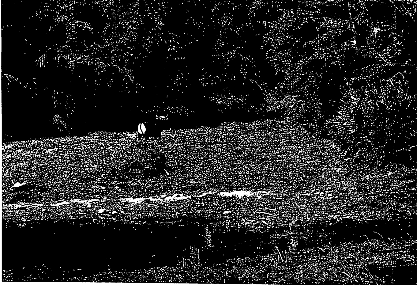
Prachtvolle opname van een Bantengstier, nabij een drinkplaats onraad bespeurend