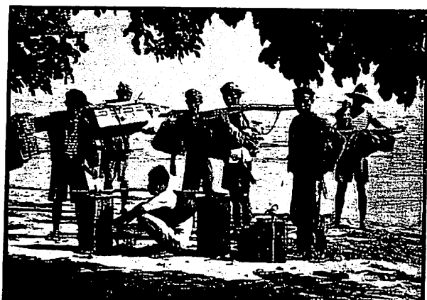
Onze zoo zeer gewaardeerde helpers, zonder wier hulp men in het wildreservaat Oedjoeng Koelon niet zou kunnen doordringen

N auw verbonden met den naam Oedjoeng-Koelon, die overigens feitelijk verkeerd is en ten rechte moet zijn Djoengkoelan, is de naam van een der interessantste dieren, die thans als relict van voorbije