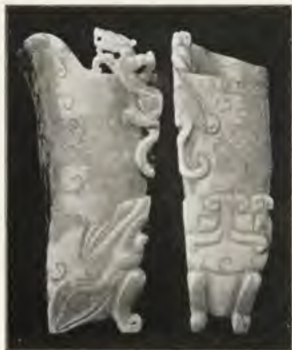
Afh. 4. Hoornvaas. Song-periode. Uit: Jade .

beeldt Laufer af in zijn „Chinese Clay Figures”, pag. 168. De een is uit de Han-, de ander uit de Chou-periode. 1) Ze zijn niet alleen om hun hoornvorm van bijzonder belang, doch ook vooral om den runderkop aan den voet. Hoewel deze kop plastisch is uitgebeeld met vrij gevormden snoet, ooren en hoorns, en de hoornpunt van het vat in dien kop uitloopt en niet, omgekeerd, de open bek de vaas omvat, behooren toch deze twee hoornbekers tot hetzelfde type als de drie beschreven vazen. Eenmaal de voet gemaakt tot een gestyleerden dierekop, min of meer natuurlijk weergegeven, werd gemakkelijk in analogie met het bestaande monstermasker rao-tie der sacrale ornamentiek deze stierekop tot een grootoogig aangezicht, dat ornamentaal één geheel vormde met het vaasvlak. Het omgekeerde is trouwens ook denkbaar: het masker gaf aanleiding, om in overeenstemming met de opnieuw waargenomen realiteit den ossekop plastisch uit te beelden. 2) Daar de eene kop een touw om de hoorns heeft gewonden, dat in teekening denzelfden stijl toont als het koordornament bovenaan op de Han-vaas en juist zit om het deel van den hoorn bij den wortel, hetwelk overeenkomt met het gedeelte van de vaas bij den mond, is 't vrij zeker, dat niet alleen de vaasvorm, maar ook dit „koord” van de Han-vaas zijn oorsprong in het eenmaal-werkelijk-tastbaarbestaende vindt. □