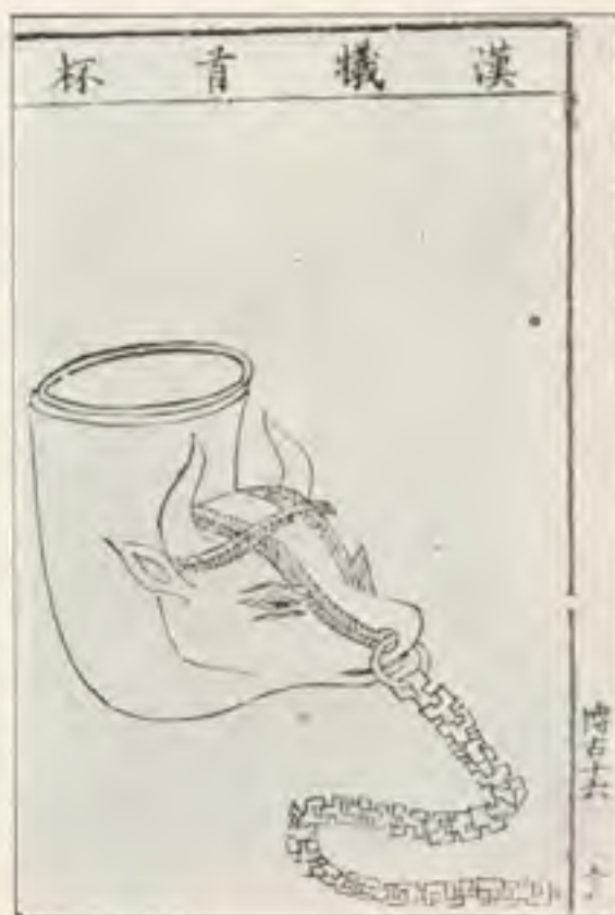
Afb. 5. Bronzen rhyton. Han-periode.

Zoo werd dus de hoornbeker in den Chou-tijd voor sacrale diensten gebruikt en bevestigden de klassieke teksten, dat de vazen van rhinoceroshoorn en de bronzen en jaden bekens in den hoorn-