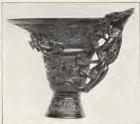
Afb. 6. Beker van rhinoceroshoorn. Coll. C. G. Kleykamp.

Zoo was 't de magische kracht van den rhinoceroshoorn, welke hem de religieuze beteekenis schonk. Dat onder de pa-pao , „Acht kostbare dingen”, een paar rhinoceroshoornen komen (ch'ieh) werden geplaatst, geeft er getuigenis van, hoe hoog die hoorn al de eeuwen door in China werd geschat. Geloof en vereering schiepen de sacrale hoornbekers in brons en jade der Chou- en Han-periode, welke in de Sung- en K'ien-lung-perioden bij de ontwakking der belangstelling voor de antieke vormen werden geroemd en in siervazen nagevolgd. □