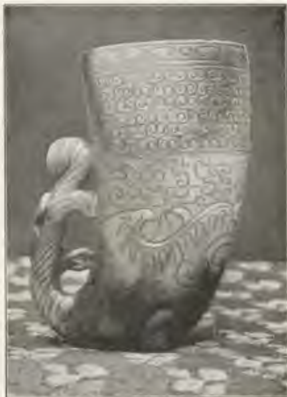
Afb. 3. Jaden Hoornvaas. Sung-periode. Uit: Ostas , Z. 1917.