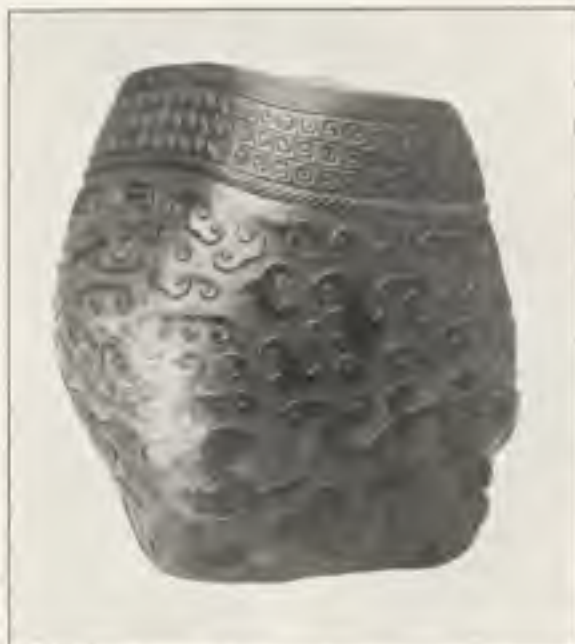
Afb. 2. Han-vaas.