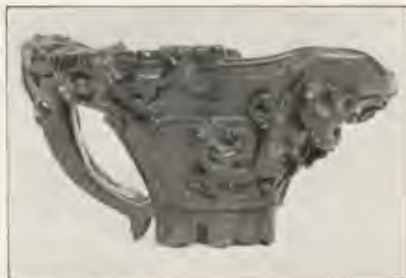
Afb. 6. Kops van rhinoceroshoorn. Coll. C. G. Kleykamp

stukken. Maar deze glanzende kostbaarheden zijn geen dragers van een grootsche idee: zij zijn een lust voor de oogen, geen verheffing voor den geest. Zij herinneren aan voortbijgegane grootheid, maar zijn niet meer dan een schaduw van het grootsche. Zij zijn niet bestemd voor de goden en de dooden, maar willen de levenden in hun vorstelijke pracht behagen. Werkstukken der verfijnde paleiskunst, missen zij de kracht der oorspronkelijkheid. □