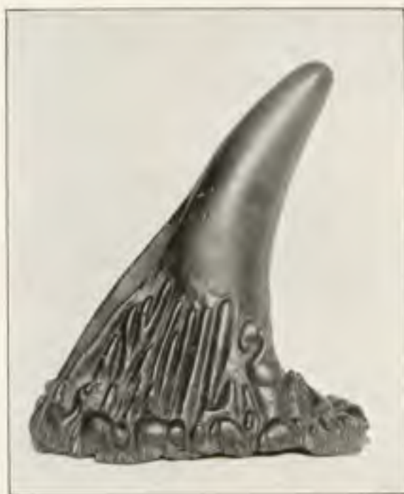
Afb. 8. Rhinoceroshoorn.

Door innige trouw aan de gewijde traditie en door onverzettelijk geloof in den adel der voorouderlijke cultuur, hebben de Zonen van Konfucius, al de eeuwen door, het monumentale karakter der eerbiedwaardige altaarkunst gevierd. □