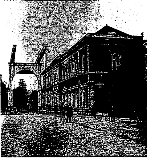
4 Het gebouw van het Zoölogisch Genootschap Natura Artis Magistra (Artis), waar tot 1990 op de eerste verdieping een deel van het Zoölogisch Museum was gevestigd. Architect Jan van Maurik inspireerde zich op de 'Grande Galerie' van het 'Muséum National d'Histoire Naturelle' in Parijs. Foto Pieter Oosterhuis, ca. 1865. Historisch-topografische Atlas, Gemeente-archief Amsterdam.