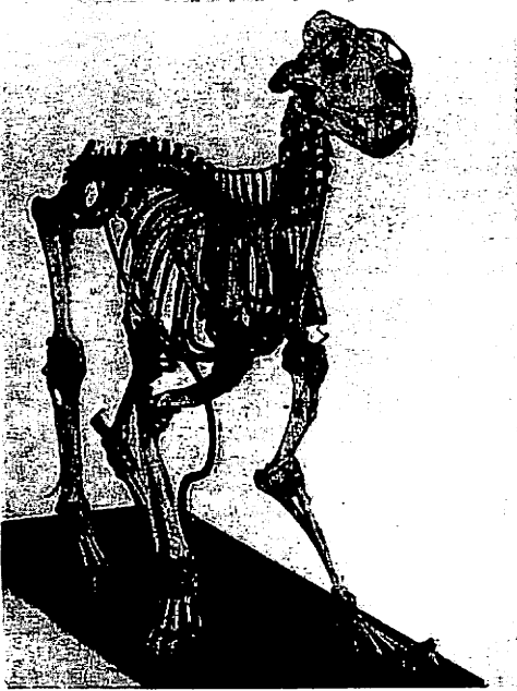
2 Gemonteerd skelet van een van de leeuwen uit de menagerie van koning Lodewijk Napoleon. Zoologisch Museum van de Universiteit van Amsterdam.